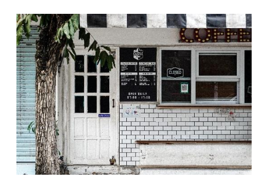
ภาพที่ 4.11 ภาพประตูของร้าน Castle Black BURIRAM

ประตูเป็นสีขาวบวกเขากับการตกแต่งหน้าร้านทำให้ดูสะอาดต่าง ประตูกึ่งทึบกึ่งโปร่ง ต้องการให้แสงสว่าง อากาศ หรือสายตาผ่านไปได้บ้าง แต่ก็ไม่ทั้งหมด เพื่อให้เกิดความเป็นส่วนตัว