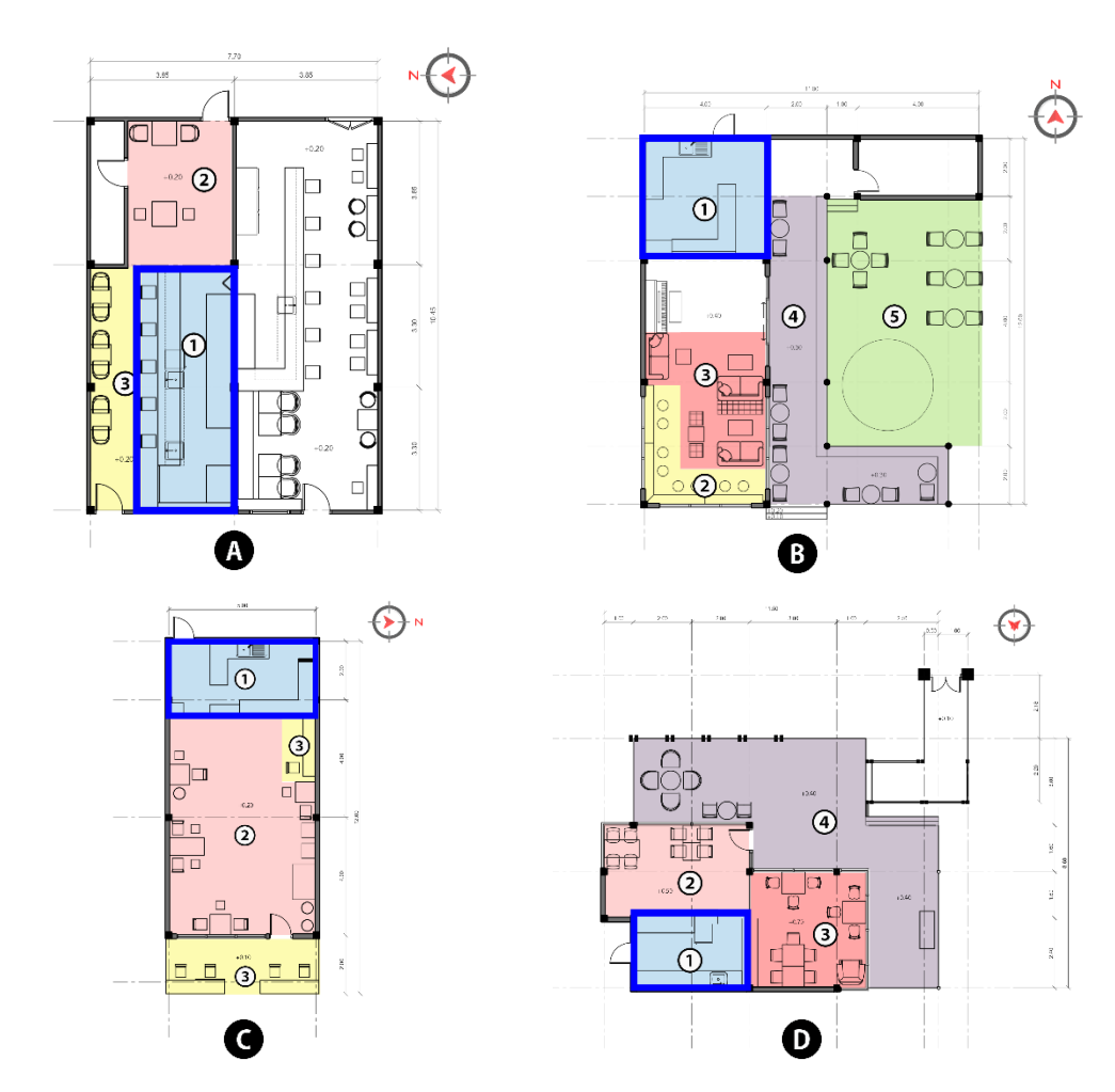
ภาพที่ 4.8 ภาพการวิเคราะห์ โซนเคาน์เตอร์บาร์