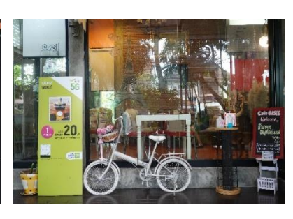
ภาพที่ 4.14 ภาพหน้าต่างของร้าน A Day Awesome Wake Up และ Cafe Oasis

ประตูและหน้าต่างกระจกใส ช่วงให้ร้านดูกว้าง แสงแดดส่องเข้ามาในร้านได้ ไม่ต้องเปิดไฟ ในช่วงกลางวัน ยังทำให้ลูกค้าหรือผู้ที่มาใช้บริการ เห็นบรรยากาศภายนอกร้านและเข้าถึงธรรมชาติ ต้องการให้คนภายนอกมองเห็นการตกแต่งภายในร้านดึงดูดความสนใจคนที่เดินทางสัญจรผ่านไปผ่าน มา