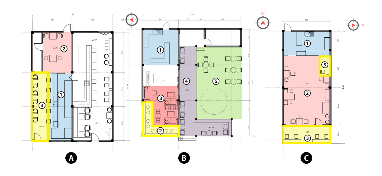
ภาพที่ 4.10 ภาพการวิเคราะห์ โซนโต๊ะบาร์

จะเห็นได้ว่าทั้ง 4 ร้าน มีโซนที่เหมือนกันคือ โซนเคาน์เตอร์ โซนที่นั่ง และโซนโต๊ะบาร์ ยกเว้น ร้าน Cafe Oasis BURIRAM ที่ไม่มีโซนบาร์เพราะว่าเน้นลูกค้าที่มาแบบเป็นกลุ่มใหญ่ ร้าน A Day Awesome และร้าน Cafe Oasis BURIRAM มีโซนเยอะเนื่องจากไม่มีข้อจำกัดในเรื่องของพื้นที่ รอบ ข้างไม่มีตึกแถว อาคาร ทำให้ลูกค้ามีบริการในด้านโซนที่หลายหลาย