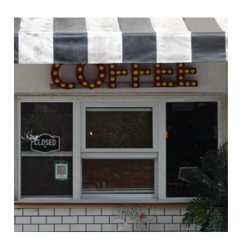
ภาพที่ 4.12 ภาพหน้าต่างของร้าน Castle Black BURIRAM

ประตูเป็นสีขาวบวกเขากับการตกแต่งหน้าร้านทำให้ดูสะอาดต่าง ประตูกึ่งทึบกึ่งโปร่ง ต้องการให้แสงสว่าง อากาศ หรือสายตาผ่านไปได้บ้าง แต่ก็ไม่ทั้งหมด เพื่อให้เกิดความเป็นส่วนตัว