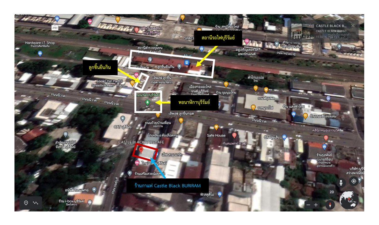
ภาพที่ 4.1 ภาพบอกสถานที่สำคัญของร้าน Castle Black BURIRAM

1. ร้านกาแฟ Castle Black BURIRAM ชุมชนที่ 5 หน้าสถานีรถไฟ