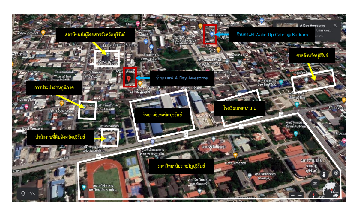
ภาพที่ 4.2 ภาพบอกสถานที่สำคัญของร้าน A Day และ ร้านกาแฟ Wake Up

ที่ตั้งของร้าน A Day Awesome และ ร้านกาแฟ Wake Up Cafe' @ Buriram อยู่บริเวณ ใกล้มหาวิทยาลัยราชภัฏบุรีรัมย์ วิทยาลัยเทคนิคบุรีรัมย์ โรงเรียนเทศบาล 1 สำนักงานที่ดินจังหวัด บุรีรัมย์ การประปาส่วนภูมิภาค สถานีขนส่งผู้โดยสารจังหวัดบุรีรัมย์และศาลจังหวัดบุรีรัมย์ เป็น บริเวณที่ได้ลูกค้าทั้ง นักเรียน นักศึกษา ครู อาจารย์ และประชาชนทั่วไป จึงเป็นเหตุผลที่ร้านกาแฟ หลายร้านเปิดติดกันบริเวณนี้ ชุมชนที่ 8 หลังศาล เป็นชุมชนที่ร้านกาแฟเปิดเยอะที่สุด จำนวน 10 แห่ง จากการลงพื้นที่สำรวจ