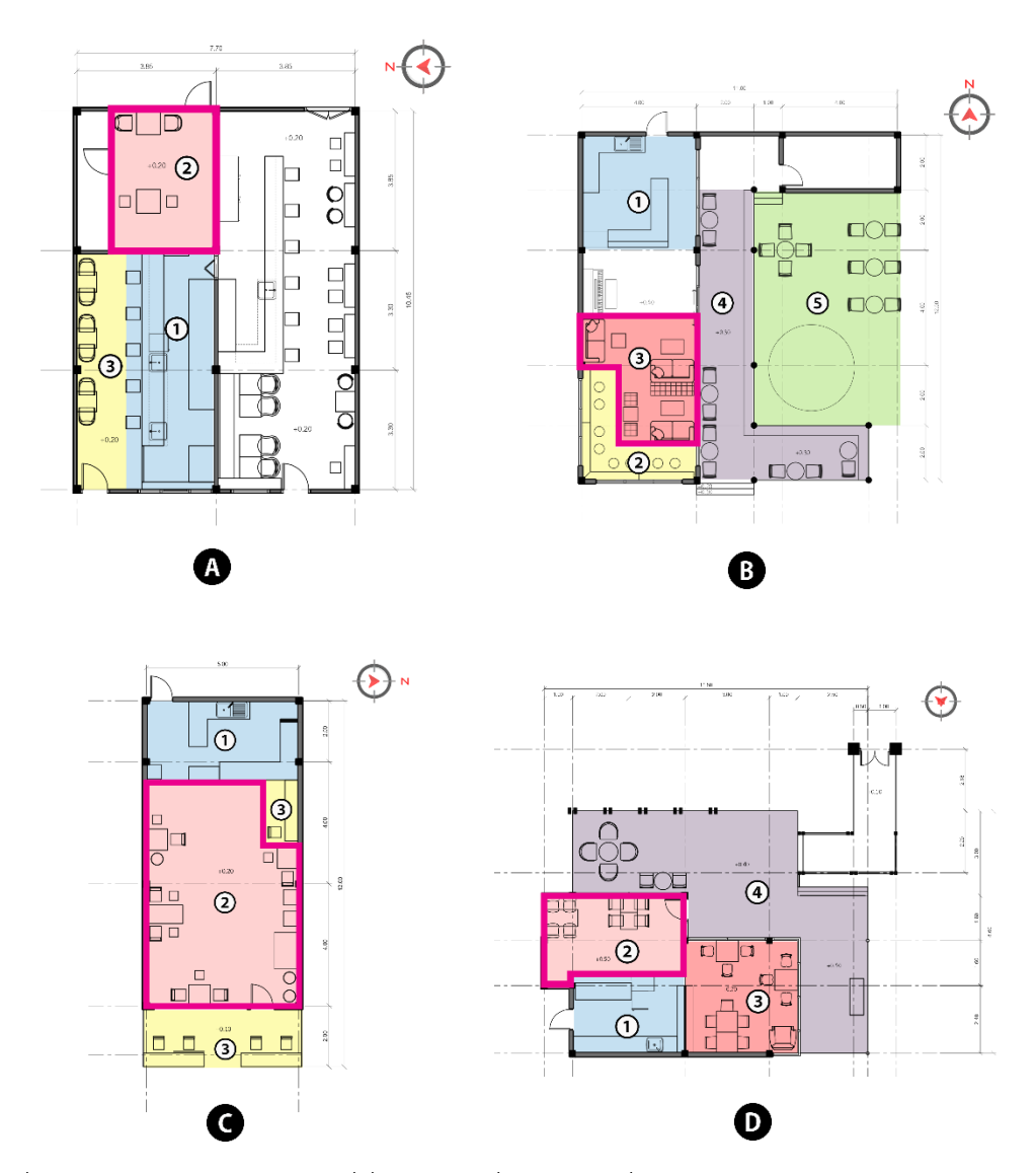
ภาพที่ 4.9 ภาพการวิเคราะห์ โซนที่นั่งหรือโซนที่สามารถเคลื่อนย้ายได้

ร้าน Castle Black BURIRAM ร้าน A Day Awesome ร้าน Wake Up Cafe' @ BURIRAM และ ร้าน Cafe Oasis BURIRAM โต๊ะ เก้าอี้ และโซฟา สามารถเปลี่ยนแปลง เคลื่อนย้าย ตำแหน่งได้ อย่างอิสระ ไม่ตายตัว ทำให้ลูกค้าหรือผู้ที่มาใช้บริการรู้สึกไม่น่าเบื่อ