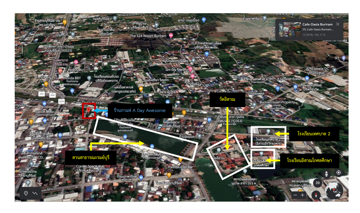
ภาพที่ 4.3 ภาพบอกสถานที่สำคัญของร้าน Cafe Oasis BURIRAM

ที่ตั้งร้าน อยู่ติดกับสวนสาธารณะรมย์บุรี วัดอิสาณ โรงเรียนเทศบาล 2 และ โรงเรียนอิสาณ โกศลศึกษา เป็นบริเวณที่อยู่ใกล้โรงเรียน 2 แห่ง มีทั้งเด็กเล็กและเด็กมัธยม และสวนสาธารณะรมย์ บุรี ที่เป็นสถานที่ที่ผู้คนจะมาวิ่งออกกำลังกายในช่วงเวลาตอนเช้าและตอนเย็น