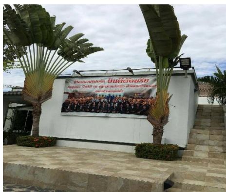
รีสอร์ทบ้านสวนนอก