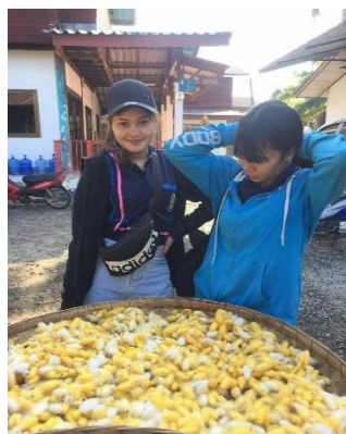
การทำผ้าไหม