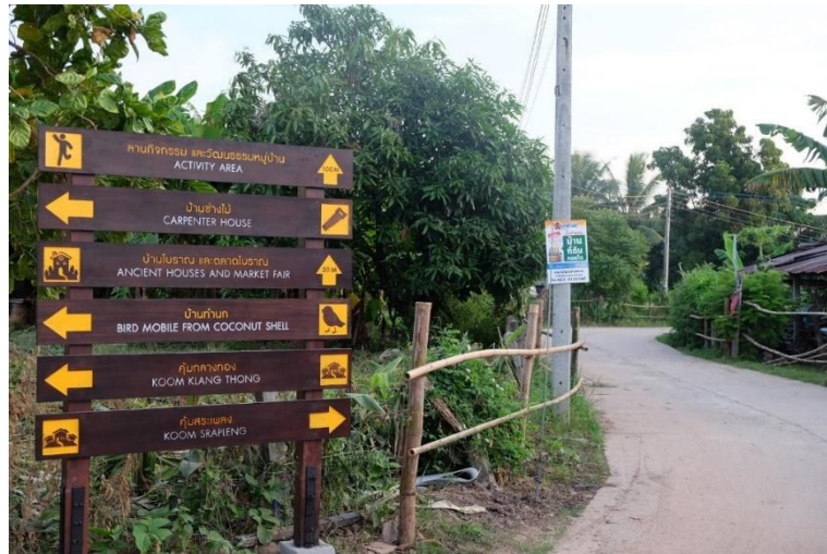
หมู่บ้านสวนนอก