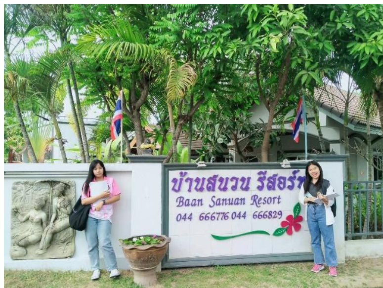
รีสอร์ท บ้านสวนนอก