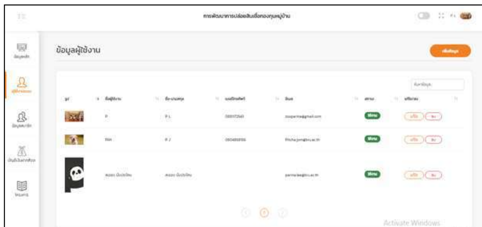
ภาพที่ 1.4 หน้าจอแสดงของผู้ใช้งานระบบ

จากภาพที่ 1.4 หน้าแสดงข้อมูลผู้ใช้งานระบบ สามารถเพิ่มข้อมูลของผู้ใช้งานได้ จะทำการกำหนด Username และ Password ในการ login เข้าสู่ระบบ