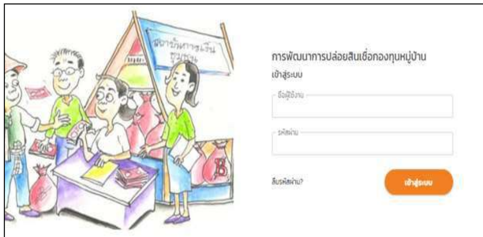
ภาพที่ 1.2 หน้าจอการแสดงผลการเข้าใช้งานของผู้ดูแลระบบ

จากภาพที่ 1.2 หน้า login เพื่อเข้าสู่ระบบเพื่อใช้โปรแกรม โดยหน้า login สามารถเข้าสู่ระบบได้โดย ชื่อผู้ใช้งาน และ รหัสผ่าน ที่ผู้ใช้งานได้กำหนดขึ้น