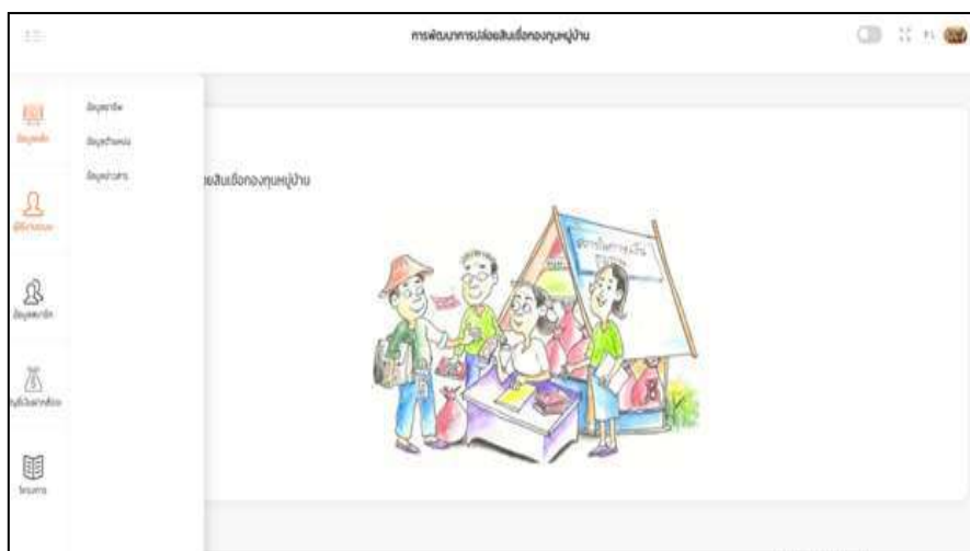
ภาพที่ 1.3 หน้าแสดงข้อมูลหลัก

จากภาพที่ 1.3 หน้าแสดงข้อมูลหลักจะประกอบไปด้วย