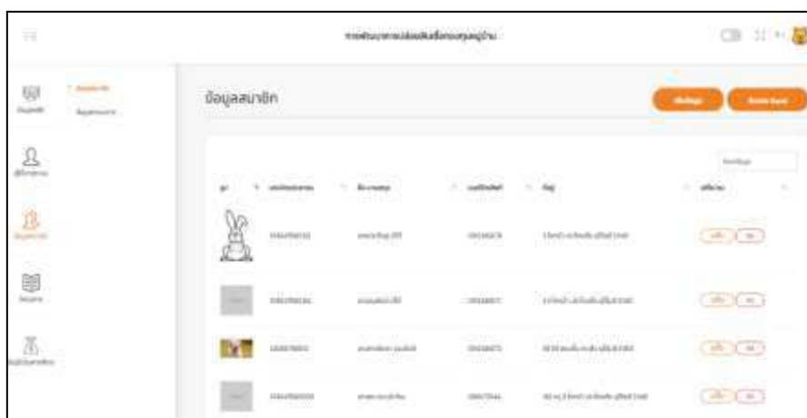
ภาพที่ 1.5 หน้าข้อมูลสมาชิก

จากภาพที่ 1.5 หน้าแสดงข้อมูลสมาชิก ประกอบไปด้วย