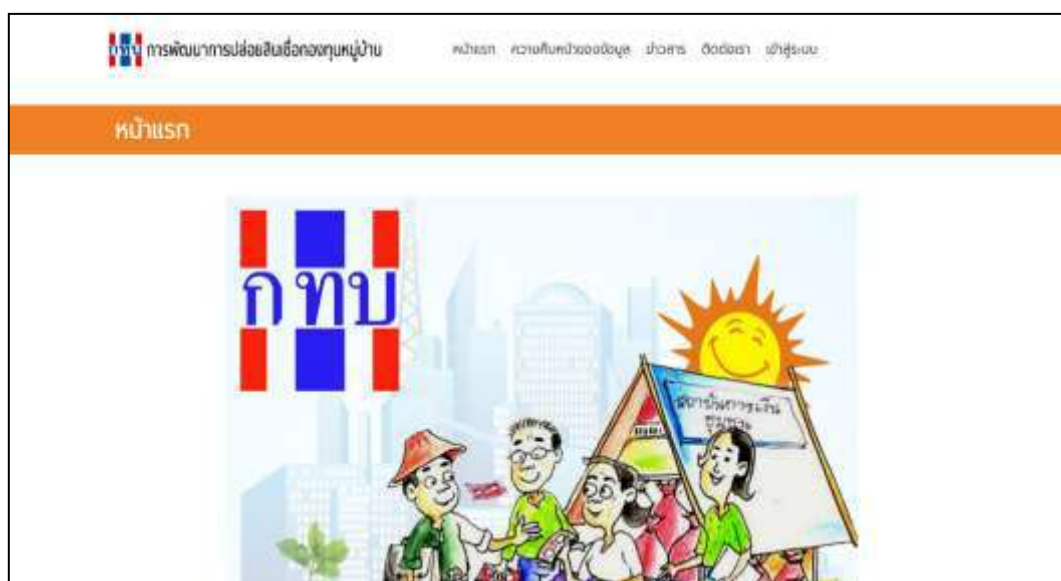
ภาพที่ 1.1 หน้าเว็บไซต์การพัฒนาการปล่อยสินเชื่อกองทุนหมู่บ้าน แลบบอร์ด้านบนจะประกอบไปด้วย