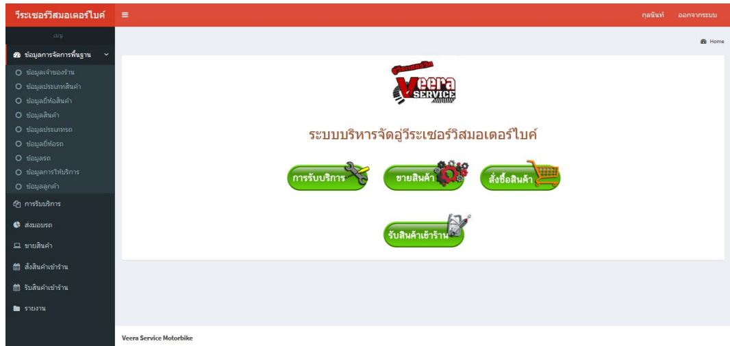
ภาพที่ 4.2 หน้าหลักของผู้ดูแลระบบ

4.1.2 เมื่อล็อกอินเข้าสู่ระบบ จะมีหน้าแรกของผู้ดูแลระบบ ซึ่งเมนูจะแสดง ดังภาพที่ 4.2