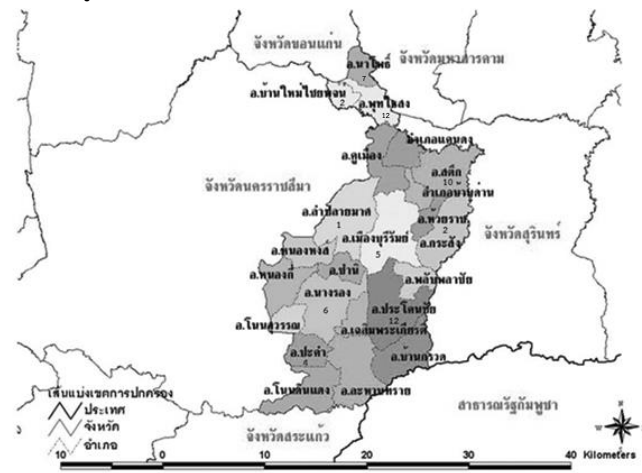
รูปที่ 1 จำนวนผลงานทางวิชาการ (รายการ) จำแนกตามอำเภอในจังหวัดบุรีรัมย์

การศึกษาด้านสถาปัตยกรรมพื้นถิ่นในจังหวัดบุรีรัมย์ ตั้งแต่ปี พ.ศ. 2533-2561 พบว่า เป็นการศึกษาเป็นกรณีศึกษาสามารถระบุจำนวนรายการของผลงานทางวิชาการจำแนกตามที่ตั้งของอาคารที่ศึกษาในแต่ละอำเภอในจังหวัดบุรีรัมย์ ได้แก่ มีการศึกษาสถาปัตยกรรมพื้นถิ่นที่ตั้งอยู่ที่อำเภอนาโพธิ์ 7 รายการ อำเภอบ้านใหม่ไชยพจน์ 2 รายการ อำเภอพุทไธสง 12 รายการ อำเภอสตึก 10 รายการ อำเภอลำปลายมาศ 1 รายการ อำเภอเมือง 5 รายการ อำเภอห้วยราช 2 รายการ อำเภอนางรอง 6 รายการ อำเภอประโคนชัย 12 รายการ และอำเภอปะคำ 4 รายการ ดังรูปที่ 1 ในประเด็นการก่อรูปของสถาปัตยกรรม คิดเป็นร้อยละ 53 การอนุรักษ์ คิดเป็นร้อยละ 28 และเทคโนโลยีอาคาร คิดเป็นร้อยละ 19 ดังรูปที่ 2 แต่การศึกษาดังกล่าวไม่ครอบคลุมพื้นที่ทั้งจังหวัดบุรีรัมย์ และขาดฐานข้อมูลสถาปัตยกรรมพื้นถิ่นในจังหวัดบุรีรัมย์ที่เป็นระบบ สอดคล้องกับการศึกษาของธนิศร์ เสถียรนาม และนพดล ตั้งสกุล [27] ที่ศึกษาสถานภาพผลงานวิชาการการศึกษาเรือนพื้นถิ่นในภาคตะวันออกเฉียงเหนือของประเทศไทย ตั้งแต่ พ.ศ. 2527-2558 ระบุว่ามีการศึกษาในพื้นที่จังหวัดบุรีรัมย์น้อย พบเพียง 2 ผลงาน คิดเป็นร้อยละ 1.3 จากจำนวน 156 ผลงาน ซึ่งเป็นการศึกษาเรือนพื้นถิ่นของกลุ่มชาติพันธุ์ไทลาว/ อีสาน จำนวน 1 ผลงาน ชาวมอญ/เขมร จำนวน 1 ผลงาน และชาติพันธุ์อื่น 2 ผลงาน โดยมีเนื้อหาสาระเกี่ยวกับการอนุรักษ์การก่อรูปเรือนพื้นถิ่น และเป็นประเด็นข้ามศาสตร์วิชา