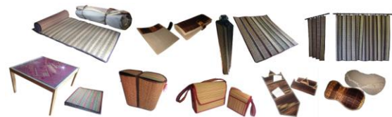
รูปที่ 1 ผลิตภัณฑ์งานทอเสื่อกกทั้งหมด 9 รูปแบบ

ด้านการผลิตมาปรับปรุงพัฒนาสู่การสร้างต้นแบบผลิตภัณฑ์จากทอเสื่อกก เพื่อเข้าสู่กระบวนการประเมินความพึงพอใจของผู้จำหน่ายและผู้บริโภค