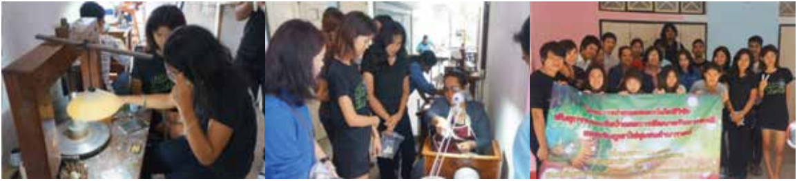
ภาพที่ 4 การถ่ายทอดเทคนิคการออกแบบผลงานเครื่องประดับกับชุมชน