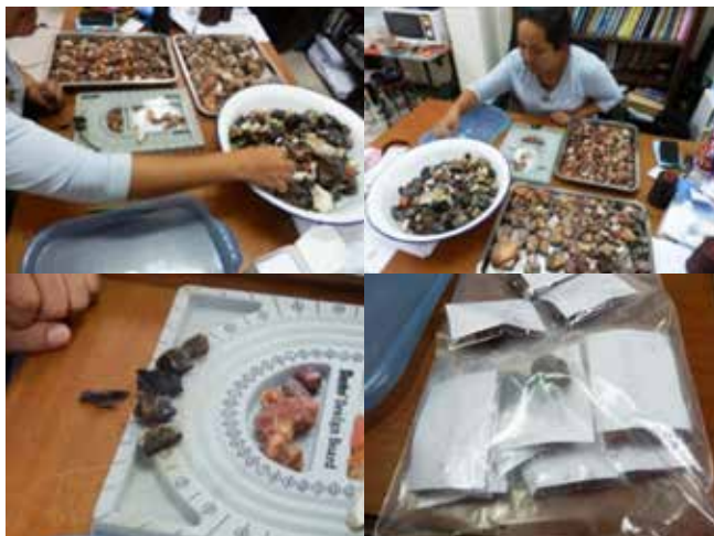
ภาพที่ 2 การคัดเลือกหินเพื่อเข้าตัวเรือน

3. จากนั้นนำข้อมูลที่ได้จากการสอบถามแบบร่างเครื่องประดับและออกแบบตัวเรือน มาปรับปรุงแบบ แล้ว ประเมินกับผู้ทรงคุณวุฒิอีกครั้ง ข้อมูลของการออกแบบเครื่องประดับ ที่ได้มาเป็นพื้นฐานในการปรับปรุง ออกแบบ สร้างสรรค์ เพื่อให้ผลงานมีความสมบูรณ์สวยงามอย่างลงตัว