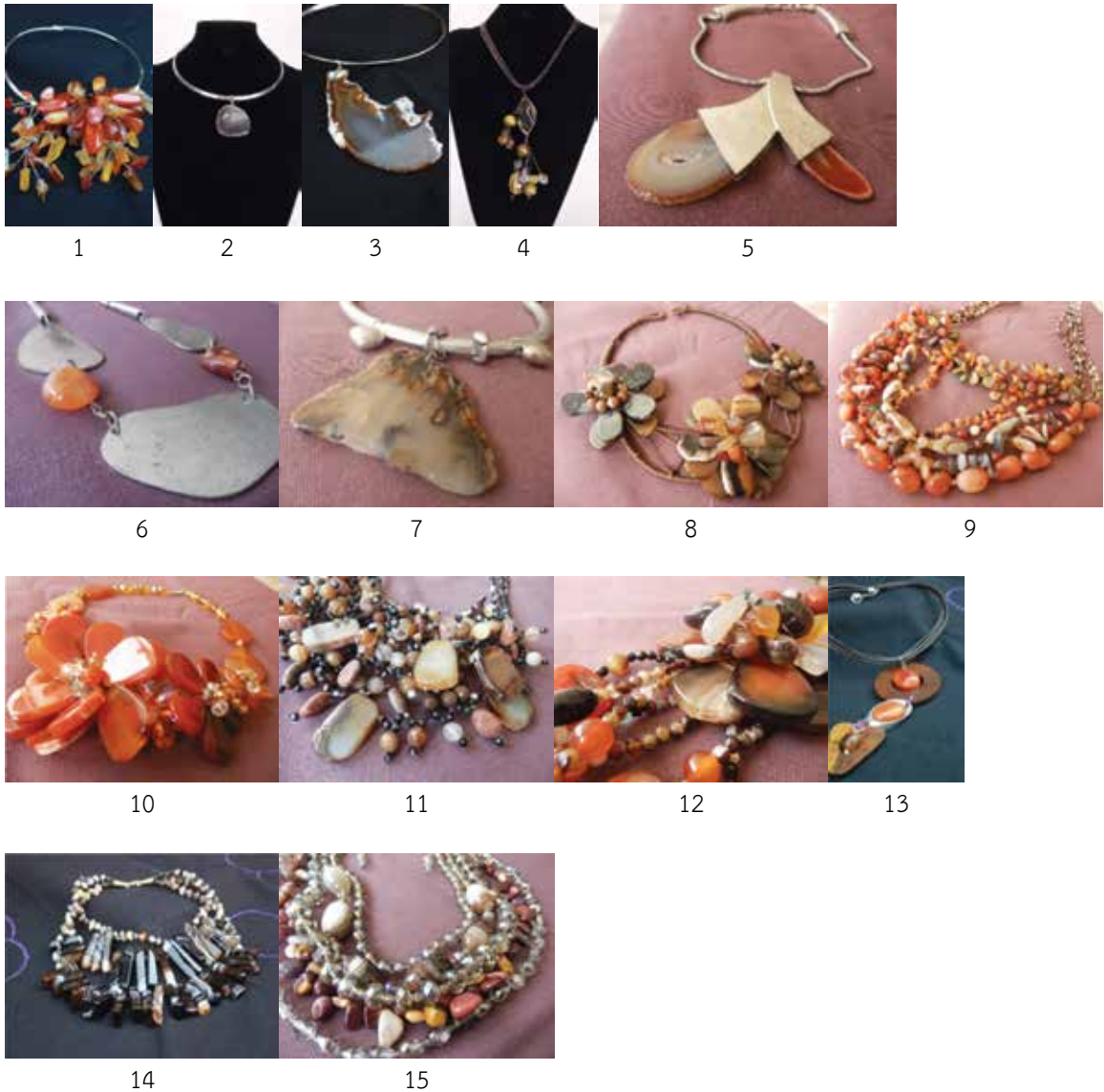
ภาพที่ 3 ผลงานการสร้างสรรค์เครื่องประดับหินอาเกต

เกตเส้นสาย น้ำตาล ดำ ( \bar{X} = 4.45 \pm 0.59 ), รูปแบบที่ 15 ชุดหินอาเกต หรือโมรา ความลงตัวของเส้น สี ( \bar{X} = 4.43 \pm 0.56 ), และรูปแบบที่ 8 ชุดโมรา..ร่วมสมัย เฉดสีส้ม..แฟนตาซี ( \bar{X} = 4.40 \pm 0.60 ) จากการประเมินโดยผู้เชี่ยวชาญพบว่าอยู่ใน