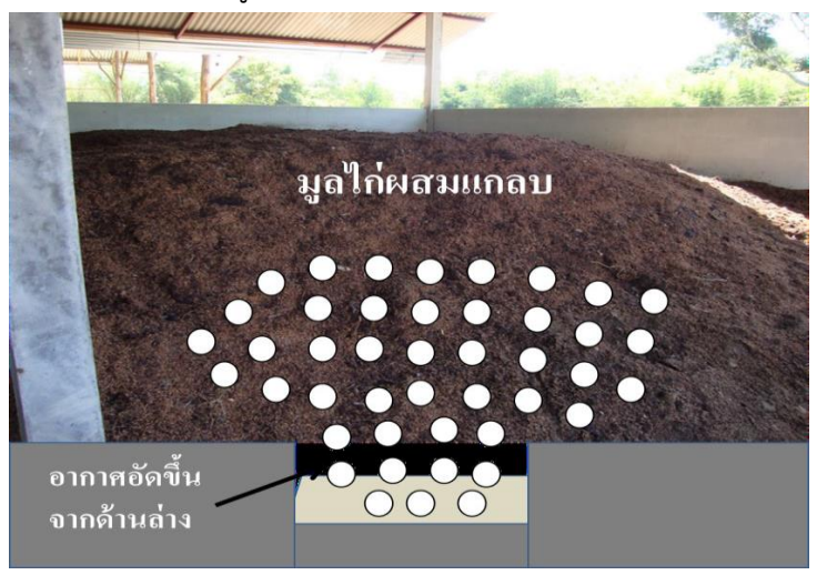
ภาพที่ 4 กระบวนการหมักแบบเติมอากาศ เปิด - ปิดด้วยนาฬิกาอัตโนมัติ วันละ 6 ครั้ง โดยเปิดครั้ง ละ 1 ชั่วโมง รวมทั้งสิ้นวันละ 6 ชั่วโมง และปิดครั้งละ 3 ชั่วโมง รวมทั้งสิ้นวันละ 18 ชั่วโมง

ขั้นตอนที่ 2 บ่มเพื่อให้สารอินทรีย์แปรสภาพเป็นสารอนินทรีย์ เมื่อหมักในระบบเติมอากาศครบ 30 วัน ย้ายมาไว้บนลาน ตาก เพื่อลดความชื้นให้ต่ำกว่า 30 เปอร์เซ็นต์ อีกประมาณ 30 วัน ก็สามารถเริ่ม ใช้ในการผลิตพืชได้ หรืออาจใช้วิธีการทดสอบ ดัชนีการงอกของเมล็ดก่อนน้าไปใช้ ก็จะทำให้มั่นใจมาก ขึ้นว่าจะ ไม่เป็นอันตรายต่อพืชที่เราปลูก