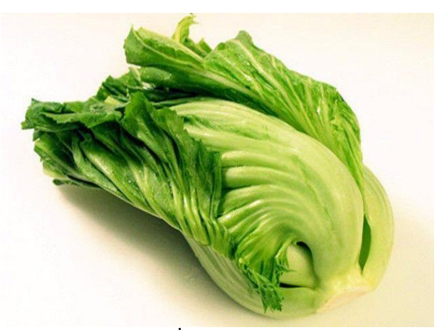
ภาพที่ 1 ผักกาดเขียว

ชื่อวิทยาศาสตร์ Brassica juncea วงศ์ Brassicaceae ชื่อสามัญ Leaf mustard ชื่ออื่น ผักกาดดำ, ผักกาดขาว ,ผักกาดจ้อน, ผักกาดดำ, ผักกาดโป้ง ถิ่นกำเนิด เอเซียใต้ เอเซียกลาง และเอเซียตะวันออก ฤดูกาล ตลอดปี