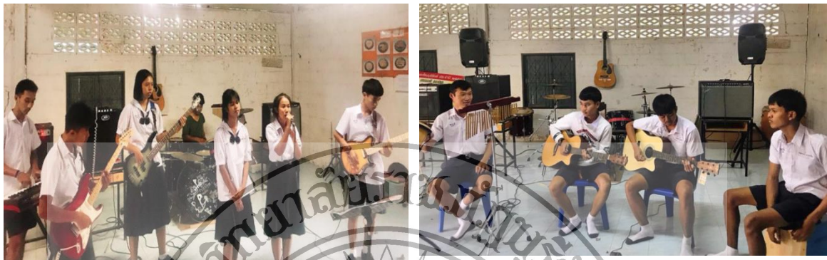
ภาพที่ 2 วงสตริง วงโฟล์คซอง และวงดนตรีไทย