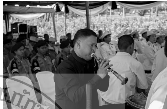
ภาพที่ 3 ความสามารถของครูด้านดนตรี