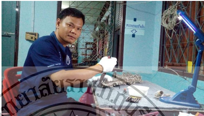
ภาพที่ 4 การดูแล รักษาเครื่องยนต์