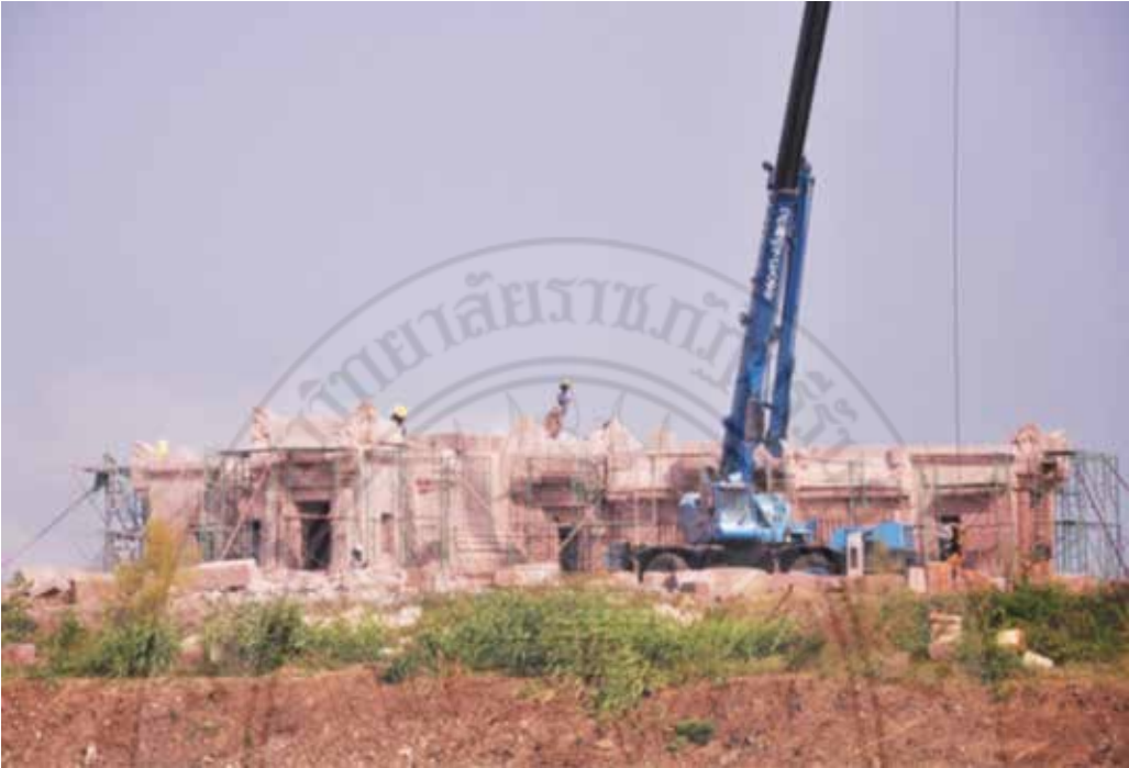
ภาพประกอบ 1 การสร้างปราสาทพนมรุ้งจำลอง บริเวณสนามฟุตบอลทีมบุรีรัมย์ยูไนเต็ด อำนวยการสร้างโดยสรเชต วรคามพิชัย ที่มา : อโศก ไทยจันทร์ารักษ์. ภาพถ่าย. 2557.

3. การอนุรักษ์ตามจุดประสงค์ของการสร้าง ในการสร้างปราสาทเขาพนมรุ้งนั้นมีวัตถุประสงค์ในการก่อสร้างเช่นเดียวกับศาสนสถานในอาณาจักรเขมรโบราณซึ่งรับอิทธิพลทางศิลปะและวัฒนธรรมจากอินเดียนั้น ได้มีการสร้างงานศิลปกรรมทางศาสนาขึ้นอย่างมากมาย ทั้งที่เกี่ยวข้องในศาสนาฮินดูและพระพุทธศาสนา ศิลปกรรมทางศาสนาเหล่านี้มักมีการจำหลักประติมากรรมรูปเทพเจ้า บุคคลสำคัญ หรือภาพเล่าเรื่องที่แสดงให้เห็นถึงคติความเชื่อหรือเรื่องราวของพระผู้เป็นเจ้าของผู้เป็นเจ้าของที่มีกล่าวไว้ในวรรณกรรมทางศาสนาตลอดจนเรื่องราวทางประวัติศาสตร์ โดยเฉพาะที่จำหลักเป็นภาพเล่าเรื่องในงานสถาปัตยกรรมต่างๆ ที่ปรากฏหลักฐานให้เห็นเด่นชัด (กฤษณา พินศรี, 2553 : 105) และเมื่อสร้างศาสนสถานเพื่อตอบสนองความเชื่อแล้ว การก่อสร้างต้องวิจิตรบรรจงที่สุด เพื่อการบูชาและแสดงถึงความศรัทธา การใส่รูปเคารพที่เป็นตัวแทนสูงสุดของการศรัทธาในสถานทีนั้นๆ จะใส่ลงในปราสาทประธานโดยนิยมสร้างไว้บริเวณกลางสุดของการก่อสร้าง ฉะนั้นคติความเชื่อดังกล่าวข้างที่สร้างสรรคการผลิตข้าศิลปกรรมพนมรุ้ง ก็ยังคงแนวคิดนี้ไว้ และไม่ว่าจะสิ่งก่อสร้างใหม่จะมีวัตถุประสงค์ที่ต่างศาสนากันก็ตาม การใช้คติความเชื่อที่พุทธและพราหมณ์ฮินดู ก็มีการผสมผสานกันอย่างลงตัวเช่น การใช้ภาพจำหลักเทพประจำทิศต่างๆ ประดับตามหน้าบันของศาสนสถาน