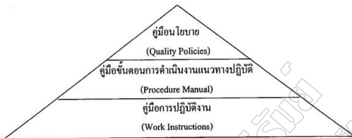
ภาพประกอบ 2 เอกสารที่ควรจะต้องจัดทำเพื่อให้การทำงานเป็นมาตรฐาน

ดังที่ได้กล่าวมาแล้วนั้นงานประกันคุณภาพภายในสถานศึกษาเป็นงานที่ต้องกระทำอยู่แล้วในการบริหารงานประกันคุณภาพภายใน หรือการประกันคุณภาพการศึกษา ผู้บริหารจะต้องกำหนดวิสัยทัศน์ของโรงเรียน เป้าหมาย พันธกิจ การทำงานต้องเป็นระบบ ทำกันเป็นทีม ตั้งแต่การวางแผน การร่วมงาน การร่วมตรวจสอบ การร่วมปรับปรุง การเขียนรายงาน เพื่อเปิดเผยต่อสาธารณชน และหน่วยงานที่เกี่ยวข้องกับการศึกษา ซึ่งรูปแบบการบริหารที่มีส่วนร่วมนี้จะมีด้วยกัน 4 แบบ ซึ่งสอดคล้องกับสัมฤทธิ์ กางเพ็ง (2545 : 9-11) ที่ได้กล่าวไว้ว่าการบริหารแบบมีส่วนร่วมประกอบด้วย ดังนี้