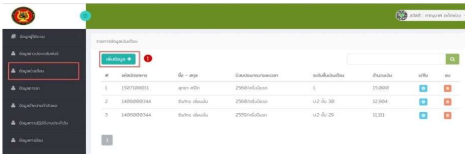
ภาพที่ 3 หน้าจอจัดการข้อมูลเงินเดือนก่าล่งพล