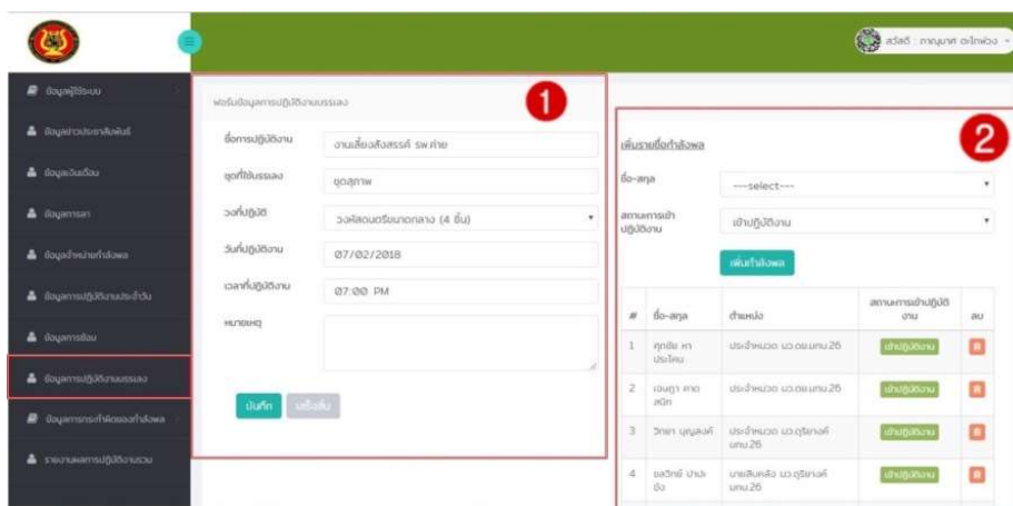
ภาพที่ 4 หน้าจอจัดการข้อมูลปฏิบัติงานบรรเลง