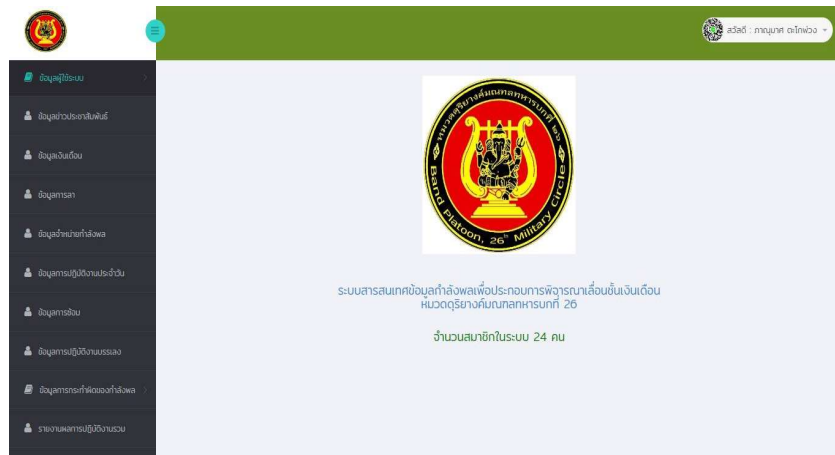
ภาพที่ 1 หน้าจอหลักของระบบสารสนเทศการเลื่อนชั้นเงินเดือนหมวดคุรียางค์มณฑลทหารบกที่ 26

ผู้วิจัยได้ดำเนินการพัฒนาระบบสารสนเทศการเลื่อนชั้นเงินเดือนหมวดคุรียางค์มณฑลทหารบกที่ 26 ตามขั้นตอนการวิจัยโดยนำข้อมูลจากการศึกษา และวิเคราะห์ ซึ่งมีผู้ใช้งาน 3 ส่วน คือ ผู้ดูแลระบบ ผู้บังคับบัญชา และกำลังพล โดยส่วน ของ 1) ผู้ดูแลระบบ สามารถจัดการข้อมูลสมาชิก จัดการข้อมูลเงินเดือน จัดการข้อมูลการปฏิบัติงานประจำวัน จัดการข้อมูลการซ่อมดนตรี จัดการข้อมูลการปฏิบัติงานบรรเลง จัดการข้อมูลกระทำความผิด จัดการข้อมูลจำหน่ายกำลังพล และระบบรายงาน 2) ผู้บังคับบัญชา สามารถจัดการข้อมูลเงินเดือน ระบบรายงาน 3) กำลังพล สามารถจัดการข้อมูลส่วนตัว จัดการข้อมูลการซ่อม เพื่อให้สามารถดำเนินการพิจารณาเลื่อนชั้นเงินเดือนใช้งานได้จริง ซึ่งแสดงตัวอย่างหน้าจอรบบดังภาพที่ 1-5