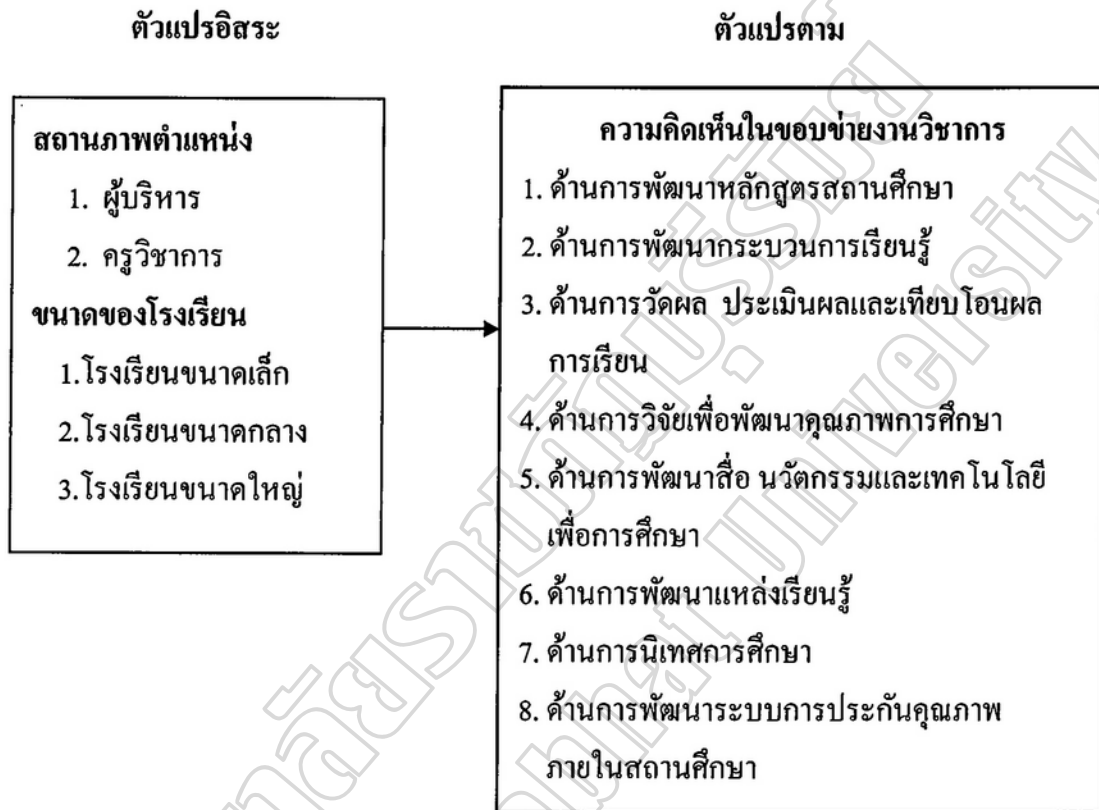
ภาพประกอบ 2.2 กรอบแนวคิดการวิจัย