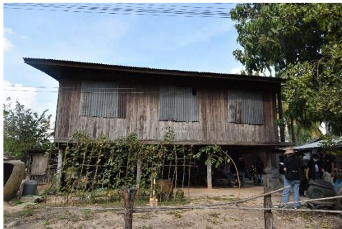
เรือนที่ 5 บ้านเลขที่ 95 หมู่ 12 นางชิง ภาตสตา