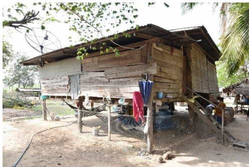
เรือนที่ 3 บ้านเลขที่ 39 หมู่ 12 นางสุคน ภาตสตา