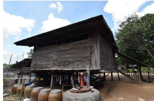
เรือนที่ 2 บ้านเลขที่ 221 หมู่ 12 นางน้อย ดวงศรี