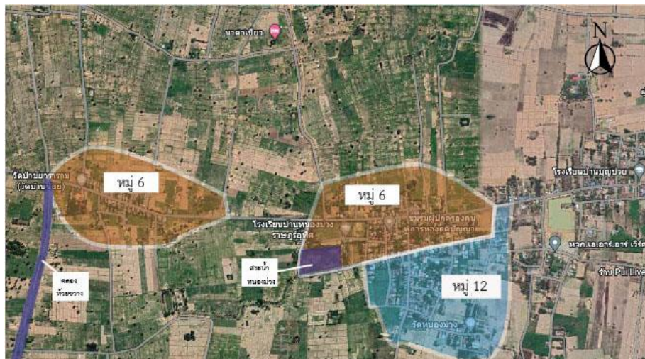
ภาพที่ 3.1 แผนที่บ้านหนองม่วง

พื้นที่ทำการสำรวจลักษณะการเปลี่ยนแปลงของเรือนไทยเขมร รวมถึงเรื่องการจัดผังบริเวณประโยชน์ใช้สอยในผังพื้นที่ใช้สอยใต้ถุนเรือน ผังพื้นที่ใช้สอยบนเรือน โครงสร้างทางสถาปัตยกรรม วัสดุก่อสร้าง รูปแบบทางสถาปัตยกรรมของเรือน และทางด้านของประวัติศาสตร์ชุมชน วิถีชีวิต ความเชื่อและวัฒนธรรม ที่มีผลต่อรูปแบบของเรือน ของชุมชนบ้านหนองม่วง ตำบลบ้านไทร อำเภอบรรพตชน จังหวัดบุรีรัมย์