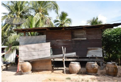
เรือนที่ 4 บ้านเลขที่ 113 หมู่ 12 นายจรูญ บุญเจริญ