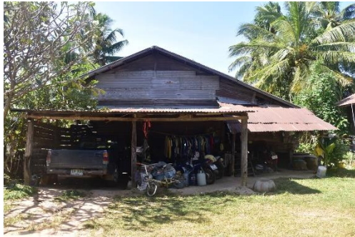
เรือนที่ 1 บ้านเลขที่ 171 หมู่ 6 นายพิชัย พริงเพราะ