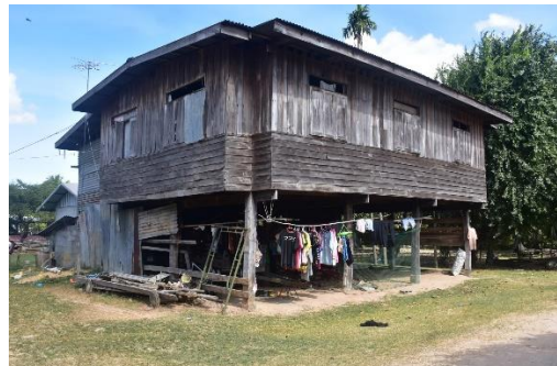
เรือนที่ 6 บ้านเลขที่ 190/2 หมู่ 12 นายสัมฤทธิ์ ชาวสวน