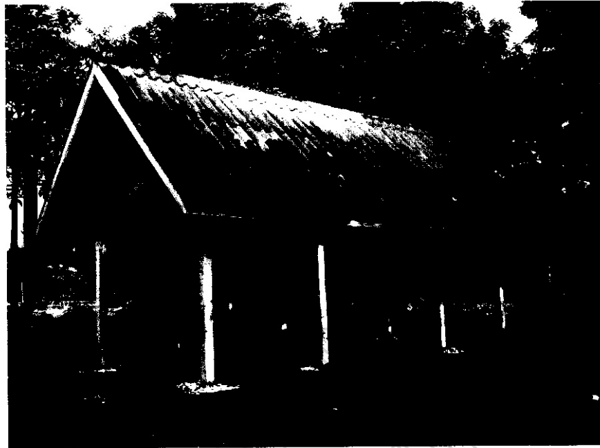
ภาพประกอบ 22 โรงะจู้ในปัจจุบัน