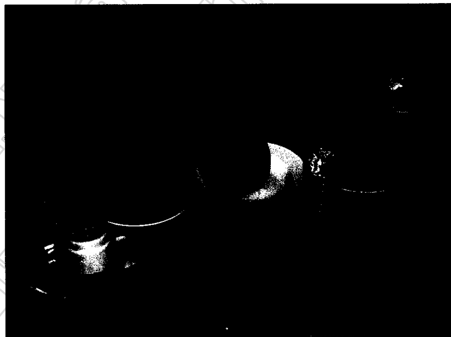
ภาพประกอบ 21 ผลไม้ที่ชาวบ้านนำมาเซ่นไหว้