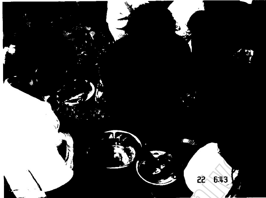
ภาพประกอบ 29 ชาวบ้านกำลังฉีกคางไก่

เมื่อประกอบพิธีแซนยะจูเสร็จสิ้นแล้ว ชาวบ้านจะนำไข่ต้มและไก่ต้มกลับบ้าน เพื่อนำไปให้คนในครอบครัวดู ส่วนเนื้อไก่ หรือไข่ต้มก็จะรับประทานในครอบครัวถือเป็นอาหารที่เป็นสิริมงคล ส่วนข้าวสุกจะเทไว้ที่โรงยะจู เพื่อให้พวกสัมพะเวลี เปรต ผีที่ไม่มีญาติ มารับ ส่วนบุญเหล่านี้ น้ำดื่มที่นำมาก็จะเทรด และสาคน้ำขึ้นบนฟ้า การสาคน้ำมีสาเหตุมาจากความเชื่อเรื่องฝน ชาวบ้านเชื่อว่าการกระทำดังกล่าวจะทำให้ฝนตกมาก มีปริมาณเพียงพอแก่การเพาะปลูก ส่วนขวดน้ำเปล่าก็จะนำกลับบ้าน แต่หากเป็นน้ำหวาน น้ำอัดลม หรือเป็นเหล้า สุรา บางคนก็แบ่งกันดื่มกินที่โรงยะจู บางคนก็จะนำกลับไปให้คนในครอบครัวได้ดื่มกินด้วย