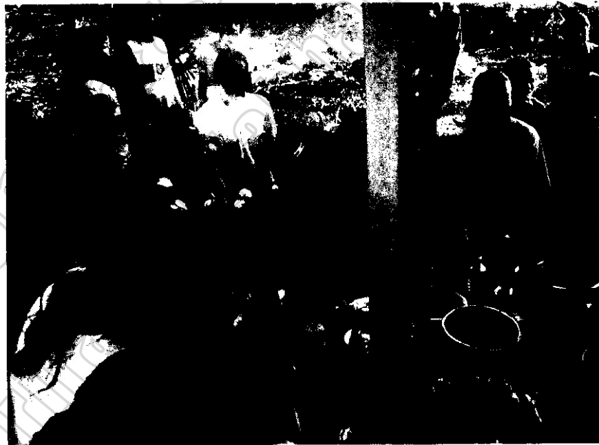
ภาพประกอบ 27 ชาวบ้านยกถึงรูปและดอกไม้อธิษฐาน

เมื่อเวียนครุถึงดอกไม้และแจกรูปครบ 3 รอบแล้ว ชาวบ้านจะได้รับแจกรูปคนละ 1 ดอก ไปปักไว้ที่ตัวไถ่ต้ม และนำรูปที่เหลือพร้อมดอกไม้ในครุถึงก็จะนำไปวางบนหิ้งยะจู้ ต่อจากนั้นเจ้าจ่าจะรินเหล้า แล้วรินน้ำและเรียกยะจู้ครั้งที่ 1 เป็นการเรียกยะจู้จากทุกที่และเชิญให้มารับเครื่องเช่น ไหว้ที่ลูกหลานนำมาเช่น ไหว้