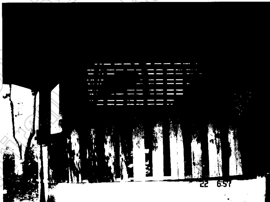
ภาพประกอบ 31 โรงยะจู้จะถูกปิดไว้เมื่อพิธีกรรมเสร็จสิ้น