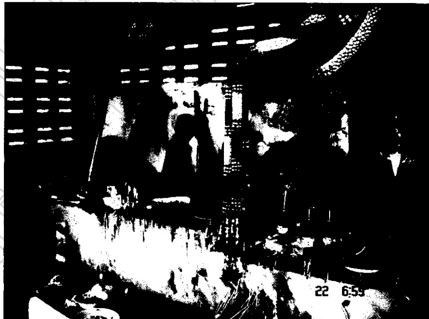
ภาพประกอบ 24 โรงยะจู้ และปุกาญี

โรงยะจู้ เป็นสิ่งก่อสร้างที่ชาวบ้านร่วมกันสร้างขึ้นเพื่อให้เป็นที่อยู่ของยะจู้ โรงยะจู้ หลังเก่าสร้างด้วยไม้อย่างง่าย ๆ ใช้เสา 4 ต้น มีห้องเดียวโล่ง ๆ เมื่อตัวศาลเก่าผุพัง ชาวบ้านจึง เรี่ยไรเงินกัน สร้างขึ้นใหม่ในบริเวณเดิมคือตรงบริเวณริมหนองน้ำปุกาญี บริเวณนี้จะมีต้นไม้ใหญ่ คือต้นจามจุรี และมีต้นไม้หลายชนิดขึ้นอยู่รอบ ๆ โรงยะจู้หลังใหม่นี้สร้างด้วยอิฐบล็อกปูนอย่าง แข็งแรง มีเสา 8 ต้น ทำด้วย คอนกรีต ตัวศาลสร้างเป็นห้องโถง โถง ไม้ตีฝาเพดาน และมี แท่นหิ้ง 2 ชั้น โดยก่อด้วยอิฐบล็อกสูง 2 ก้อน เพปูนซีเมนต์แข็งแรง ชั้นแรกใช้สำหรับวางเครื่อง เช่นไห้ว ประกอบด้วย รูปไม้ที่แกะสลักเป็นรูปสัญลักษณ์แทน ปู่ คือ จู้ และ ยาย คือ ยะ นอกจากนี้ ยังมีรูปแกะสลักอื่น ๆ ที่ถวายให้เป็นข้าทาสบริวาร เช่น ช้าง และม้า ชั้นที่สองที่ต่าง มาจะเป็นชั้นที่มีบริเวณกว้างขวางพอที่เฒ่าจ้ำสามารถเข้าไปนั่งทำพิธีกรรมข้างในได้ ด้านข้าง ๆ ยะจู้จะมีศาลหลังเล็ก ๆ ซึ่ง ชาวบ้านม่วงหวาน-โคกเจริญ เรียกว่า ปุกาญี ซึ่งเป็นสิ่งที่ชาวบ้าน เคารพนับถือมาพร้อม ๆ กับ ยะจู้ ทุกครั้งที่มีการพิธีกรรมเช่นไห้วยะจู้ ก็จะเช่นไห้ว ปุกาญีด้วย แต่ ชาวบ้านจะถือว่าปุกาญีเป็นนักบวช ถือศีล กินเจ ดังนั้นในการเช่นไห้วจะใช้น้ำดื่ม ผลไม้ และ ขนมหวานเท่านั้น จะไม่นำอาหารคาวเช่น ไก่ต้ม อาหารที่ประกอบด้วยเนื้อสัตว์อื่น ๆ ในการเช่น ไห้ว และจะไม่นำสุรา ยาสูบถวายเป็นอันขาด หลังคาของศาลยะจู้เป็นทรงจั่วสูง มุงด้วยกระเบื้อง มีประตูไม้ไว้ปิดเมื่อเสร็จสิ้นพิธีกรรม