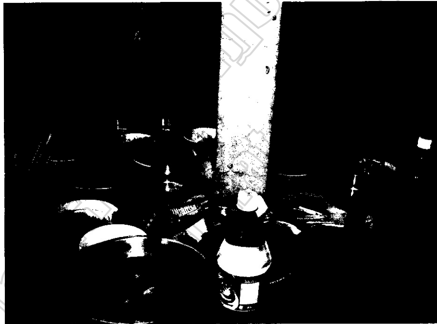
ภาพประกอบ 26 ชาวบ้านนำของที่เตรียมมาเช่นไห้วางรวมกัน

จากการสังเกตการเข้าร่วมพิธีกรรมแซนยะจู พบว่า เมื่อชาวบ้านมาถึงบริเวณยะจูแล้วจะนำของที่เตรียมมาวางเป็นวง ขนาดของวงที่ล้อมกันจะไม่จำกัดขนาด ถ้าวางไหนยังมีจำนวนน้อยอยู่คนที่มาทีหลังก็จะนำของไปวางในวงนั้น ต่อจากนั้นก็ให้นำกรวยดอกไม้และธูปไปใส่รวมกันในครุถึง น้ำดื่มบางคนก็จะเทใส่ขันน้ำ บางคนก็จะใส่ไว้ในขวดและเปิดฝาขวด น้ำหวาน น้ำอัดลมก็จะเปิดฝาไว้เช่นเดียวกัน ผลไม้หรือขนมหวานที่นำมาจะนำไปวางไว้บนชั้นยะจู และวางถวายตรงปูถายี พวกอาหารคาวจะไม่ถวายปูถายี โดยจัดเป็นลำดับขั้นตอนดังนี้