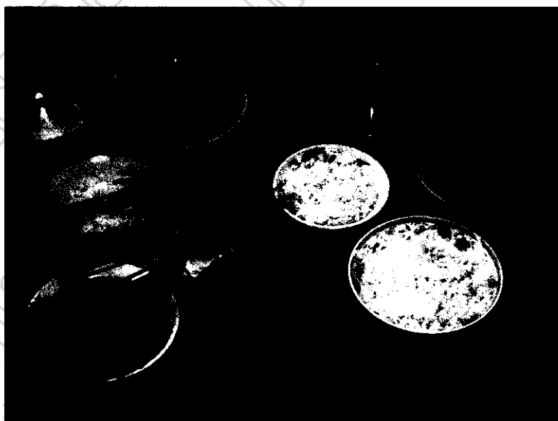
ภาพประกอบ 19 ภาพอาหาร มีข้าวสุก และไก่ต้มที่นำมาเช่นไหว้ชะงู

2.2.5 ผลไม้ หมายถึง ผลไม้ที่นำมาเป็นเครื่องสังเวย ผลไม้จะเป็นอะไรก็ได้ไม่จำกัดชนิด ตามแต่ชาวบ้านจะหามาได้ เช่น ส้มเขียวหวาน มังคุด แดงโม กล้วย มะพร้าว และเงาะ เป็นต้น