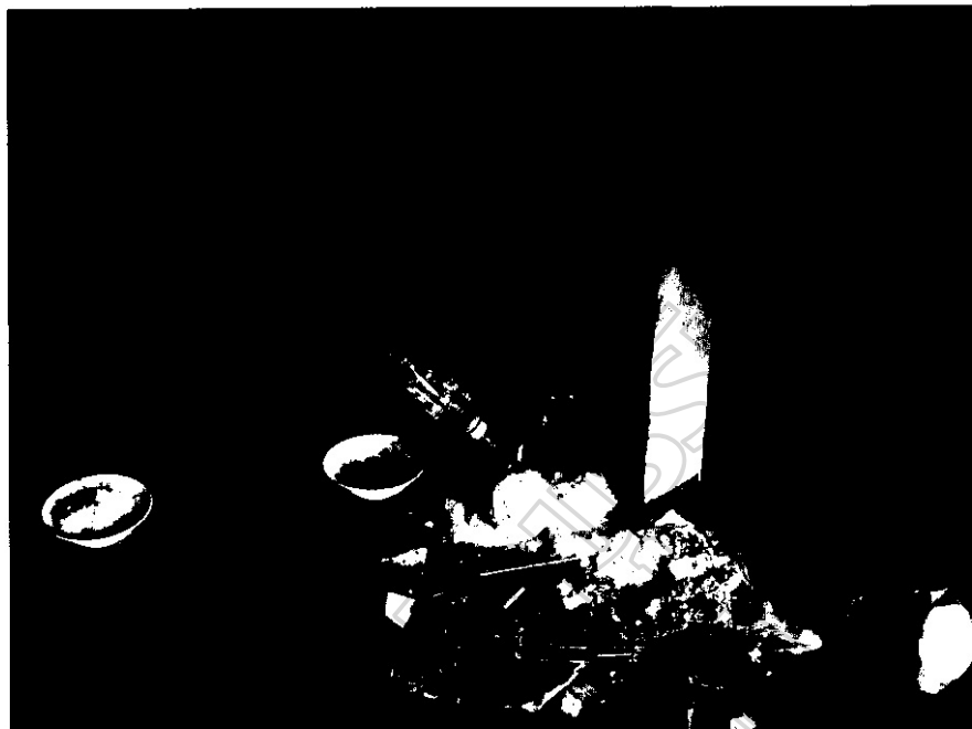
ภาพประกอบ 30 ชาวบ้านเขี้ยวและน้ำทิ้งไว้ที่โรงยะจู้