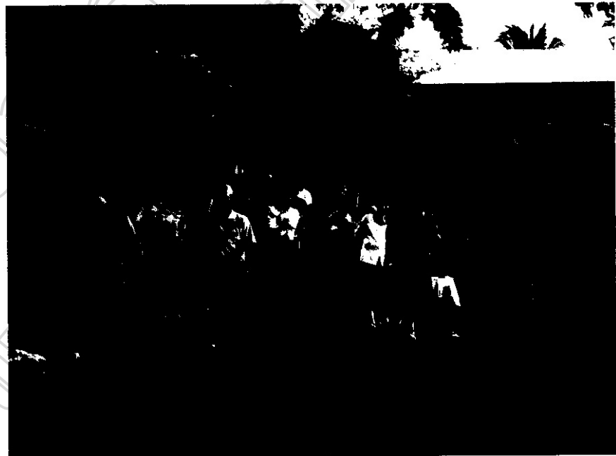
ภาพประกอบ 25 ชาวบ้านกำลังเดินทางเข้าร่วมพิธีกรรมแซนยะจู้

เจ้าครูของวันประกอบกรรมพิธีแซนยะจู้ เฒ่าจ้ำและชาวบ้านจะมาพร้อมกันที่ยะจู้ สิ่งที่ต้องนำมาด้วยคือ ขันห้า (กรวยดอกไม้ และรูป) จำนวน 5 กรวย เทียนไข 1 แท่ง น้ำดื่ม น้ำหวาน น้ำอ้อยคั้น หรือเหล้า 1 ขวด ข้าวสุก 1 ถ้วย ใก่คั้ม ใช้ถวายเพื่อเป็นอาหาร