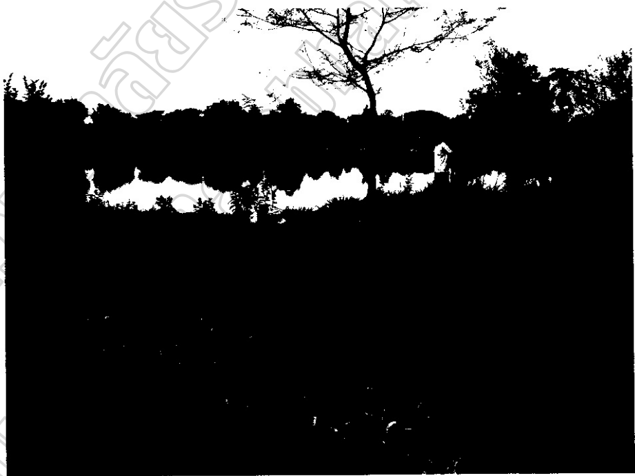
ภาพประกอบ 23 ริมหนองน้ำฤๅษีเป็นที่ตั้งยะจี้ และเป็นแหล่งสาธารณประโยชน์

สถานที่ตั้งโรงยะจี้ นั้น จากการสอบถามคนเฒ่าคนแก่และเฒ่าจ้ำ ได้คำตอบเหมือนกันว่า ไม่ทราบเหตุผลในการตั้งโรงยะจี้ อย่างแท้จริง ทราบแต่ว่าต้องใกล้แหล่งน้ำเพื่อความอุดมสมบูรณ์ของชุมชน และเชื่อว่านายจำป่า สายบุตร นายแพง แจ่มใส ซึ่งได้รับแต่งตั้งให้เป็นหัวหน้าฝ่ายพิธีกรรมแซนยะจี้เมื่อครั้งที่ย้ายถิ่นฐานจากบ้านเนินยาง มาอยู่ที่บ้านโคกมะม่วงหวานแห่งนี้ ในปีพ.ศ. 2494 เป็นผู้ก่อตั้งขึ้น