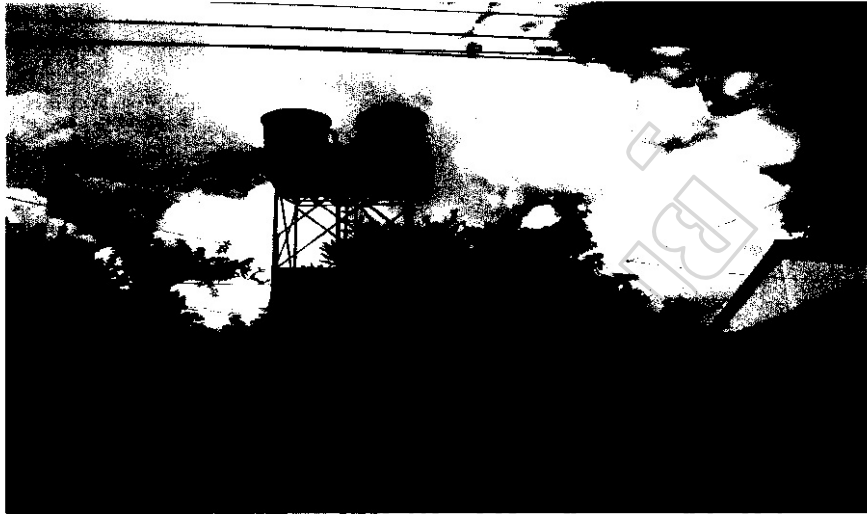
ภาพประกอบ 8 งบประมาณคาลประจำหมู่บ้าน