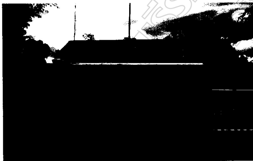
ภาพประกอบ 7 สถานีอนามัยบ้านโลกเจริญ

ให้การสนับสนุนให้ลูกหลานได้เล่าเรียน เมื่อโรงเรียนมีงานต่าง ๆ ชุมชนบ้านม่วงหวาน – โลกเจริญ จะช่วยเหลืออย่างเต็มที่ และจะช่วยจนกระทั่งงานเสร็จสิ้น ผมเป็นคนบ้านแพงพวย แต่ผมและภรรยาประสงค์ที่จะมาสอนที่ชุมชนแห่งนี้เพราะชาวบ้านน่ารักและให้ความร่วมมือกับสถานศึกษาแห่งนี้เป็นอย่างดี ”