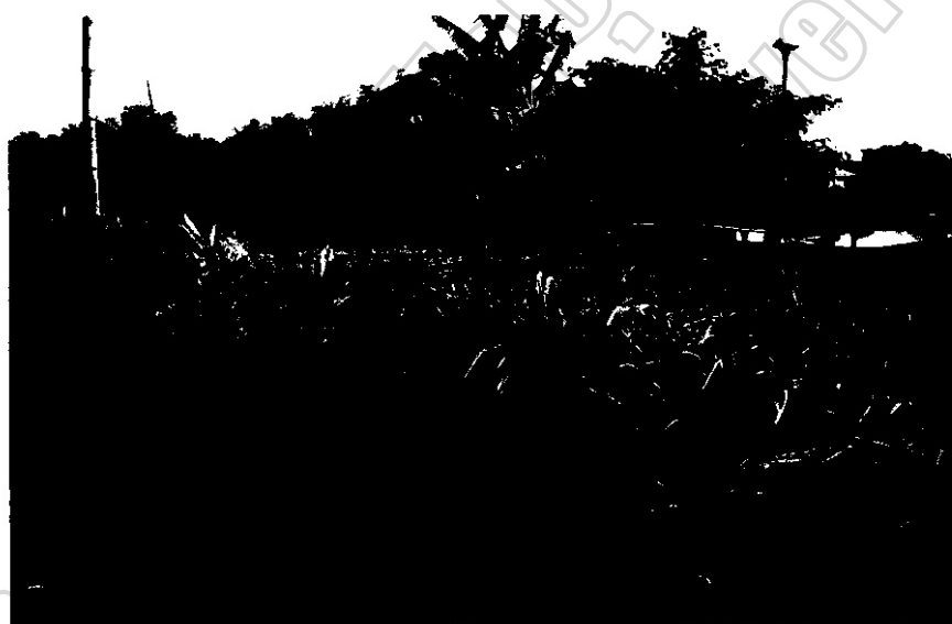
ภาพประกอบ 4 การปลูกผักริมหนองน้ำบุญญีของชาวบ้านม่วงหวาน-โลกเจริญ

หลังการเก็บเกี่ยวข้าวเสร็จแล้วชาวบ้านม่วงหวาน – โลกเจริญ จะไม่ยอมอยู่นิ่งเฉย แต่จะปลูกพืชผักชนิดอื่นในที่นา เช่น มันเทศ แตงโม ถั่วลิสง งาม เป็นต้น ส่วนที่ดินว่างข้างบ้านหรือข้างแปลงนา ก็จะใช้เพาะปลูกพืชผักชนิดต่างๆ เช่น มะเขือเปราะ มะเขือเทศ ต้นหอม ผักชี ผักบุ้ง ผักกาด กระน้ำ แตงกวา และหากครอบครัวใดมีความขยันมาก ต้องการพื้นที่เพาะปลูกผักเพิ่มเติม ก็สามารถใช้ที่ดินสาธารณะข้างสระเก็บน้ำของชุมชนได้อีก ซึ่งผลผลิตที่ได้เป็นทั้งอาหารของครอบครัวและเป็นแหล่งสร้างรายได้ช่องทางหนึ่ง