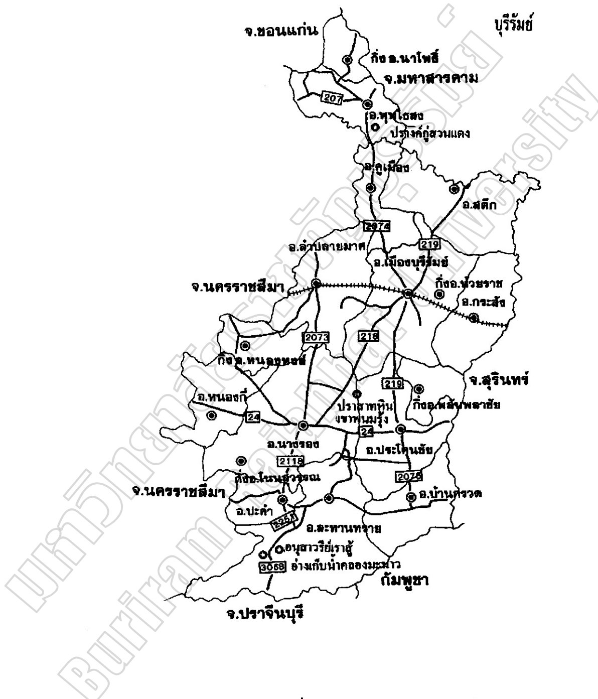
ภาพประกอบ 2 แผนที่แสดงเขตติดต่อจังหวัดบุรีรัมย์