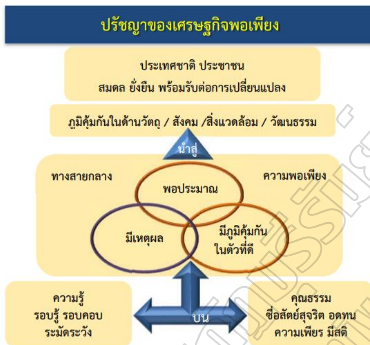
ภาพประกอบ 2.1 สรุปปรัชญาของเศรษฐกิจพอเพียง