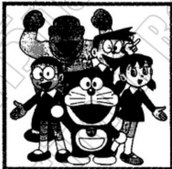
๓. การ์ตูน