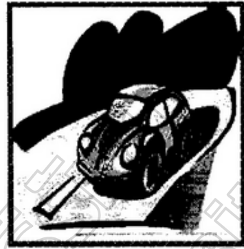
๖. .... รอยนตึ