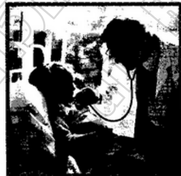
๙. .... นวยเพนย