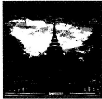
๗. .... เจดึย