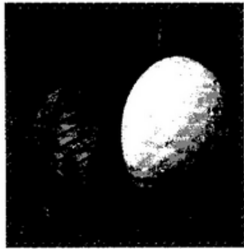
๕. .... กอหลึฟ