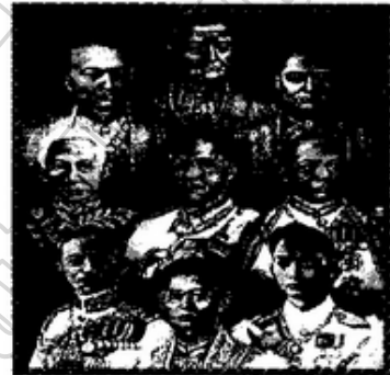
๒. กษัตริย์