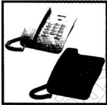
๑. โทรศัพท์

เฉลยเฉลย เฉลยเฉลยมีตัวกลมแต่จากภาพเป็นอักษรไทย