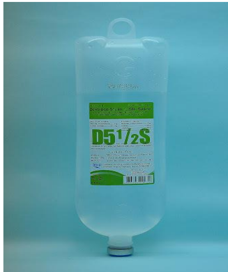
รูปที่ 1 น้ำเกลือปราศจากเชื้อ ชนิด Blow Fill Seal บรรจุขวดพลาสติก