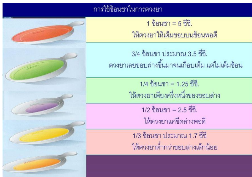
รูปที่ 4 การตวงยาสำหรับเด็ก