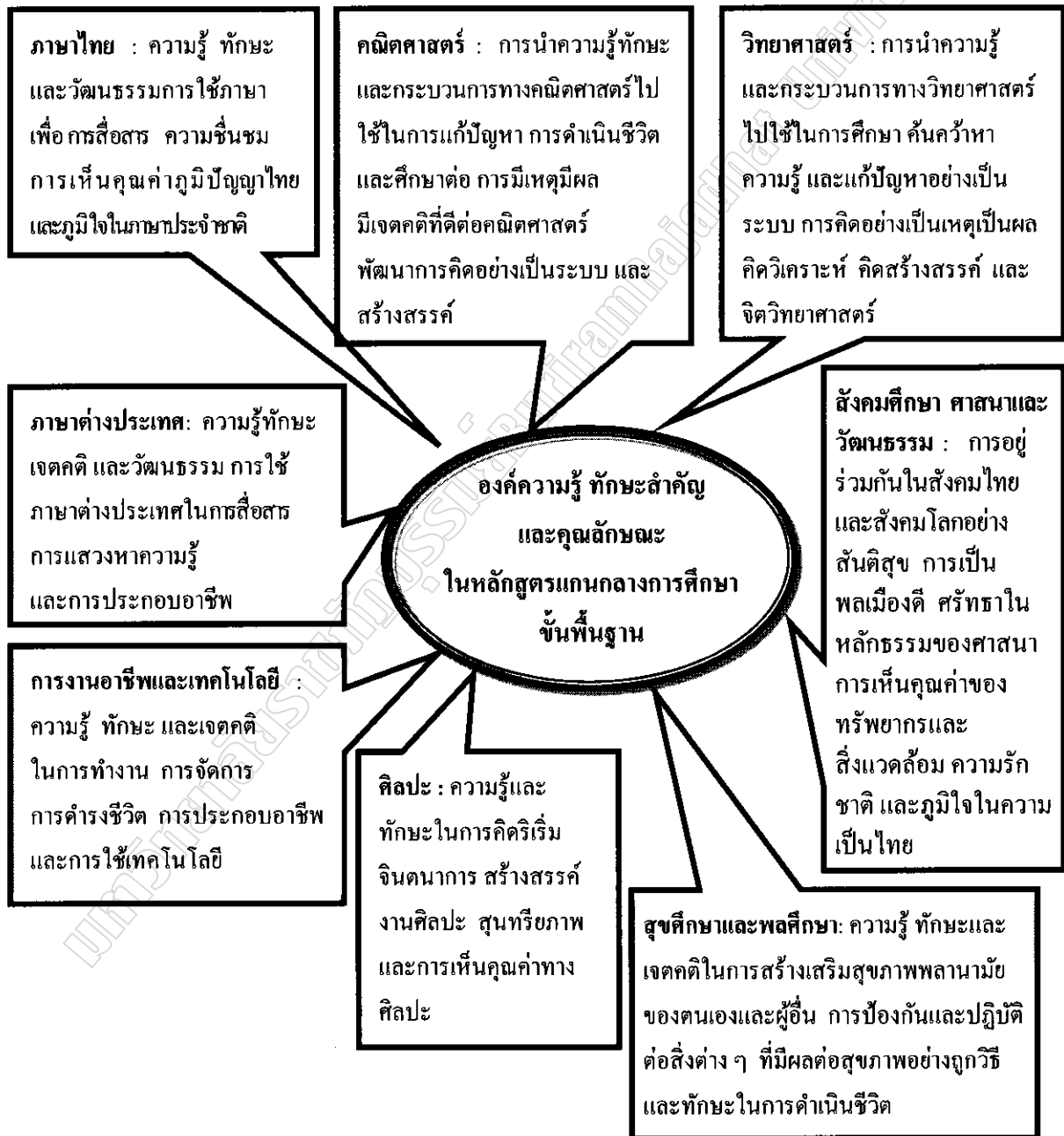
ภาพประกอบ 2.1 องค์ความรู้ ทักษะสำคัญและคุณลักษณะในหลักสูตรแกนกลางการศึกษาขั้นพื้นฐาน

สาระการเรียนรู้ ประกอบด้วย องค์ความรู้ ทักษะหรือกระบวนการเรียนรู้ และคุณลักษณะ อันพึงประสงค์ ซึ่งกำหนดให้ผู้เรียนทุกคนในระดับการศึกษาขั้นพื้นฐานจำเป็นต้องเรียนรู้ โดยแบ่งเป็น 8 กลุ่มสาระการเรียนรู้ ดังนี้ (กระทรวงศึกษาธิการ. 2551 ค : 10-11)