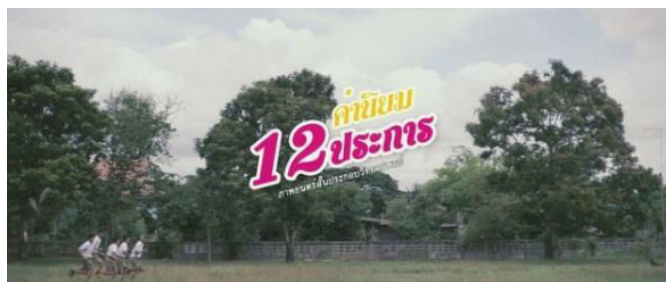
ภาพที่ 3 ภาพยนตร์สั้น ค่านิยม 12 ประการ

หลังจากได้ทำการเก็บข้อมูลจากผู้เชี่ยวชาญกลุ่มผู้เชี่ยวชาญได้ให้ข้อเสนอแนะในการปรับปรุงและพัฒนาสื่อภาพยนตร์สั้นต้นแบบให้เป็นชิ้นงานที่สมบูรณ์ ดังภาพ