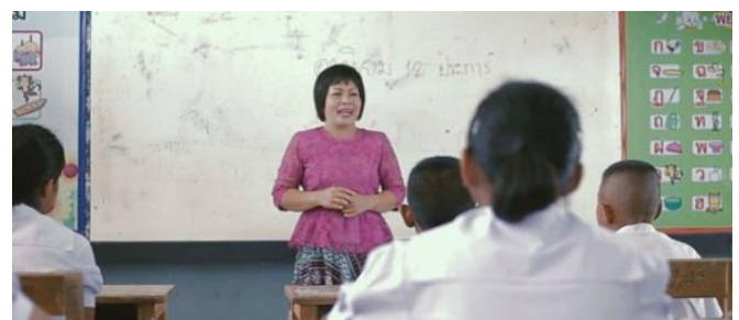
ภาพที่ 3 ภาพยนตร์สั้น ค่านิยม 12 ประการ (ต่อ)