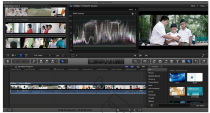
ภาพที่ 2 ขั้นตอนการลำดับภาพ (Editing)

2.3 ขั้นพัฒนา (Develop) จัดเตรียมทรัพยากรที่ใช้ในการพัฒนาภาพยนตร์สั้น และดำเนินการผลิตภาพยนตร์สั้น