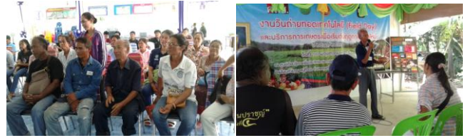
รูปที่ 1 การศึกษาดูงานชุมชนอื่นที่มีบริบททางสังคมที่ใกล้เคียงกัน

2) กระบวนการเรียนรู้ชุมชน พบว่า ชุมชนบ้านหนองขวาง ตำบลพรสำราญ อำเภอคูเมือง จังหวัดบุรีรัมย์ มีกระบวนการเรียนรู้ชุมชน แยกได้ 4 ระดับ ได้แก่ ระดับบุคคล เป็นกระบวนการเรียนรู้ที่เกิดจากความสนใจของบุคคลและผ่านการฝึกฝนจนมีความเชี่ยวชาญเฉพาะบุคคล ระดับครอบครัว เป็นกระบวนการเรียนรู้ที่สืบทอดองค์ความรู้จากบุคคลในครอบครัว หรือตระกูลจนเป็นที่ยอมรับของคนในชุมชนว่าตระกูลนั้นเด่นในเรื่องใดหรือมีความสามารถด้านภูมิปัญญาท้องถิ่นใด เช่น ครอบครัวพ่อภ่า ทำมิด มีความสามารถด้านการจักสาน ระดับชุมชน เป็นกระบวนการเรียนรู้ตามวิถีวัฒนธรรมของชุมชนสื่อออกมาในลักษณะของงานบุญประเพณี ความเชื่อ และวิถีปฏิบัติของคนชุมชนหนองขวาง เช่น บุญผะเหวด กลืน การไหว้ปู่ตา เป็นต้น ส่วนในสมัยปัจจุบันมีการเรียนรู้ผ่านเครือข่าย เป็นการเรียนรู้ของชุมชนผ่านกิจกรรมโครงการของเครือข่ายหน่วยงานทางสังคมของชุมชน เช่น โครงการขององค์การบริหารส่วนตำบลพรสำราญ มหาวิทยาลัย โรงพยาบาลส่งเสริมสุขภาพตำบล พัฒนาชุมชน เกษตรอำเภอ เป็นต้น ทำให้ชาวบ้านได้รับความรู้ใหม่ๆ เข้าสู่ชุมชน