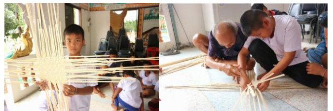
รูปที่ 1 พ่อภ่า ผู้สูงอายุสามารถเป็นวิทยากรสอนเยาวชนด้านภูมิปัญญาจักสานให้เยาวชนในชุมชน