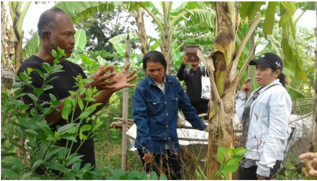
รูปที่ 2 พัฒนาคู่มือความรู้ครอบครัวให้เป็นฐานเรียนรู้ชุมชน

นอกจากนี้ได้รวมกลุ่มด้านอาชีพภายใต้ชื่อ “กลุ่มอาชีพผู้สูงวัยชุมชนบ้านหนองขวาง” ร่วมกันออกแบบโลโก้และแต่งตั้งคณะทำงาน เพื่อพัฒนาต่อยอดงานวิจัยไปสู่การพัฒนาคุณภาพชีวิตต่อไป ด้วยการประสานกับพัฒนาชุมชนตำบลพรสำราญ และพัฒนาชุมชนอำเภอคูเมือง กระบวนการกลุ่มจะทำให้ชุมชนเกิดการเรียนรู้ร่วมกัน เมื่อใดมีการเรียนรู้ในชุมชนจะกลายเป็นพลังชุมชนที่จะนำไปสู่ความเข้มแข็งส่งผลต่อคุณภาพชีวิตที่ดีขึ้นของผู้สูงอายุ ข้อค้นพบการวิจัยสรุปกระบวนการเรียนรู้ของชุมชนเพื่อพัฒนาคุณภาพชีวิตของชุมชนบ้านหนองขวางได้