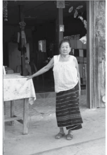
ภาพที่ 2 การนุ่งผ้าขึ้นในชีวิตประจำวันของผู้หญิงชาวแม่แจ่ม ผู้หญิง (แม่อ้อย) ชาวบ้านท้องผายमारอใส่บาตรยามเช้า

ส่วนในวิถีชีวิตประจำวัน ผู้หญิงแม่แจ่มจะนุ่งขึ้นของชาวลัวะ ขึ้นของชาวปกากะญอ และขึ้นลาย ก่าน ในช่วงปี พ.ศ. 2506 วัฒนธรรมผ้าขึ้นตีนจกแม่แจ่ม ถูกแรงกระทบจากภายนอกอย่างหนัก ประกอบกับ มีการสร้างถนนเข้าสู่แม่แจ่ม จึงส่งผลให้มีคนภายนอกเข้ามาตั้งร้านค้าในอำเภอแม่แจ่ม สินค้าบริโภคอุปโภค โดยเฉพาะเสื้อผ้ามีรูปแบบใหม่ให้เลือกอย่างมากมาย มีความสะดวกกว่าการทอเอง ช่างทอในยุคหน้านิยมไป ทำไร่กันมากขึ้น ส่งผลให้ช่างทอผ้าขึ้นตีนจกเกือบทุกหมู่บ้านหยุดการทอผ้า มีช่างทอรุ่นแม่อ้อยเหลืออยู่บ้าง แต่ทอผ้าไว้ใช้เมื่อยามจำเป็นเท่านั้น ส่วนช่างทอรุ่นใหม่ไม่มีเลย จนในปี พ.ศ. 2517 สมเด็จพระนางเจ้าฯ พระบรมราชินีนาถ โดยเสด็จพระบาทสมเด็จพระเจ้าอยู่หัวฯ ไปทรงเยี่ยมราษฎรชาวแม่แจ่มเป็นครั้งแรก ทรงพระกรุณาโปรดเกล้าฯ ให้ช่างทอผ้าขึ้นตีนจกแม่แจ่มไปฝึกรวมการทอผ้าขึ้นตีนจกหลายประยุกต์ และ ทรงส่งเสริมผ้าขึ้นตีนจกหลายโบราณไปพร้อมกัน ในช่วงปี พ.ศ. 2528 ได้มีนักพัฒนา วิชาการ นักวิจัย เข้ามา ศึกษา และส่งเสริมผ้าขึ้นตีนจกแม่แจ่มอย่างมากมาย ในปี พ.ศ. 2537 มีการจัดมหกรรมผ้าขึ้นตีนจก ในอำเภอแม่แจ่มเป็นครั้งแรก ส่งผลให้กระแสวัฒนธรรมการใส่ผ้าขึ้นตีนจกเริ่มตื่นตัวมากขึ้น