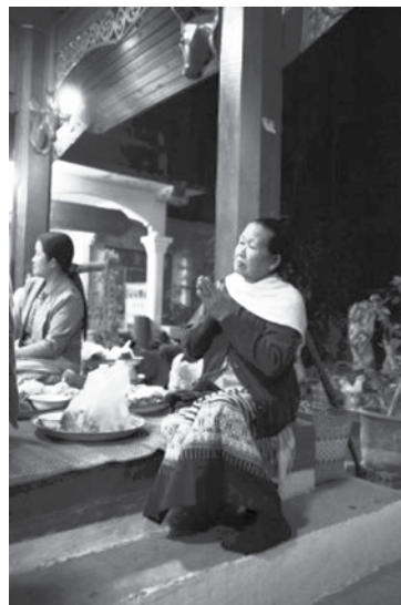
ภาพที่ 3 การนุ่งผ้าขึ้นตีนจกแม่แจ่มไปวัดในวันพระใหญ่ หรือวันศีลหลวง วันพระเพ็ญเดือนสี่ (สี่เป็ง) ทานข้าวใหม่ ดั่งหลัวผิงไฟพะเจ้า ที่วัดป่าแดด อำเภอแม่แจ่ม ที่มา : ก้องเกียรติ มหาอินทร์. ภาพถ่าย. 2557.

ปัจจุบัน วัฒนธรรมการนุ่งผ้าขึ้นตีนจกได้มีการปรับตัวเพื่อสถานการณ์ในการดำรงอยู่ ปัจจัยที่ส่งผลกระทบต่อการดำรงอยู่คือ การส่งเสริมจากภาครัฐ และกลุ่มบุคคลต่างๆ โดยเฉพาะนักวิชาการในพื้นที่ ด้วยการรณรงค์ให้มีการนุ่งผ้าขึ้นตีนจก การสร้างกระแสความตื่นตัวในการนุ่งผ้าขึ้นตีนจกแม่แจ่ม ส่งผลให้มีการนุ่งผ้าขึ้นตีนจกในหลายโอกาสมากขึ้น ถึงแม้ว่าในวิถีชีวิตประจำวันปัจจุบันผู้หญิงวัยรุ่นชนแม่แจ่มไม่ได้ใส่ผ้าขึ้นแล้วก็ตาม แต่เมื่อมีโอกาสอันสำคัญพบว่าผู้หญิงแม่แจ่มทั้งวัยเด็กและวัยรุ่นนุ่งขึ้นตีนจกทั้งหมด ส่วนผู้หญิงวัยกลางคนถึงวัยผู้เฒ่า ในวิถีชีวิตประจำวันยังนิยมนุ่งผ้าขึ้นอยู่เหมือนเดิม แต่ไม่ใช่ผ้าขึ้นตีนจก จะนุ่งผ้าขึ้นของชนเผ่าชาวลัวะ ผ้าขึ้นของชนเผ่าปกากะญอ และขึ้นลายก่าน อย่างไรก็ตาม ผ้าขึ้นตีนจกก็ยังเป็นผ้าขึ้นที่นุ่งในโอกาสที่สำคัญเหมือนเดิมและมีการนุ่งที่หลายโอกาส ซึ่งโอกาสในการใส่ผ้าขึ้นตีนจกที่หลากหลายนั้น เป็นปัจจัยที่มา