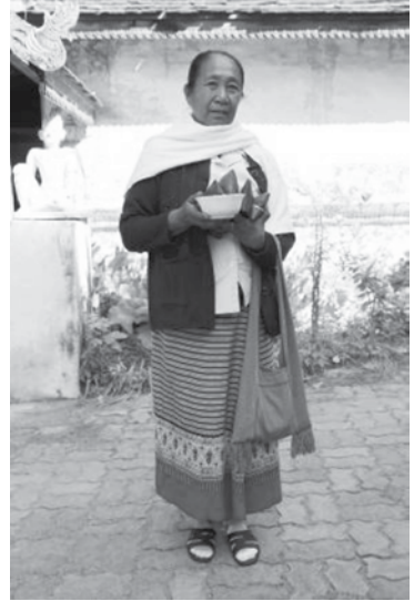
ภาพที่ 4 การนุ่งผ้าซิ่นตีนจกแม่แจ่มในเด็ก วัยรุ่น และแม่อยู่ ที่มา : ก้องเกียรติ มหาอินทร์. ภาพถ่าย. 2557.

นอกจากการปรับตัวในวัฒนธรรมการนุ่งผ้าซิ่นตีนจกของชาวแม่แจ่มให้เท่าทันกับสภาพสังคมและวัฒนธรรมที่เปลี่ยนไปแล้วนั้น ปัจจัยในการดำรงอยู่ในวัฒนธรรมการนุ่งผ้าซิ่นตีนจกแม่แจ่มที่สำคัญอีกประการหนึ่งคือ ความเชื่อในเรื่องการนุ่งผ้าซิ่นตีนจกเมื่อตัวตายพร้อมเผาไปกับร่าง การทำบุญที่วัดด้วยผ้าซิ่นตีนจกเพื่ออุทิศส่วนบุญส่วนกุศลไปให้กับผู้ตาย และการนำผ้าซิ่นตีนจกไปไหว้แม่สามีในวันแต่งงาน ดังกล่าวนี้นับเป็นวัฒนธรรมเดิม ที่ชาวแม่แจ่มยึดถือมาอย่างแนบแน่นกับวิถีชีวิต