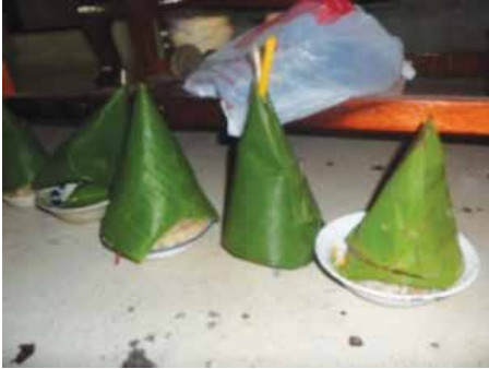
ภาพที่ 1 บายเบ็น