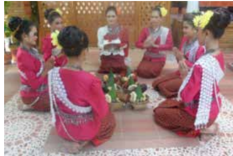
ภาพที่ 7 ทำบูชาเครื่องเซ่นไหว้

การแสดงช่วงที่ 2 ทำบูชาเครื่องเซ่นไหว้ สื่อให้ เห็นถึงขั้นตอนการประกอบพิธีกรรมแซนโฉนตาที่มีการ บูชาพานขันธ 5 แล้วเชิญผีตายายมารับเครื่องเซ่นไหว้ที่ลูก หลานได้เตรียมไว้ มีท่ารำที่ใช้กับอุปกรณ์ ใช้มือ ศีรษะ ลำ ตัว สื่อให้เห็นความหมายชัดเจนมากยิ่งขึ้น เช่น การยกพาน ขันธ 5 เพื่อเป็นการบูชาครู การพนมมือไหว้แสดงถึงความ เคารพ ต่อผีปู่ย่า ตายาย การหงายฝ่ามือพร้อมกระดิกนิ้ว แล้วโน้มตัวก้มลงให้ต่ำเป็นการเชิญดวงวิญญาณของผีปู่ย่า ตายาย ที่มาถึงบ้านให้เข้ามารับของที่ลูกหลานได้จัดเตรียมไว้