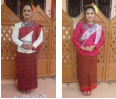
ภาพที่ 4 (ซ้าย) การแต่งกายของผู้แสดงเป็นผู้นำประกอบ พิธีกรรม (ขวา) การแต่งกายของผู้แสดงเป็นผู้ร่วมประกอบพิธีกรรม

การแต่งกายของผู้แสดง นุ่งผ้ามัดหมี่พื้นบ้าน สุรินทร์ เช่น ใส่เสื้อแขนกระบอกสีขาว และสีอื่นๆ ที่มีความ สดใสมีผ้าสไบพาดไหล่ ศีรษะจะเกล้าผมสูงติดดอกไม้ เครื่อง ประดับสร้อย ตุ่มหู เข็มขัดร้อยด้วยเม็ดประเก้อม