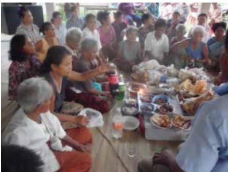
ภาพที่ 3 การประกอบพิธีแซนโฌนตาระดับชุมชน

2. ผลการพัฒนาศิลปะการแสดงจากพิธีกรรม แซนโฌนตา ผู้วิจัยได้พัฒนาศิลปะการแสดงจากการ สังเคราะห์บริบท ประวัติความเป็นมา ขั้นตอน คติความ เชื่อในด้านบทบาทหน้าที่ของคนในสังคม ในด้านคำร้อง โดยกล่าวถึงวันแซนโฌนตาเป็นงานรวมญาติลูกหลาน ญาติ พี่น้องที่ไปประกอบอาชีพหรือตั้งถิ่นฐานอยู่ที่อื่นไม่ว่าจะใกล้ หรือไกลจะต้องเดินทางกลับมารวมญาติเพื่อทำพิธีแซนโฌน ตาทำบุญให้กับบรรพบุรุษที่ล่วงลับไป ใช้การถ่ายทอด บทเพลงด้วยภาษาเขมรพื้นบ้านสุรินทร์ ด้านทำนอง ใช้ ทำนองเพลงทั้งหมด 4 ทำนอง คือ ทำนองแซรีย ยอง (สาว น้อยในดวงใจ) เป็นทำนองที่มีจังหวะเร็ว มีความสนุกสนาน ใช้ในช่วงแรกคือการแสดงเชยชวนญาติพี่น้องทุกคน นำ เครื่องแซนโฌนตามารวมกันเพื่อประกอบพิธีแซนโฌนตา ทำนองพนมสรวจ (เข่าแหลม) เป็นทำนองที่มีจังหวะช้าใช้ ในช่วงที่สอง คือการแสดงประกอบพิธีแซนโฌนตาโดยเริ่ม จากการพูดเพื่อเรียกวินญาณผีบรรพบุรุษมารับประทาน เครื่องเช่นไหว้ ทำนองกัจปะกา (เด็ดดอกไม้) เป็นทำนอง ที่มีจังหวะช้าใช้ในช่วงที่สามแสดงถึงวินญาณผีบรรพบุรุษ ได้ดื่มกินของเช่นไหว้เรียบร้อยแล้วก่อนกลับก็ให้นำเสื้อผ้า ที่ลูกหลานได้จัดเตรียมนำไปใช้ด้วย ทำนองเสนาะเวียลทม (สงสารทุ่งกว้างใหญ่) เป็นทำนองที่มีจังหวะเร็วใช้ในวง สุดท้ายเป็นการเช่นไหว้บูชาบรรพบุรุษเสร็จแล้วก็จะมีการ เลี้ยงสังสรรค์ในหมู่เครือญาติ จากนั้นก็จะส่งดวงวิญญาณ ของผีบรรพบุรุษกลับสู่สรวงสวรรค์โดยนำของเช่นไหว้ส่วน หนึ่งไปทิ้งและทำบุญในตอนเช้าที่วัด ด้านดนตรี เครื่อง ดนตรีประกอบในการแสดงเรอมนแซนโฌนตาใช้วงกันตรึม คณะกันตรึมศรีระยองบรรเลง มีเครื่องดนตรีทั้งหมด 6 ชนิด ได้แก่ กลองกันตรึม ซอกกลาง (ซอกันตรึม) ปี่อ้อ ฉิ่ง ฉาบ กรับ