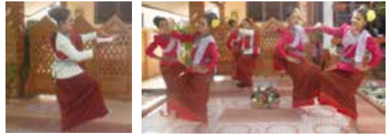
ภาพที่ 6 ทำเชิญชวน

การแสดงช่วงที่ 1 ทำเชิญชวนและนำเครื่อง แขนโฉนตามาบูชา แสดงให้เห็นถึงการรวมกลุ่มของญาติ พี่น้อง ชุมชนเตรียมสำหรับอาหารเป็นเครื่องแขนเพื่อนำมา ประกอบพิธีกรรม