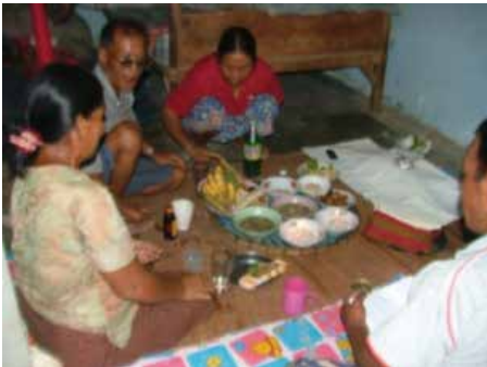
ภาพที่ 2 การประกอบพิธีแซนโฌนตาระดับครอบครัว