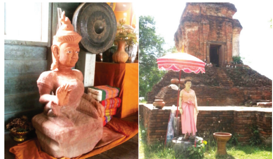
รูปแกะสลักหินย่าหม่อมบนศาลาการเปรียญ และรูปปั้นย่าหม่อมที่หน้าพระธาตุบ่อพันขัน วัดพระธาตุบ่อพันขัน

พระติวะ จึงได้ประดิษฐานศิวิลิ่งไว้บนแท่นโยนที่ชาวบ้านยังให้ความเคารพและในงานสงกรานต์ก็จะจัดสงกรานต์ย่าหม่อมซึ่งเป็นรูปแกะสลักผู้หญิงจากหินทรายขุดพบในพระธาตุแห่งนี้เมื่อครั้งกรมศิลปากรได้ขุดตกแต่งโบราณสถาน แต่ทว่าเดิมที่นั่นรูปย่าหม่อมไม่มีเศียรแต่ชาวบ้านได้ให้ช่างแกะสลักหินแกะเศียรใหม่ตามคำบอกลักษณะของนางเทยัมที่เป็นคนวาดภาพหน้าตาของย่าหม่อมให้แกะตาม และชาวบ้านยังร่วมกันสร้างหุ่นจำลองของย่าหม่อมนี้ไว้ที่บริเวณหน้าพระธาตุบ่อพันขันเพื่อให้เป็นที่บูชาของผู้คน