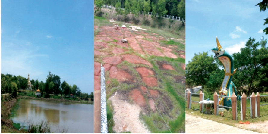
แหล่งน้ำธรรมชาติ (น้ำเค็ม) บ่อน้ำพันขัน และรูปปั้นพระยานาค จากความเชื่อว่าพิษทำให้น้ำบริเวณบ่อพันขันมีรสเค็ม

บ้านเรียกว่า น้ำสาคร เพราะมีลักษณะเหมือนครกตำข้าว และบริเวณทั้งหมดทั่วบริเวณนั้น เรียกว่า บ่อพันขัน เมื่อปราบพญานาคเสร็จแล้วก็แสดงธรรมโปรดชาวเมืองให้ยึดมั่นใน พระรัตนตรัย จากนั้นก็กลับเข้าเฝ้าพระพุทธองค์ และมีได้กลับคืนมาสู่ดินแดนแถบนี้