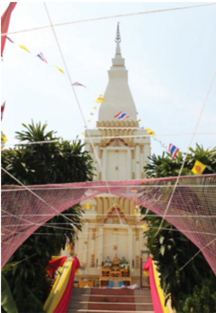
ภาพพระธาตุโมคคัลลา วัดกลาง อ.สุวรรณภูมิ

การผสมผสานทางความเชื่อวัฒนธรรมแบบพราหมณ์ พุทธ และผี ของชุมชนในทุ่งกุลาร้องไห้ทำให้เห็นว่าการสร้างพื้นที่ทางวัฒนธรรมของชุมชนในบริเวณทุ่งกุลาร้องไห้มีการผสมผสานและทับซ้อนทางความเชื่อ ตั้งแต่ดั้งเดิมเรื่องพราหมณ์ตามอาณาจักรขอมโบราณ และถูกทับซ้อนด้วยความเชื่อทางพุทธศาสนาด้วยการสร้างตำนานพุทธศาสนาแบบพื้นบ้านอธิบายการเป็นอยู่ของโบราณสถานที่มีมาดั้งเดิมแล้ว และการเชื่อมต่อของวัฒนธรรมทั้ง 2 รูปแบบนั้นยังคงมีความเชื่อผีบรรพบุรุษเข้ามามีส่วนร่วมและเชื่อมโยงความเชื่อทั้งหมดเข้าหากันและอยู่ร่วมกันได้อย่างสันติ การปฏิบัติต่อพื้นที่ทางวัฒนธรรมเหล่านี้ล้วนแล้วแต่เป็นการใช้พิธีกรรม การใช้ตำนานเพื่อยืนยันความหมายของพื้นที่ในเขตตอนกลางทุ่งกุลาร้องไห้ให้กลายเป็นพื้นที่เมืองหลวงเดิมและเป็นที่อยู่ของเหล่าเทพเจ้า เป็นพื้นที่ศักดิ์สิทธิ์ที่ทุกคนต้องให้ความเคารพ เป็นกลวิธีแบบพื้นบ้านที่สามารถสร้างสรรคพิธีกรรมต่อพื้นที่อันเป็นการแสดงออกถึงความหวงแหนพื้นที่ทำกินควบคู่กับการเคารพบูชาในพื้นที่เพื่อการอนุรักษ์ทรัพยากรของชุมชน แม้ว่าเดิมทีหลักฐานทางประวัติศาสตร์จะบ่งบอกว่าพื้นที่เหล่านี้เคยเป็นกลุ่มชาวเขมรมาก่อนแต่เมื่อปัจจุบันกลุ่มลาวอีสาน