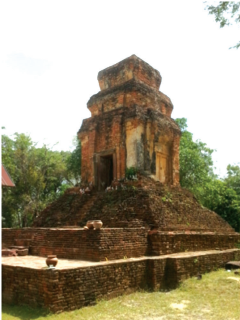
พระธาตุบ่อพันขัน บ้านตาเณร ต.จำปาขัน อ.สุวรรณภูมิ จ.ร้อยเอ็ด

เล่าว่าเมื่อพระพุทธเจ้าเสด็จมาเพื่อปราบพระยานกอินทรีที่กำเริบจับพระยาช้างเผือก และผู้คนในแถบป่าดงหลวงหรือทุ่งกุลาร้องไห้กิน และกำราบพระยานาคศรีสุทโธที่พ่นพิษใส่ผู้คนในบริเวณเมืองจำปาขันนครจนได้รับความเดือดร้อนนั้น พระพุทธเจ้าได้ให้พระโมคคัลลานะผู้มีฤทธิ์มาก เป็นผู้ไปปราบส่วนพระองค์นั้นประทับรอยอยู่ที่แห่งหนึ่ง ครานั้นวิษณุกรรมเทพบุตรจึงได้มานรมิตปราสาทเพื่อเป็นที่ประทับของพระพุทธเจ้าไว้ จึงกลายเป็นปราสาทบ่อพันขันในปัจจุบัน ซึ่งหลักฐานของกรมศิลปากรที่ 10 ร้อยเอ็ด ได้ขุดพบแท่นศิวิลิ่งคั่นฐานโยนที่ปราสาทแห่งนี้ เป็นปราสาทฐานศิลาแลง ก่อด้วยอิฐ ยอดปราสาทพังหายไป แต่ปัจจุบันจากความเชื่อตามแนวพุทธศาสนาชาวบ้านได้ร่วมกันสร้างและประดิษฐานพระพุทธรูปไว้แทนที่เพื่อเป็นที่เคารพบูชาในเดือนห้าของทุกปีชาวบ้านจะจัดงานสงกรานต์ โดยมิชชวนแห่เชิญน้ำจากบ่อพันขันมาสงกรานต์ ในนามตัวแทนของเจ้าปู่ผ่านที่ปฏิบัติต่อพุทธศาสนา