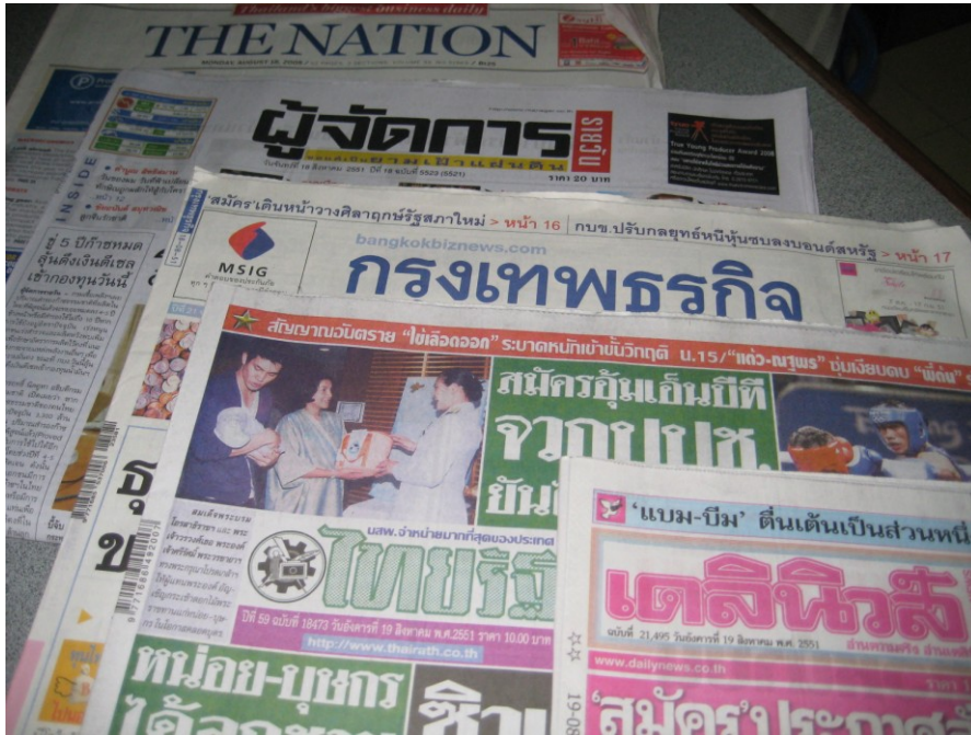
ภาพที่ 5.1 หนังสือพิมพ์

เบคคอฟ (Beckoff, 1965, 5) กล่าวถึง หนังสือพิมพ์เป็นอุปกรณ์การสื่อสารมวลชนประเภท ตีพิมพ์ ออกจำหน่ายเป็นประจำสม่ำเสมอ หนังสือพิมพ์เข้าในสหรัฐอเมริกาบรรจุกำเฉลี่ยฉบับละ ประมาณ 60,000 คำ เนื้อที่ประมาณร้อยละ 20 ของหนังสือพิมพ์เป็นโฆษณา ร้อยละ 10 เป็นบทความและเรื่องตลกขบขัน ร้อยละ 5 เป็นบทบรรณาธิการ ส่วนเนื้อหาที่เหลือนอกนั้นเป็นข่าว