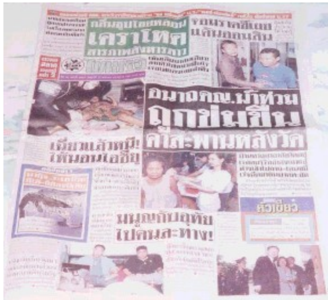
ภาพที่ 5.2 ข่าวหน้า 1