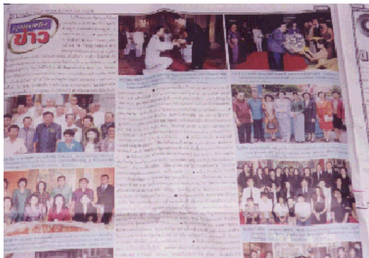
ภาพที่ 5.3 ข่าวสังคม