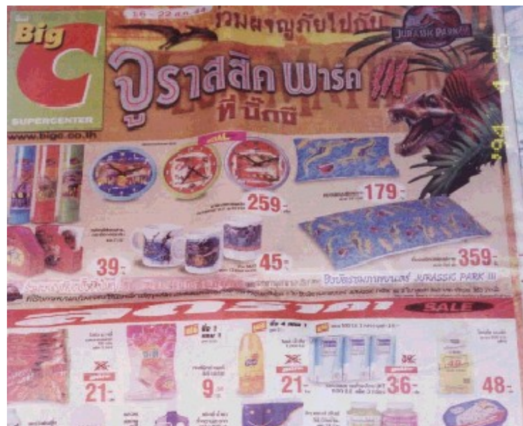
ภาพที่ 5.5 โฆษณาขายสินค้า