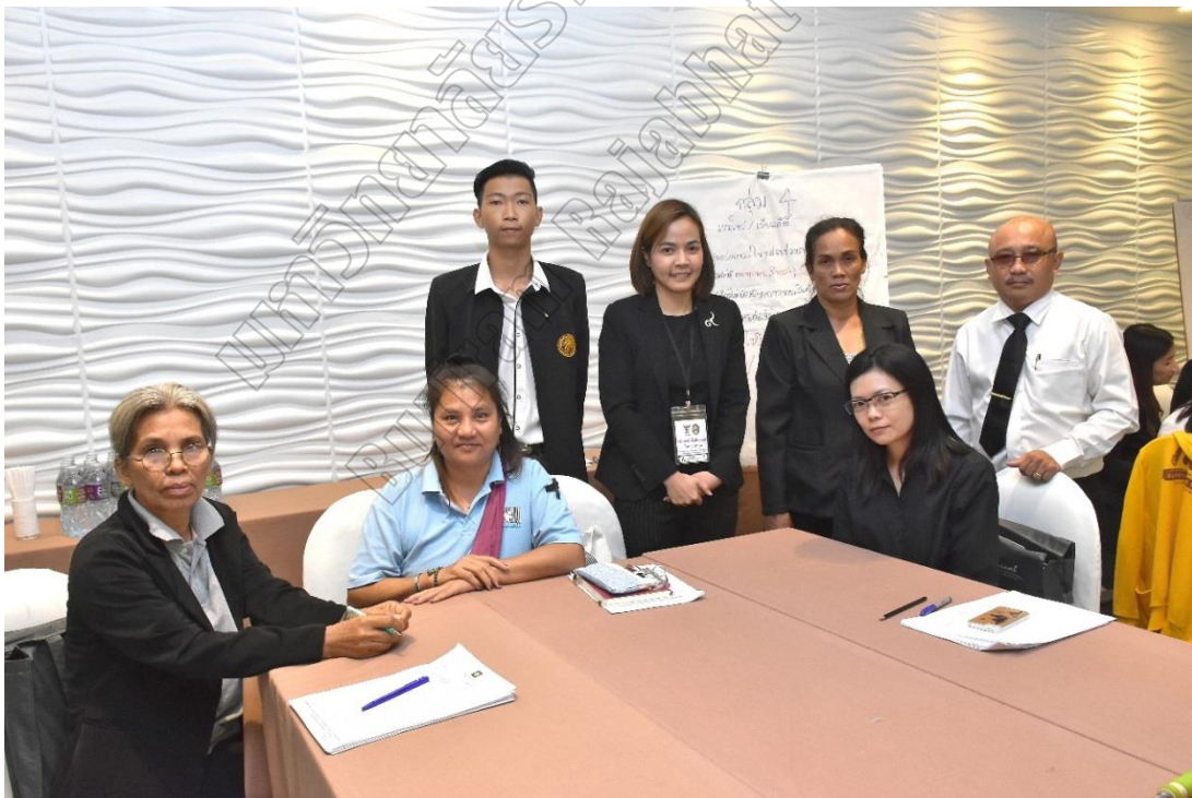
ภาพที่ 2: การจัดประชุมเชิงปฏิบัติการเพื่อรับฟังความคิดเห็นและข้อเสนอแนะ ภาคตะวันออกเฉียง

3. คณะผู้วิจัยสังเคราะห์ความคิดเห็นและข้อเสนอแนะ จากนั้นดำเนินการจัดทำแนวทางการกำกับดูแลตัวเองเพื่อเป็นมาตรฐานจริยธรรมขั้นพื้นฐาน ในรายการเกมโชว์และเรียลลิตี้โชว์