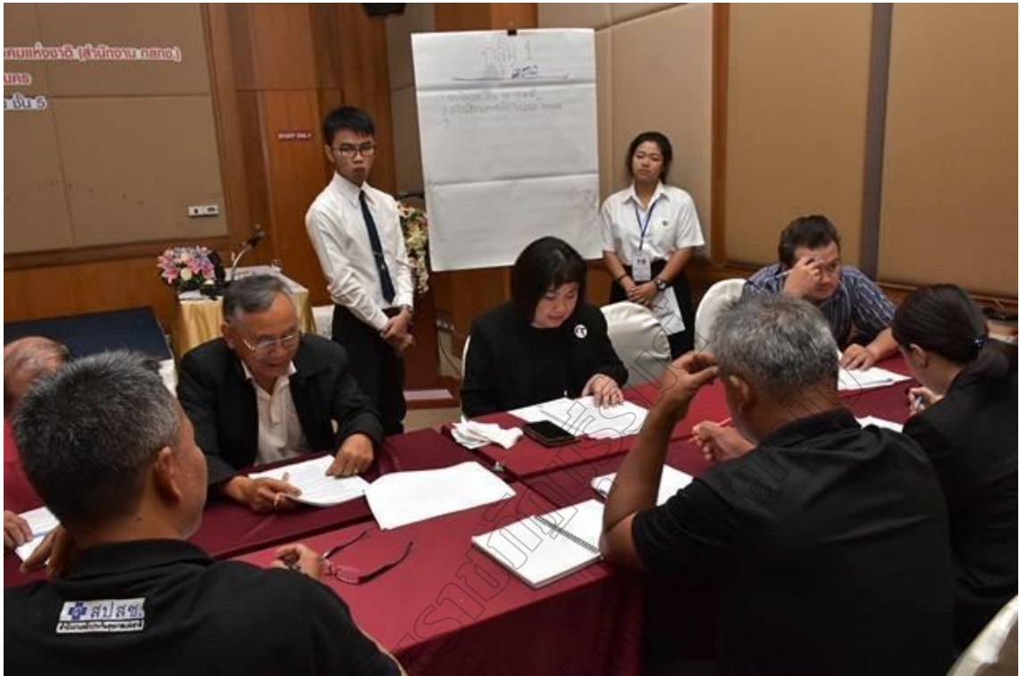
ภาพที่ 3: การจัดประชุมเชิงปฏิบัติการเพื่อรับฟังความคิดเห็นและข้อเสนอแนะ ภาคตะวันออกเฉียงเหนือ