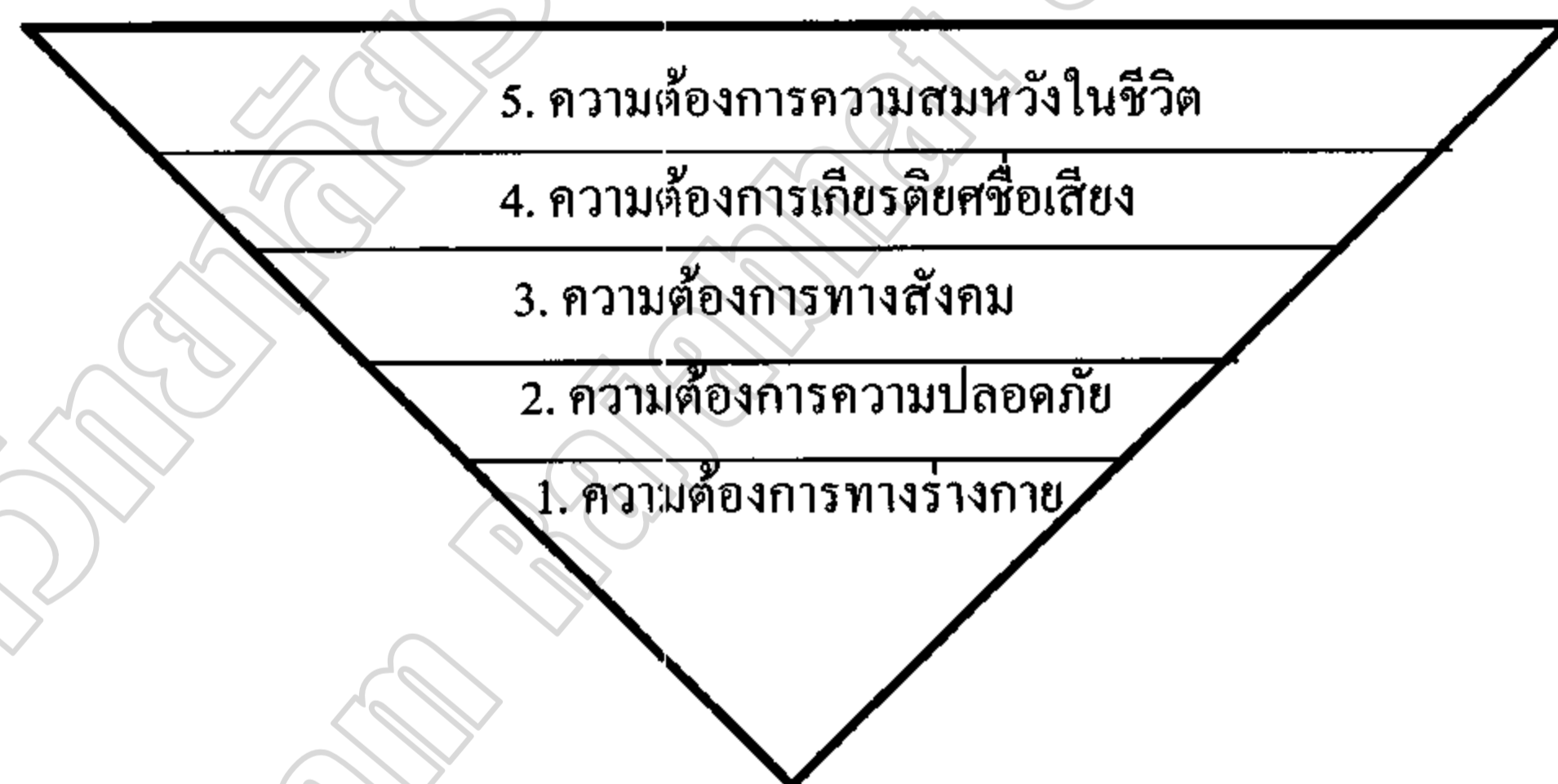
ภาพ 2.1 : แสดงลำดับความต้องการของมนุษย์ตามแนวคิดของ Maslow

ตุลา มหาพสุชานนท์ (2547, หน้า 247 - 248) ได้กล่าวถึงทฤษฎีลำดับชั้นความต้องการของ Maslow ว่า มองความต้องการของมนุษย์เป็นลักษณะลำดับชั้นต่างๆ เหมือนขั้นบันได ซึ่งตามความต้องการเหล่านี้ต้องเป็นไปตามลำดับชั้นก่อนหลัง ไม่อาจกระโดดข้ามขั้นได้และยังระบุว่าบุคคลมีความต้องการเรียงลำดับพื้นฐานที่สุดไปยังระดับสูงสุด Maslow เห็นว่าความต้องการของบุคคลมีห้ากลุ่มจัดแบ่งได้เป็นห้าระดับจากระดับต่ำไปสูงเพื่อความเข้าใจมักจะแสดงลำดับของความต้องการเหล่านี้โดยภาพ ดังนี้