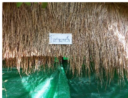
ภาพที่ 18 โรงเรือนบ่มเชื้อ