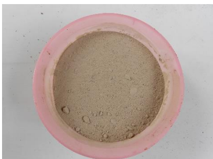
ภาพที่ 21 รำละเอียด