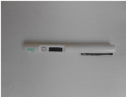
ภาพที่ 3 เครื่องวัดอุณหภูมิ