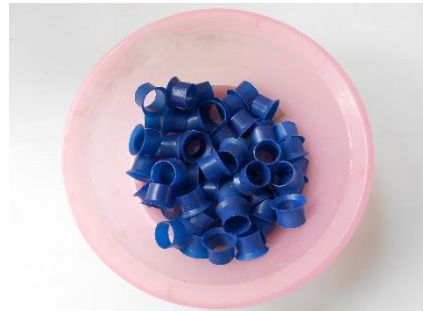
ภาพที่ 4 คอขวดพลาสติก