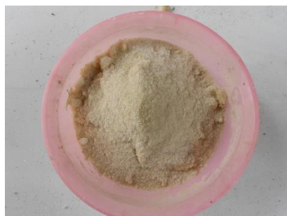
ภาพที่ 22 ดีเกลือ