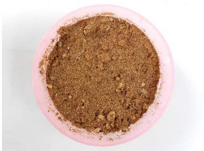
ภาพที่ 19 ซีลี้อยเก่า