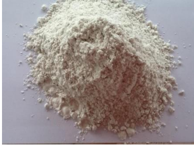
ภาพที่ 25 ยิบซั่ม