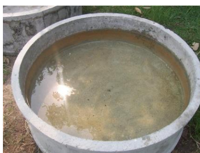
ภาพที่ 24 น้ำสะอาด