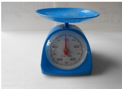
ภาพที่ 5 ตาชั่ง