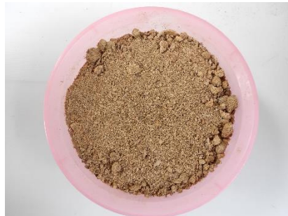
ภาพที่ 20 ซีลี้อยใหม่