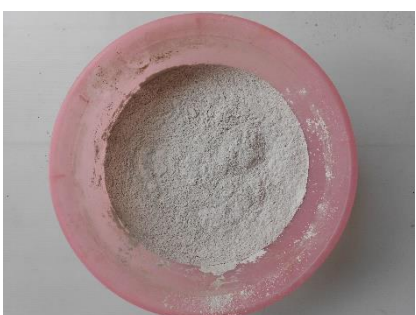
ภาพที่ 23 ปูนขาว