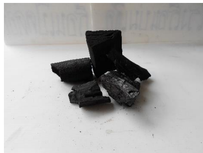
ภาพที่ 6 ถ่าน