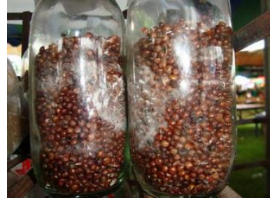
ภาพที่ 26 เชื้อเห็ดนางฟ้า