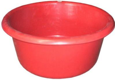
ภาพที่ 1 กะละมัง