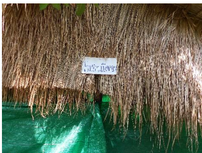
ภาพที่ 17 โรงเรือนเปิดดอก