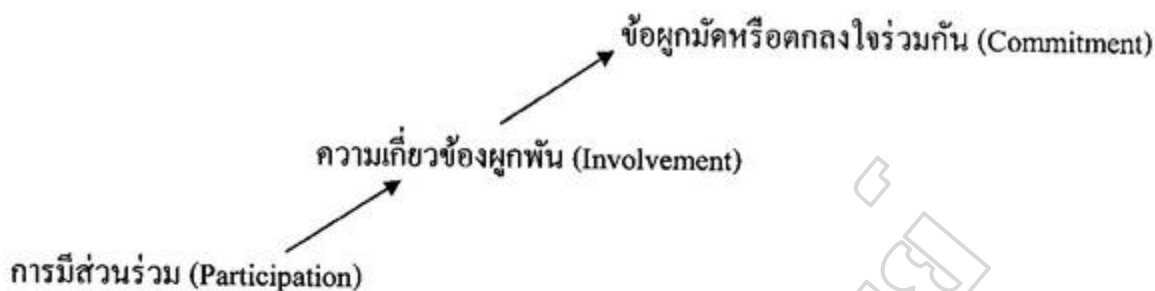
ภาพประกอบ 2.2 ระดับความผูกพัน