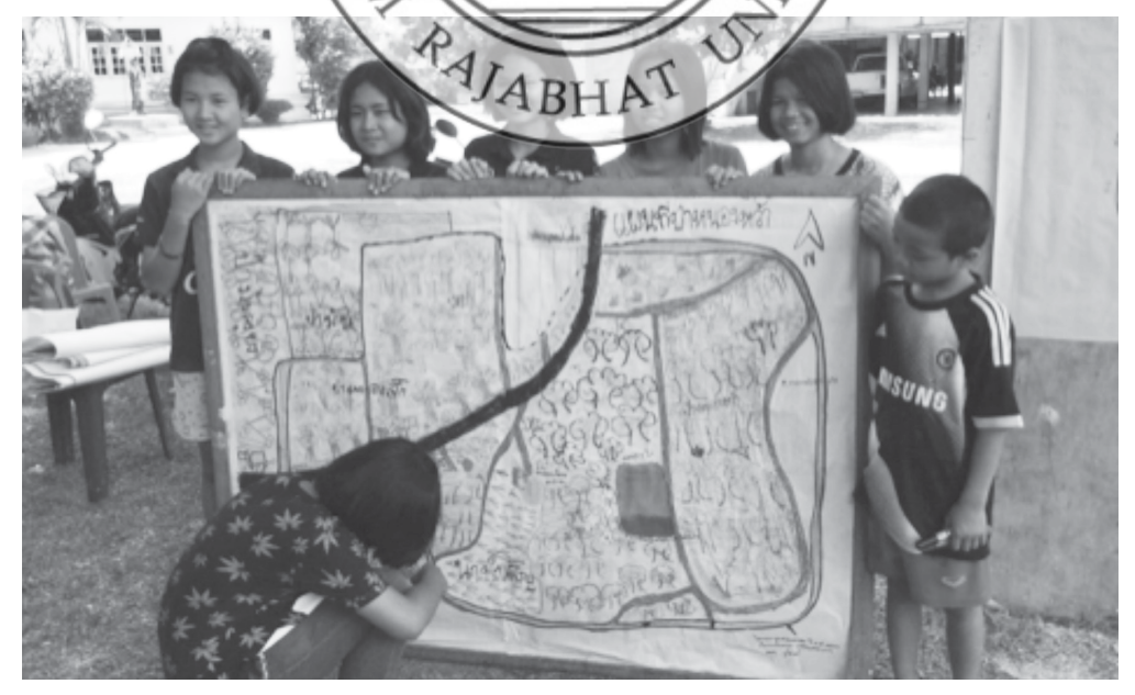
ภาพที่ 3 วาดผังทรัพยากรป่าชุมชนตำบลโคกกลางร่วมกันโดยเยาวชนและผู้สูงอายุในชุมชน

2. ขั้นตอนการทดลองใช้แผนปฏิบัติการ เริ่มจากการ สำรวจบริเยตปางุมชนและชุมชนรอบป่า สำหรับผลจากการ ริเคราะหน้อมูลบริเยทชมชนในด้านทรัพยากร-ปาชุมชน ทำให้ ได้ข้อมูลขนาดพื้นที่ แหลงน้ำ ปาไม้ อาณาเขต ที่ตั้ง ความหลาก หลายของพืชพันธุ์ไม้ พันธุ์สัตว์ การใช้ประโยชน์จากป่า สภาพการ จัดการปาร่วมกัน ร่วมทั้งการรุกล้ำทรัพยากรปา ได้แก่ อาณาเขต พี่ตั้ง ความหลากหลายของพืชพันธุ์ไม้ พันธุ์สัตว์ พบว่า ปานี้เป็น ปัจชุมชนแห่งหนึ่งซึ่งมีทรัพยากรค่อนข้างสมบูรณ์ เป็นแหล่งสะสม อาหารของชุมชนโดยรอบ มีของดีที่อยู่ในปามากมาย ได้แก่ พีช ผักในป๋า ไห้ด สมุนไพร เป็นต้น ซึ่งส่งผลดีด้านเศรษฐกิจชุมชน เครื่องมือในการเก็บข้อมูล ได้แก่ ปฏิทินฤดูกาลหรือผลผลิตจาก ปาชุมชน ปฏิทินเทาะปลูกหรือการผลิต (อาชีพ) และ การใช้ ประเด็นคำถามเทือเก็บข้อมูล การเดินสำรวจ วาดผัง การสนทนา กลัม/การโสเหล่ การสัมภาษณ์เจาะลึก และการเล่าเรื่อง