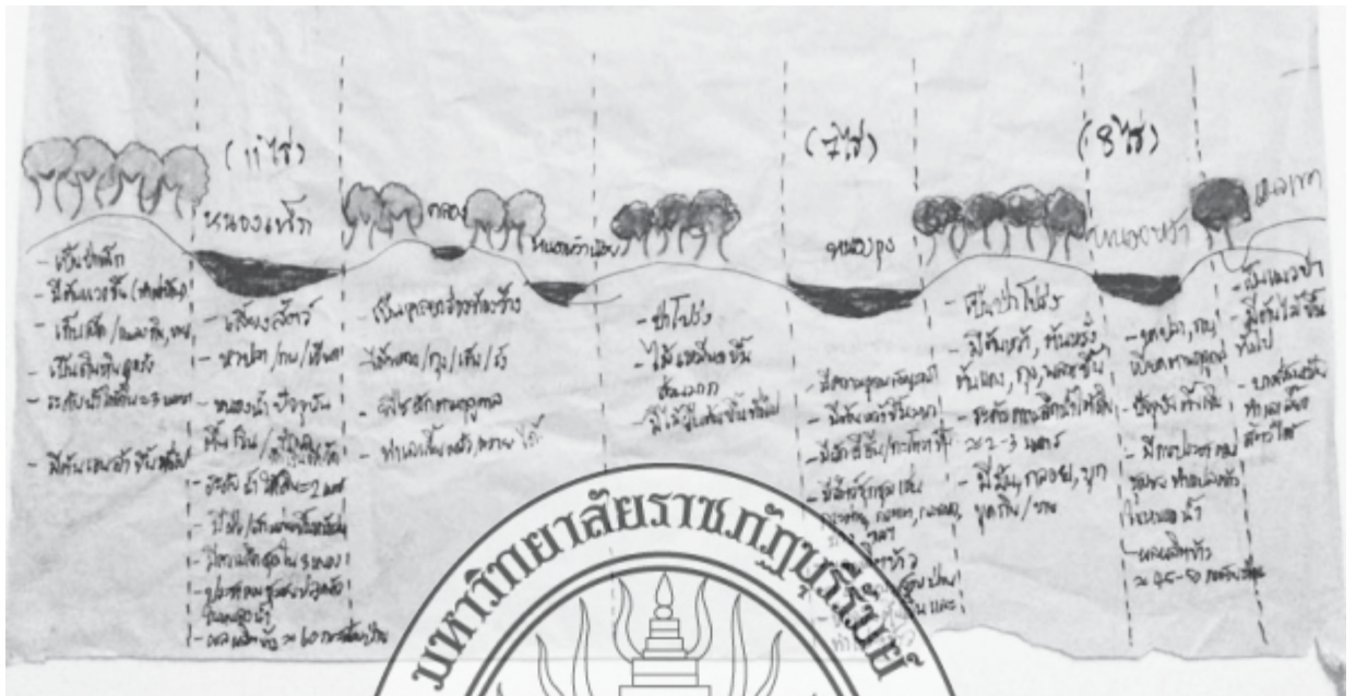
ภาพที่ 4 ภาพตัดขวางพื้นที่ป่าชุมชนตำบลโคกกลาง อำเภอลำปลายมาศ จังหวัดบุรีรัมย์

ต่อมาใช้กิจกรรม การสำรวจความสมบูรณ์ของป่าด้วยคนในชุมชน สร้างความตระหนักให้กับเยาวชน จากการทำงานกลุ่ม ทำให้เยาวชนเกิดความรักสามัคคี ร่วมมือร่วมแรงกันภายในกลุ่ม การเรียนรู้จากพื้นที่จริงในป่า ทำให้เยาวชนมีความตระหนักเกี่ยวกับพันธุ์พืชไม้ในป่ามากขึ้น มีการนำเรื่องราวไปเล่าสู่ผู้ปกครอง เป็นการสร้างการรับรู้และสร้างความตระหนักให้ผู้ปกครองได้เห็นได้ฟัง โดยใช้รูปแบบกระบวนการสร้างการเรียนรู้ข้ามวัย (เด็ก-ผู้สูงอายุ) ซึ่งกิจกรรมที่ช่วยสร้างความสัมพันธ์อันดีระหว่างเยาวชนคนรุ่นหลังกับผู้สูงอายุในชุมชน พูดคุยแลกเปลี่ยนข้อมูลร่วมกัน ในเรื่องทรัพยากรป่าไม้ในชุมชน เช่น กิจกรรมเดินสำรวจป่าเพื่อศึกษาพันธุ์พืช สัตว์ สมุนไพร กิจกรรมวาดผังป่าชุมชน กิจกรรมปฏิบัติอาชีพ โดยให้ผู้สูงอายุเล่าแล้วให้เด็กเยาวชนเป็นคนวาดหรือเขียนเพิ่มเติมรายละเอียด ซึ่งกิจกรรมเหล่านี้ทำให้เกิดการกระตุ้นให้คนในชุมชนตื่นตัวกับกระบวนการสร้างจิตสำนึกรักษาป่าเพื่อการฟื้นฟูป่าอย่างยั่งยืน การทำแผนที่ป่าด้วยเครื่องมือ GPS โดยชุมชน เป็นเครื่องมือที่สามารถแสดงอาณาเขตป่า หนองน้ำ เขตป่าที่โดนบุกรุกเข้าไปทำกิน ทำให้ทราบพื้นที่ป่าที่แน่นอนเหลือเพียง 710.37 ไร่ ทำให้คนในชุมชนรู้สึกว่าการในชุมชนต้องหันมาดูแลป่าที่คงเหลืออยู่ การใช้เครือข่ายยุววิจัย ที่ได้รับการอบรมความรู้ทักษะด้านการวิจัยจากสถาบันวิจัยและพัฒนา มหาวิทยาลัยราชภัฏบุรีรัมย์ ให้กับตัวแทนเยาวชนในชุมชน จำนวน 5 คน มีส่วนช่วยในการสื่อสารและถ่ายทอดความรู้ให้กับเยาวชนคนอื่นๆในชุมชน จึงเป็นการส่งเสริมให้เกิดการประชาสัมพันธ์หรือ