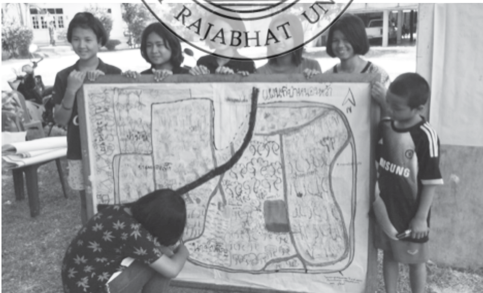
ภาพที่ 3 วาดผังทรัพยากรป่าชุมชนตำบลโคกกลางร่วมกันโดยเยาวชนและผู้สูงอายุในชุมชน

2. ขั้นตอนการทดลองใช้แผนปฏิบัติการ เริ่มจากการสำรวจบริบทป่าชุมชนและชุมชนรอบป่า สำหรับผลจากการวิเคราะห์ข้อมูลบริบทชุมชนในด้านทรัพยากร-ป่าชุมชน ทำให้ได้ข้อมูลขนาดพื้นที่ แหล่งน้ำ ป่าไม้ อาณาเขต ที่ตั้ง ความหลากหลายของพืชพันธุ์ไม้ พันธุ์สัตว์ การใช้ประโยชน์จากป่า สภาพการจัดการป่าร่วมกัน รวมทั้งการรุกป่าทรัพยากรป่า ได้แก่ อาณาเขตที่ตั้ง ความหลากหลายของพืชพันธุ์ไม้ พันธุ์สัตว์ พบว่า ป่านี้เป็นป่าชุมชนแห่งหนึ่งซึ่งมีทรัพยากรค่อนข้างสมบูรณ์ เป็นแหล่งสะสมอาหารของชุมชนโดยรอบ มีของดีที่อยู่ในป่ามากมาย ได้แก่ พืชผักในป่า เห็ด สมุนไพร เป็นต้น ซึ่งส่งผลดีด้านเศรษฐกิจชุมชน เครื่องมือในการเก็บข้อมูล ได้แก่ ปฏิทินฤดูกาลหรือผลผลิตจากป่าชุมชน ปฏิทินเพาะปลูกหรือการผลิต (อาชีพ) และ การใช้ประเด็นคำถามเพื่อเก็บข้อมูล การเดินสำรวจ วาดผัง การสนทนากลุ่ม/การไฮเลท การสัมภาษณ์เจาะลึก และการเล่าเรื่อง