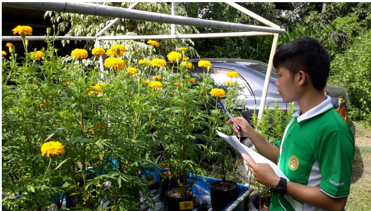
ภาพผนวกที่ 34,35 ระยะดาวเรืองออกดอกชุดแรก