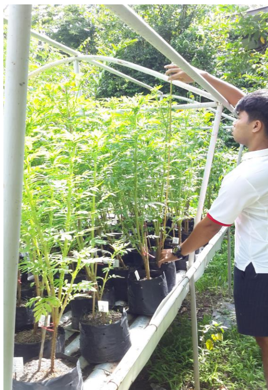
ภาพผนวกที่ 30 วัดความสูงในช่วงอายุ 45วัน