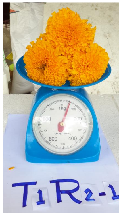
ภาพผนวกที่ 41,42,43 ชั่งน้ำหนักสดดอกดาวเรือง