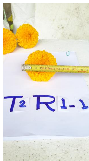
ภาพผนวกที่ 38,39,40 วัดเส้นผ่าศูนย์กลางดอกดาวเรือง