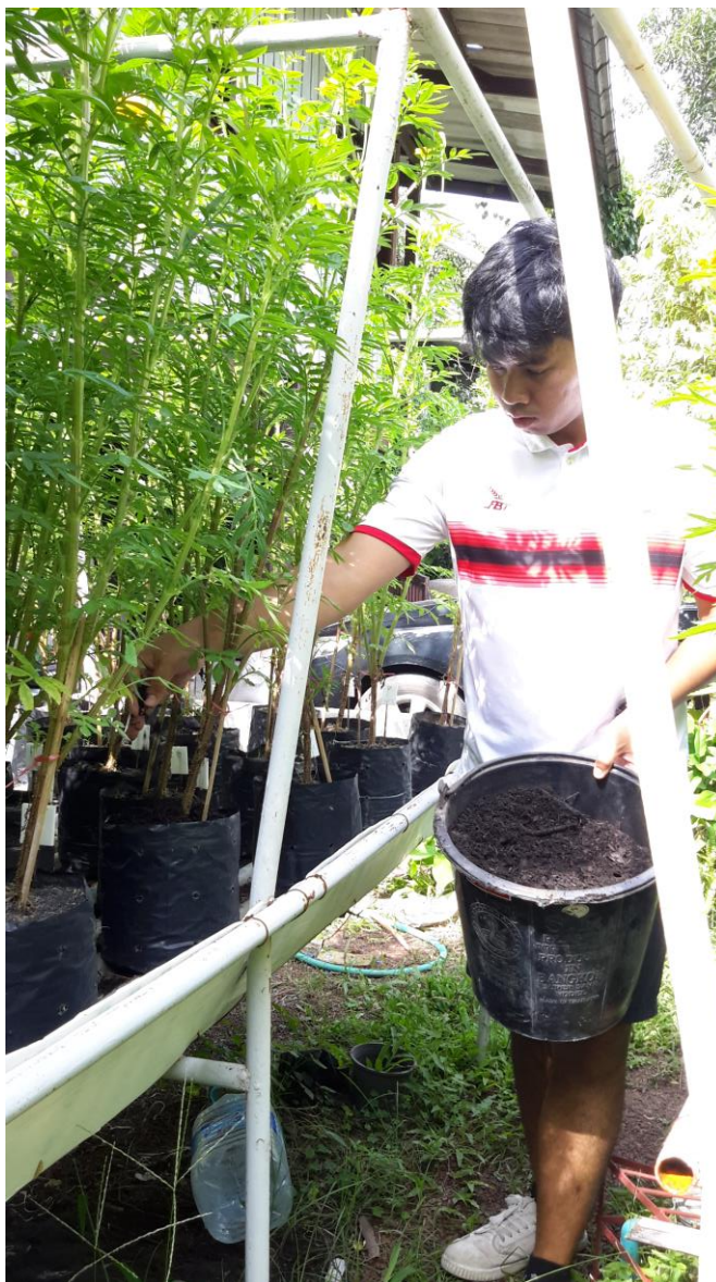
ภาพผนวกที่ 29 ไผ่ปลูกครั้งที่ 1 T1R1-T4R3