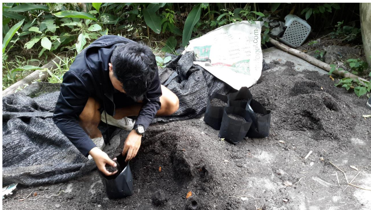
ภาพผนวกที่ 9,10 เตรียมวัสดุปลูกใส่ถุงดำ