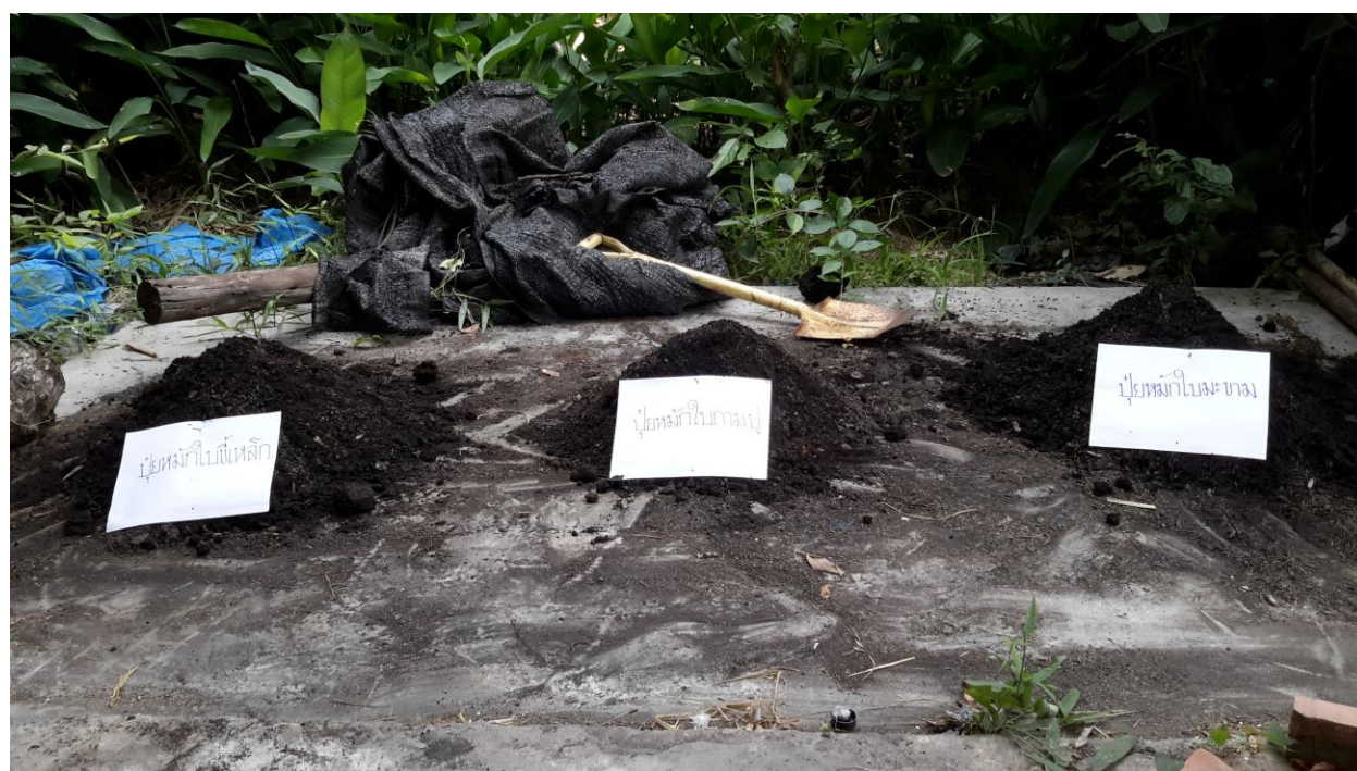
ภาพผนวกที่ 1,2 ปุ๋ยหมักใบก้ามปู ใบขี้เหล็ก และใบมะขาม