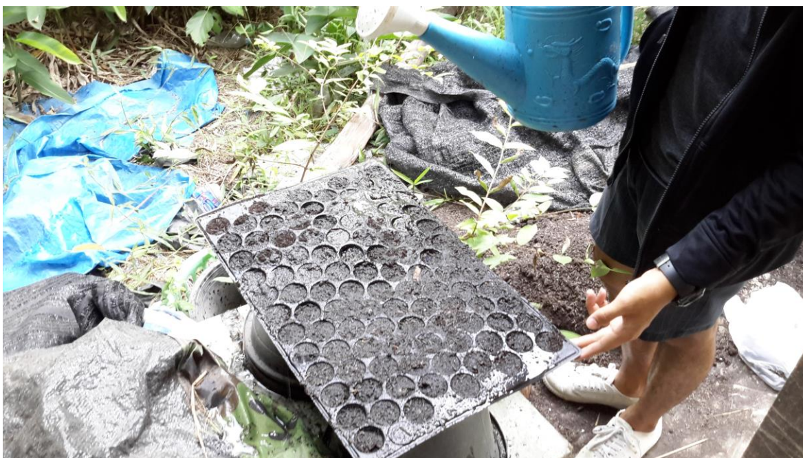
ภาพผนวกที่ 5,6 ถาดเพาะกล้า