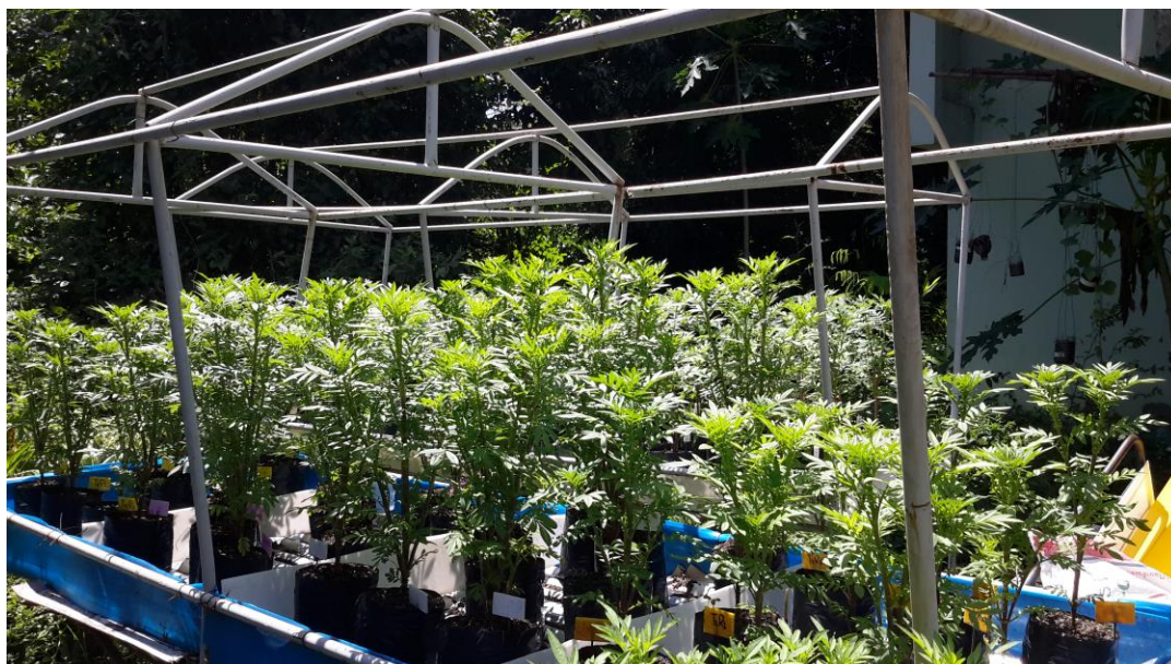
ภาพผนวกที่ 23,24 ความแตกต่างในช่วงของความสูง