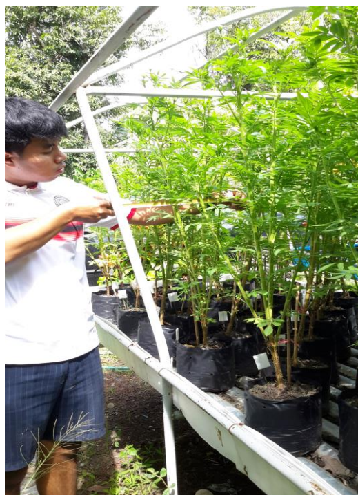
ภาพผนวกที่ 31 วัดทรงพุ่มในช่วงอายุ 45วัน