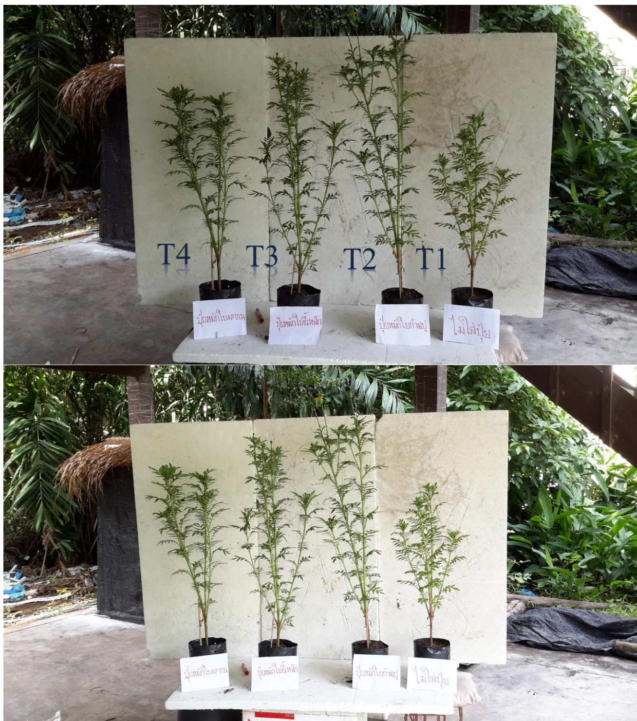
ภาพผนวกที่ 32,33 ความแตกต่างของต้นดาวเรือง