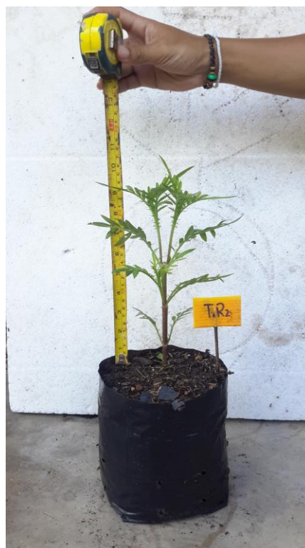
ภาพผนวกที่ 15,16 วัดความสูงช่วงอายุ 15 วัน