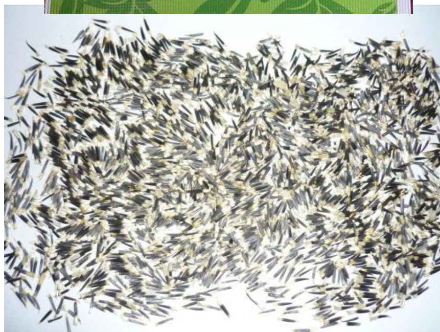
ภาพผนวกที่ 3,4 เตรียมเมล็ด ดาวเรืองพันธุ์ เทวีF1