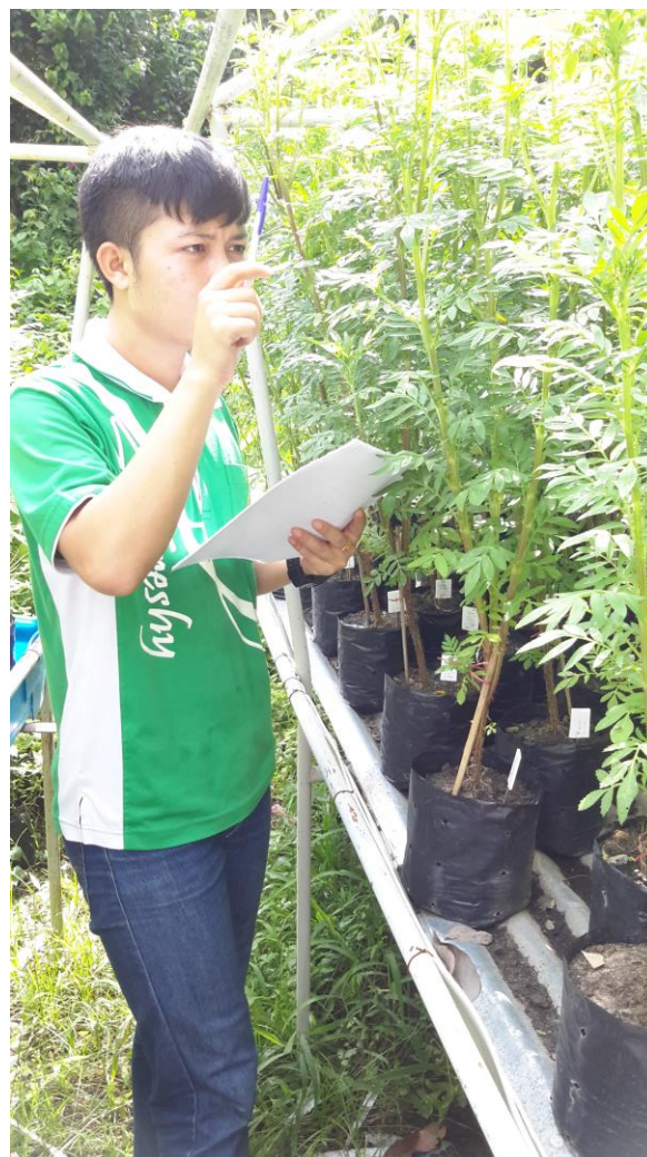
ภาพผนวกที่ 27,28 นับกิ่งแตกแขนง