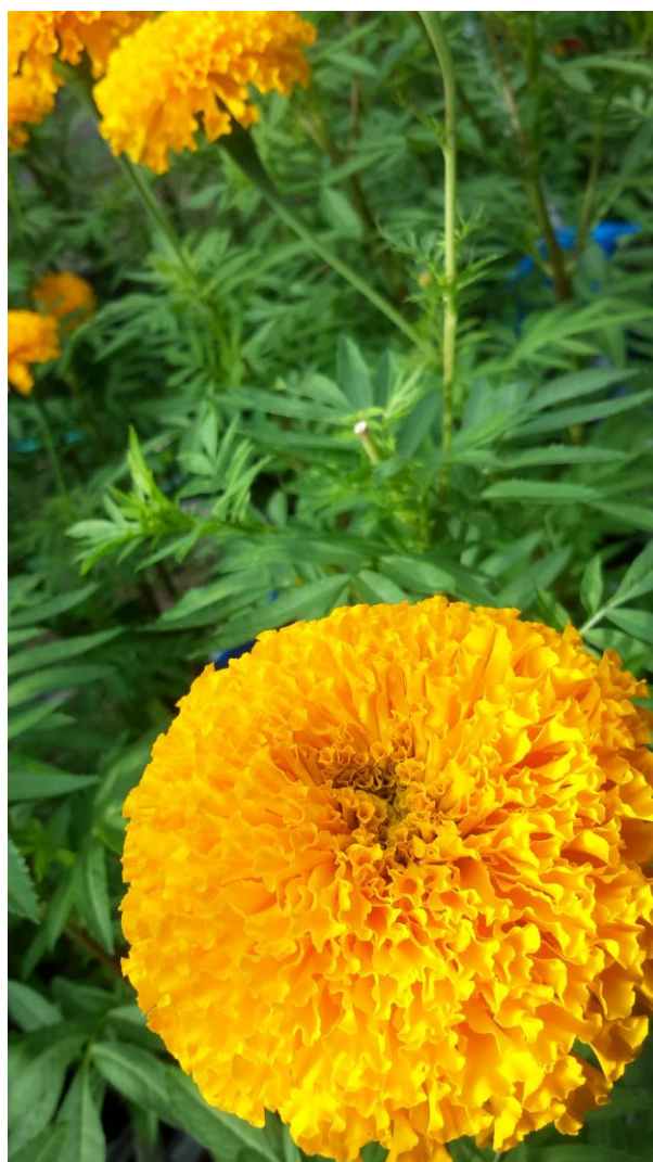
ภาพผนวกที่ 36,37 การตัดดอก