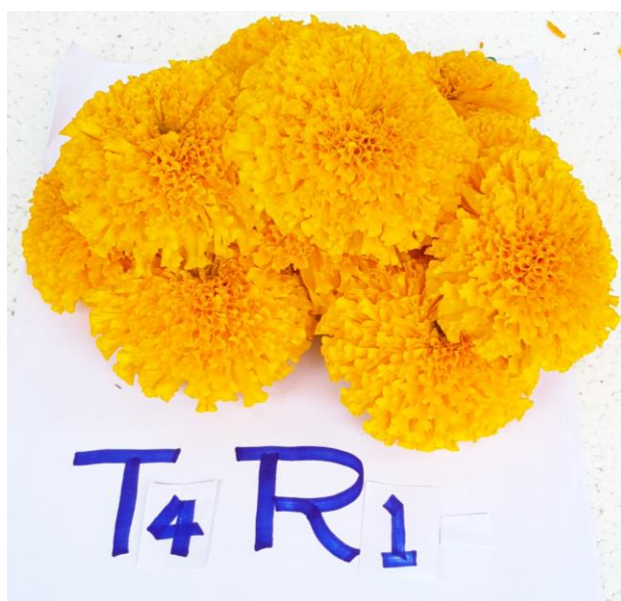
ภาพผนวกที่ 44,45,46,47 ความแตกต่างการออกดอก รุ่น1