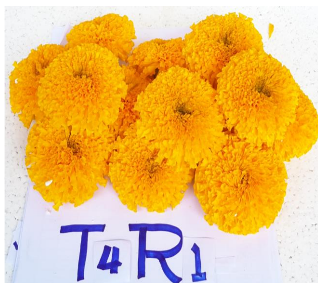
ภาพผนวกที่ 48,49,50,51 ความแตกต่างการออกดอก รุ่น2