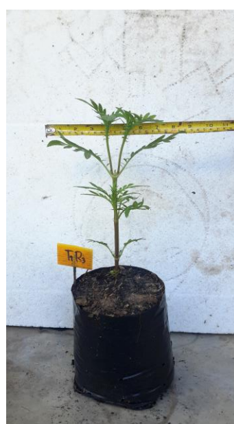
ภาพผนวกที่ 17,18 วัดทรงพุ่มช่วงอายุ 15 วัน