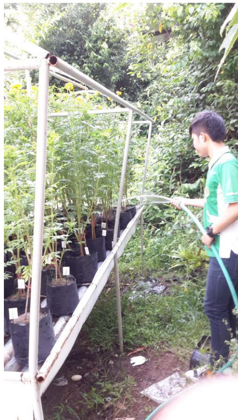
ภาพผนวกที่ 25,26 รดน้ำต้นดาวเรือง