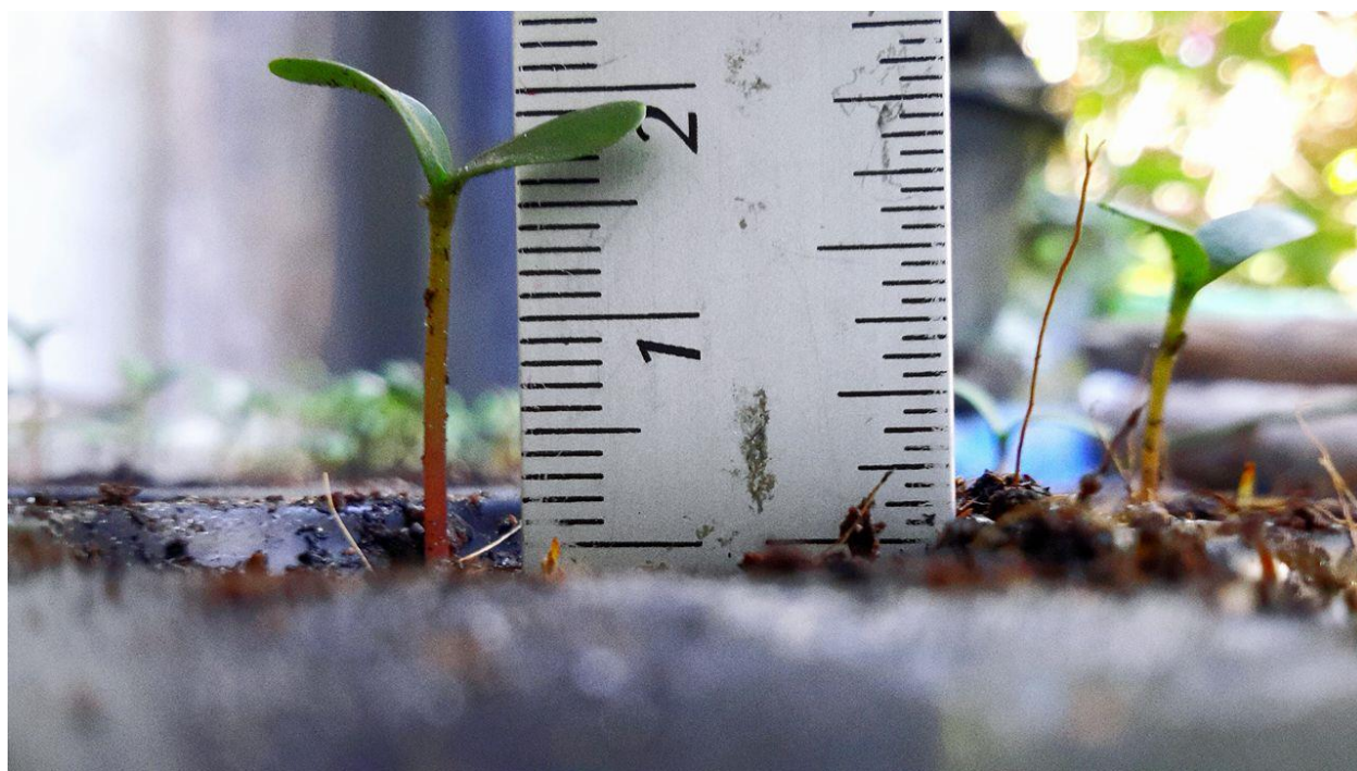
ภาพผนวกที่ 7,8 ต้นกล้าดาวเรืองอายุ 2สัปดาห์