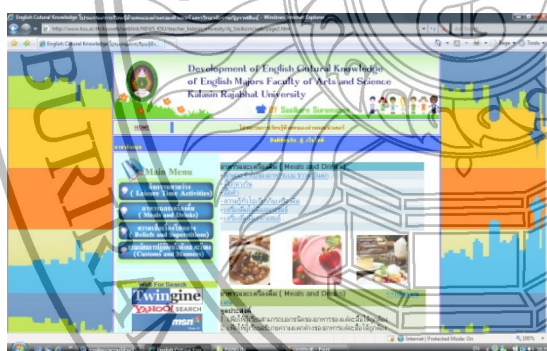
ภาพ 3 เนื้อหาและจุดประสงค์การเรียนรู้ในบทเรียน