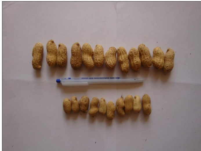
ภาพที่ 2 พันธุ์ขอนแก่น 6 ในกรรมวิธีปรับปรุง (บน) และ พันธุ์ไทนาน 9 ในกรรมวิธีเกษตรกร (ล่าง)