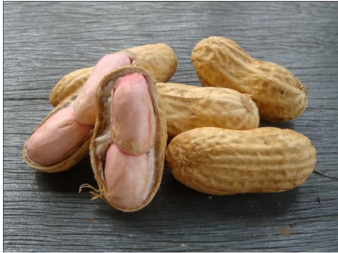
ภาพที่ 1 เมล็ดถั่วลิสงพันธุ์ขอนแก่น 6 ในกรรมวิธีปรับปรุง