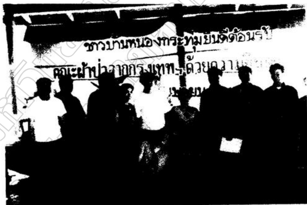
ภาพประกอบ 10 ประธานผ้าป่าฯ คณะครูและคณะกรรมการสถานศึกษาฯ