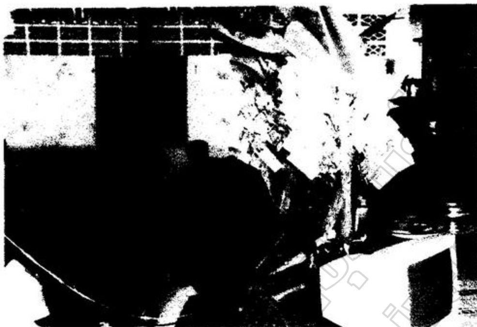
ภาพประกอบ 11 พิธีทอดผ้าป่าฯ