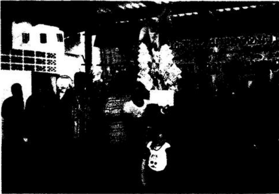
ภาพประกอบ 7 ต้นผ้าป่าสายประเทศไต้หวัน