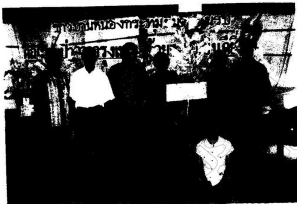
ภาพประกอบ 9 ต้นผ้าป่าประเทศมหาเกา