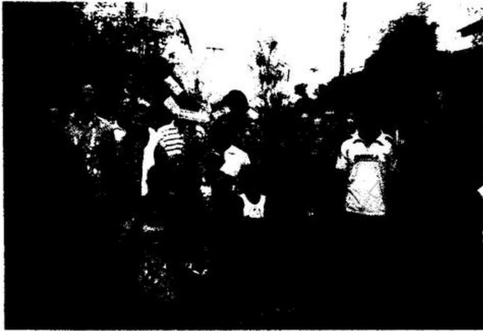
ภาพประกอบ 5 ตั้งขบวนแห่ผ้าป่ากลางหมู่บ้าน