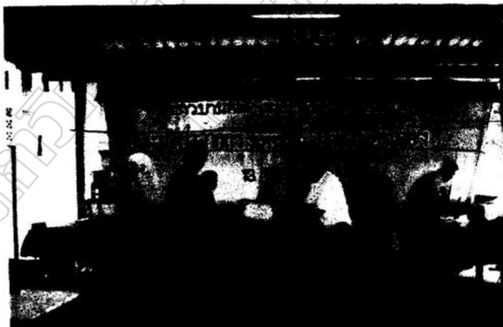
ภาพประกอบ 12 พิธีมอบเกียรติบัตรแก่ประธานผ้าป่าฯ