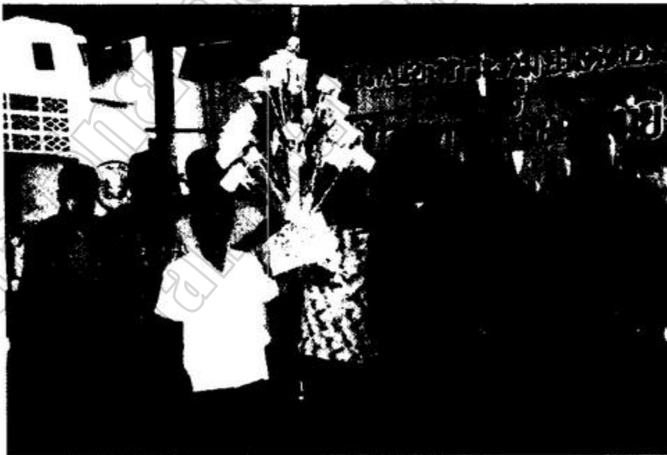
ภาพประกอบ 8 ต้นผ้าป่าสายชาวบ้านหนองกระทุ่ม