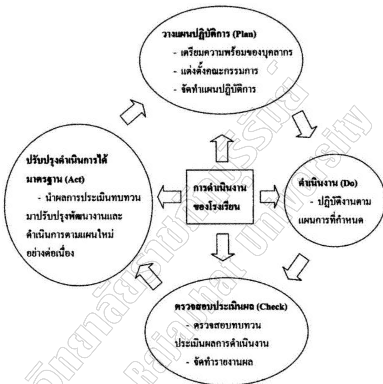
ภาพประกอบ 3 การดำเนินงานประกันคุณภาพภายใน

จากภาพประกอบ 3 ขั้นตอนการดำเนินงานประกันคุณภาพภายใน นั้นเริ่มต้นจากการวางแผนปฏิบัติการ (Plan) เตรียมความพร้อมของบุคลากร แต่งตั้งคณะกรรมการ จัดทำแผนปฏิบัติการ แล้วดำเนินงาน (Do) ปฏิบัติงานตามแผนการที่กำหนด ตรวจสอบประเมินผล (Check) ตรวจสอบทบทวนประเมินผลการดำเนินงาน จัดทำรายงานผล วิเคราะห์ปรับปรุงดำเนินการได้มาตรฐาน (Act) นำผลการประเมินทบทวนมาปรับปรุงพัฒนางานและดำเนินการตามแผนใหม่อย่างต่อเนื่อง