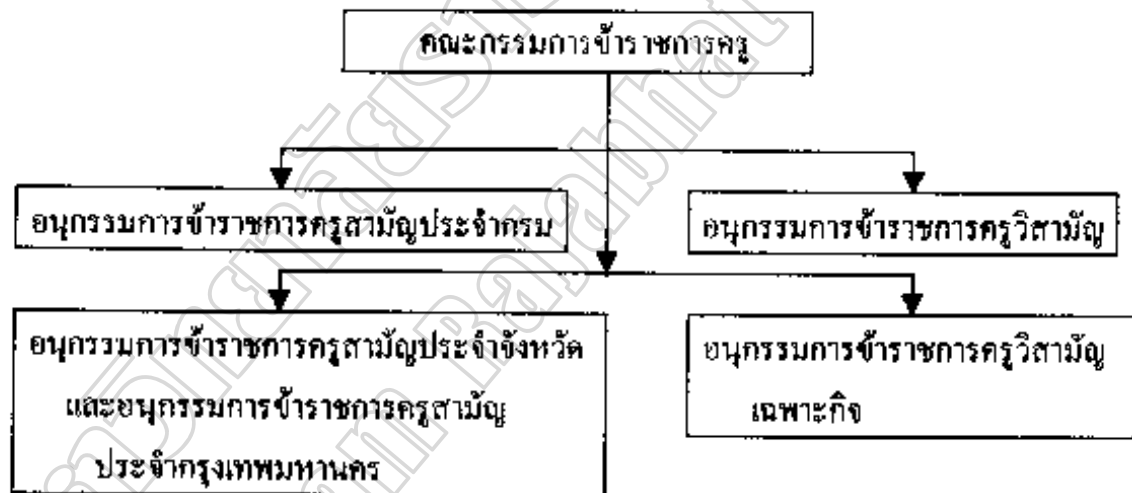
ภาพประกอบ 1 กลไกการปฏิบัติงานของคณะกรรมการข้าราชการครู