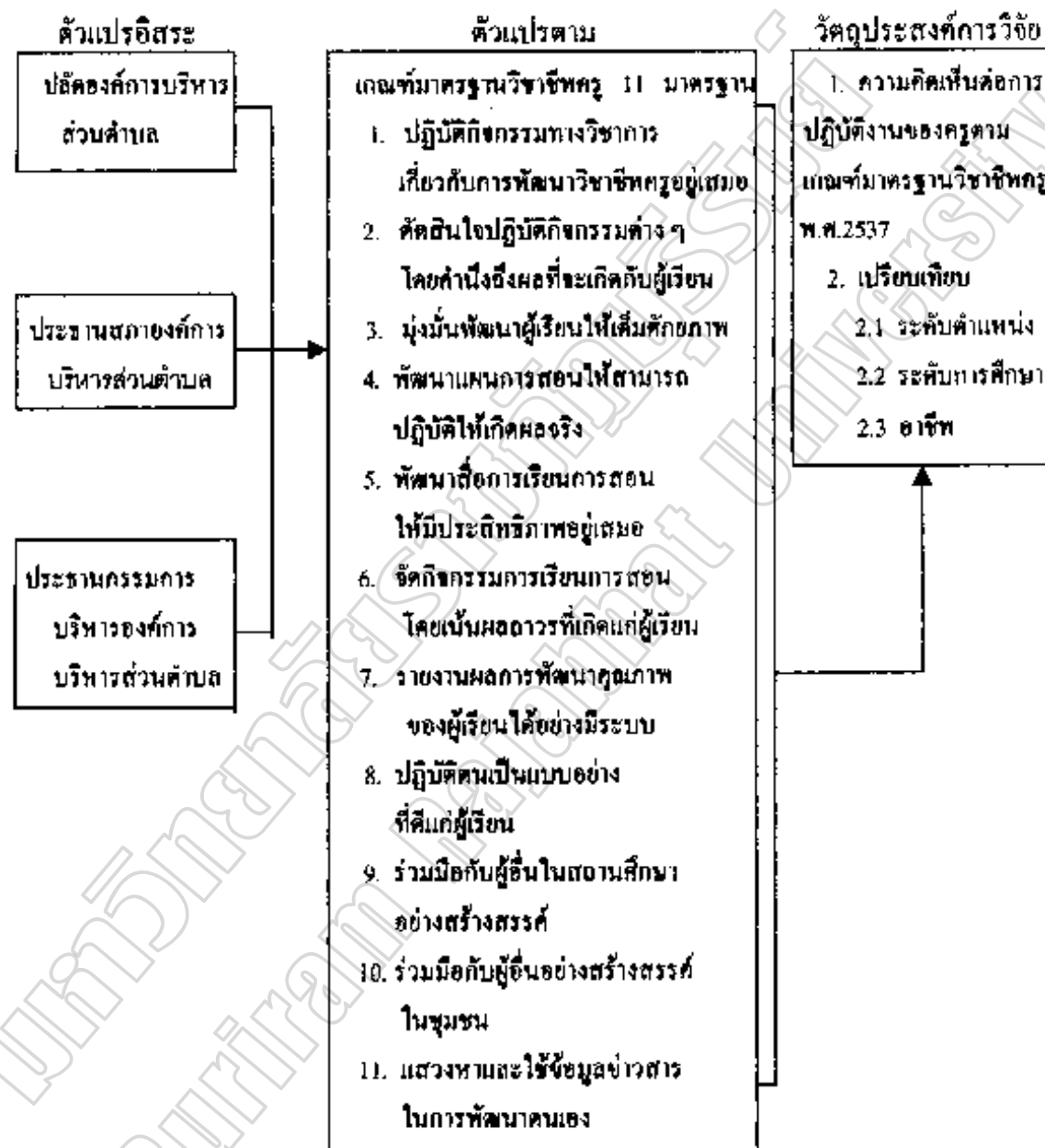
ภาพประกอบ 5 แสดงกรอบความคิดในการวิจัย

ในการวิจัยเพื่อเปรียบเทียบความคิดเห็นของผู้บริหารองค์การบริหารส่วนตำบล จังหวัดบุรีรัมย์ต่อการปฏิบัติงานของครูตามเกณฑ์มาตรฐานวิชาชีพครู พ.ศ. 2537 ผู้วิจัยได้ทำวิจัย โดยกำหนดกรอบความคิดในการวิจัย ดังภาพประกอบ 5 แสดงกรอบความคิดในการวิจัย