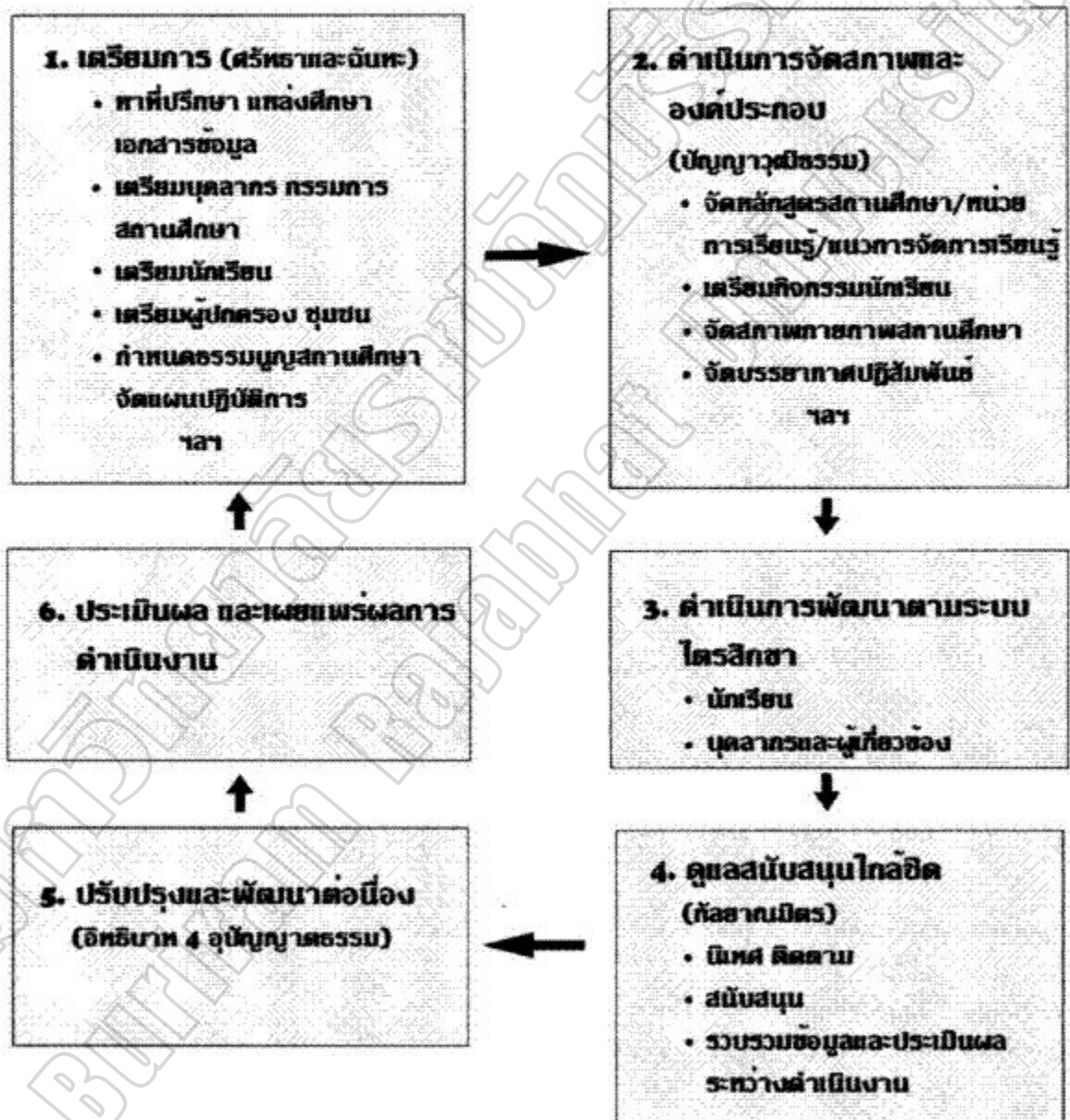
ภาพประกอบ 3 การบริหารจัดการ โรงเรียนวิถีพุทธ ที่มา สำนักพัฒนานวัตกรรมการจัดการศึกษา (2546 : 36)

ลำดับขั้นตอนของการบริหารจัดการ โรงเรียนวิถีพุทธ ดังภาพประกอบ 3