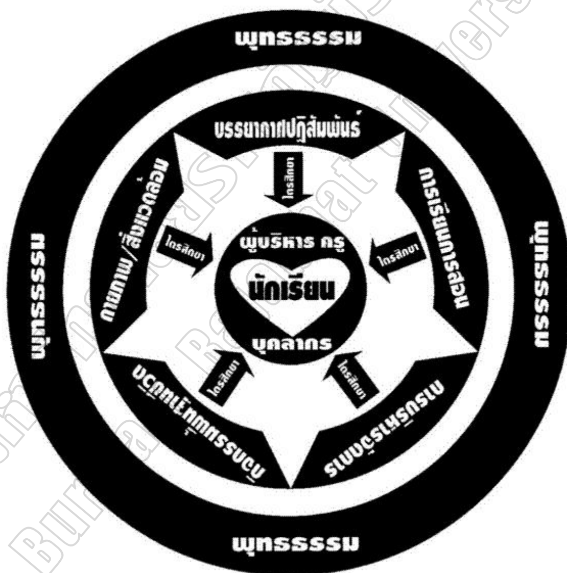
ภาพประกอบ 2 สรุปลักษณะรูปแบบ โรงเรียนวิถีพุทธ ที่มา สำนักพัฒนานวัตกรรมการจัดการศึกษา (2546 : 28)

ลักษณะรูปแบบ โรงเรียนวิถีพุทธสรุปประเด็นสำคัญเป็นภาพประกอบ 2