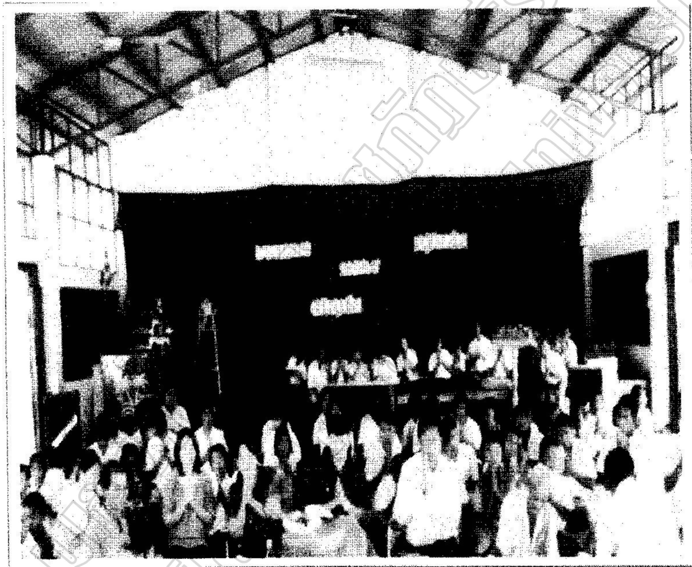
คณาครู วิทยากร และนักเรียนร่วมทำพิธีไหว้ครูคนตรี