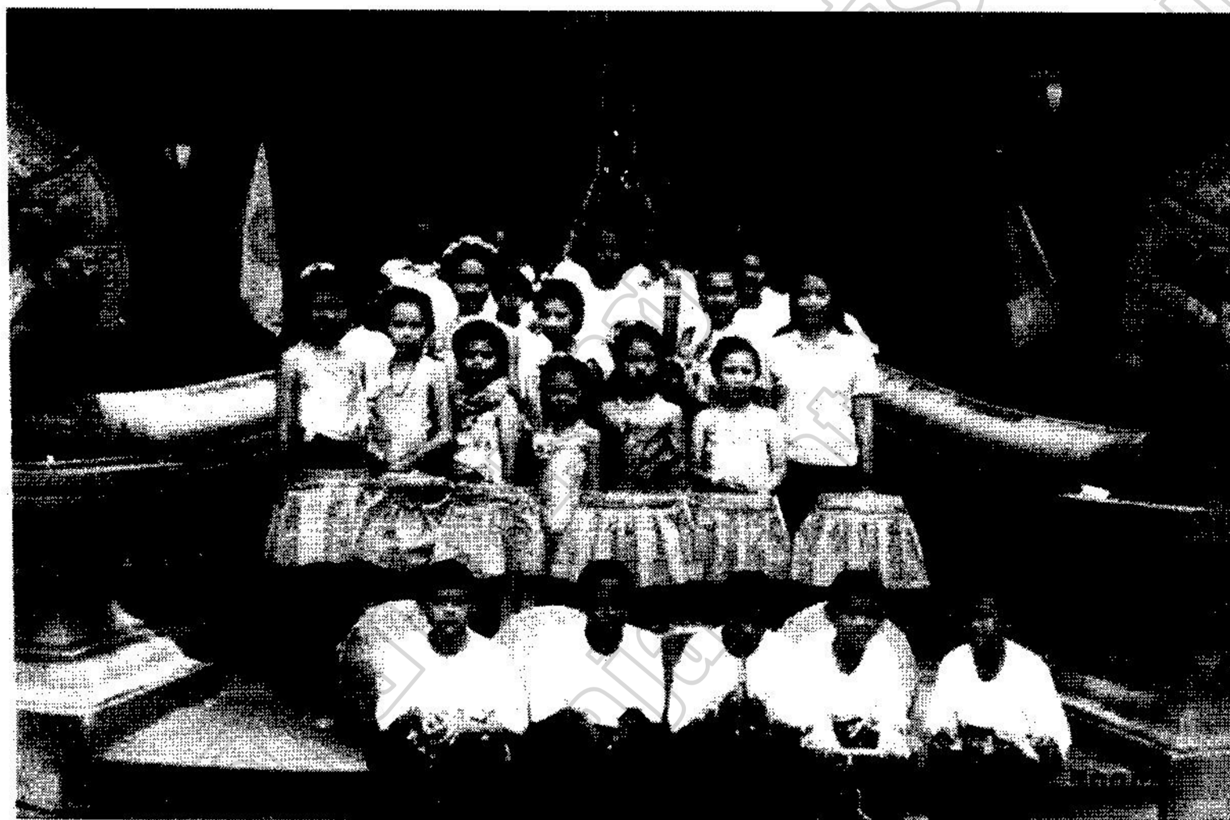
นักเรียนชมรมดนตรีพื้นบ้านมาแสดงเผยแพร่ผลงานสู่สาธารณะชน