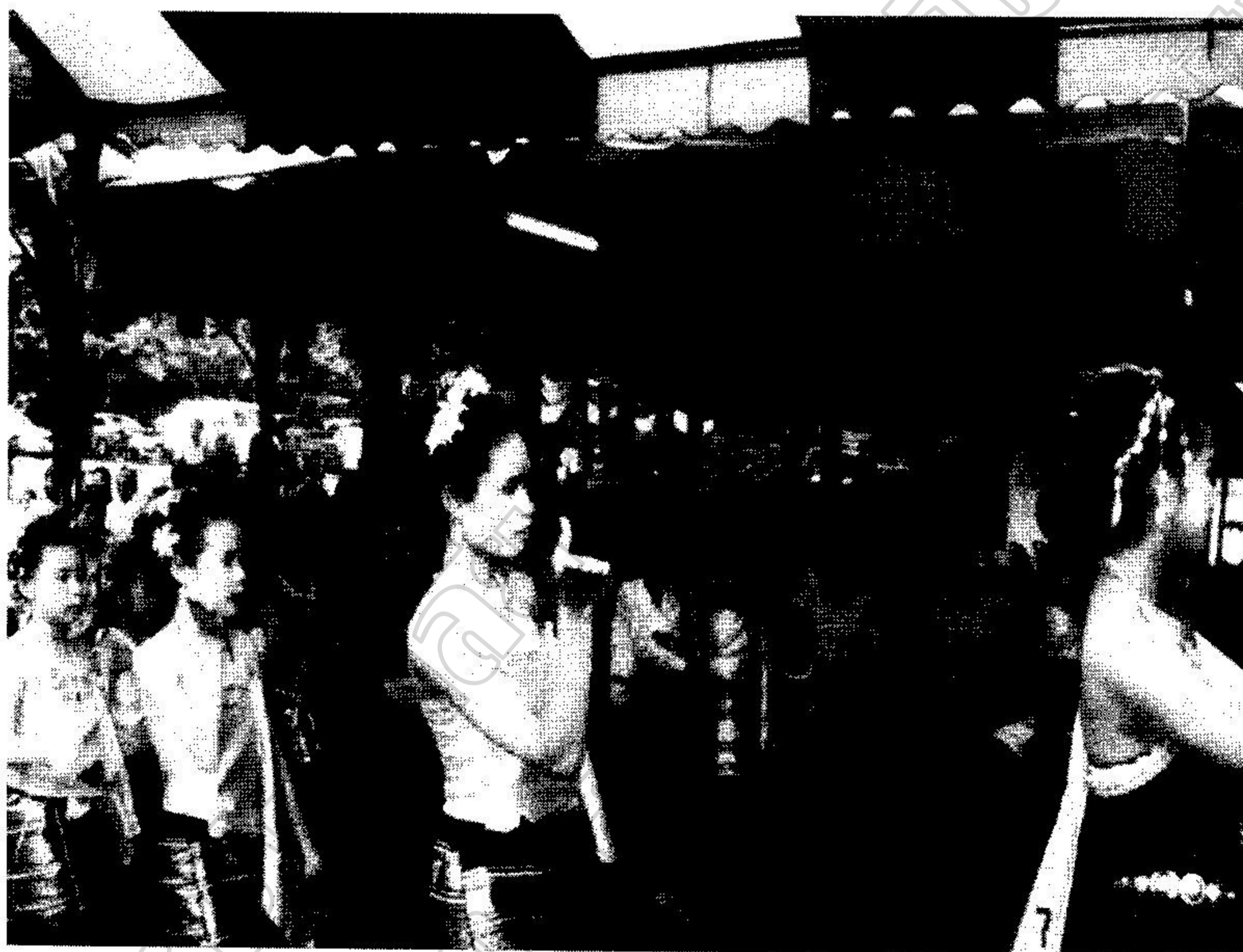
การแสดงของนักเรียนชมรมดนตรีพื้นบ้าน