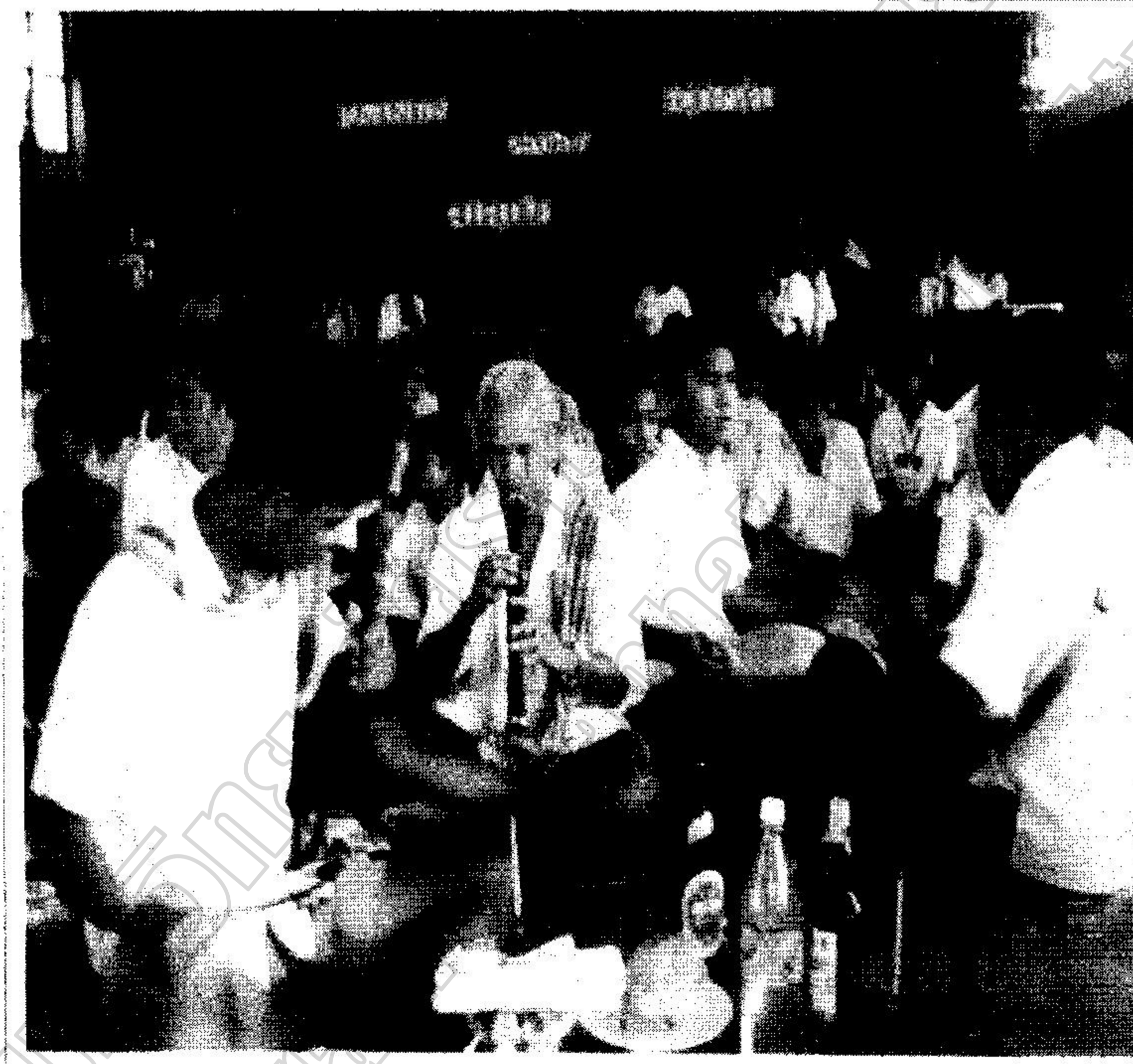
การบรรเลงดนตรีพื้นบ้านเพื่อไหว้ครูบาอาจารย์