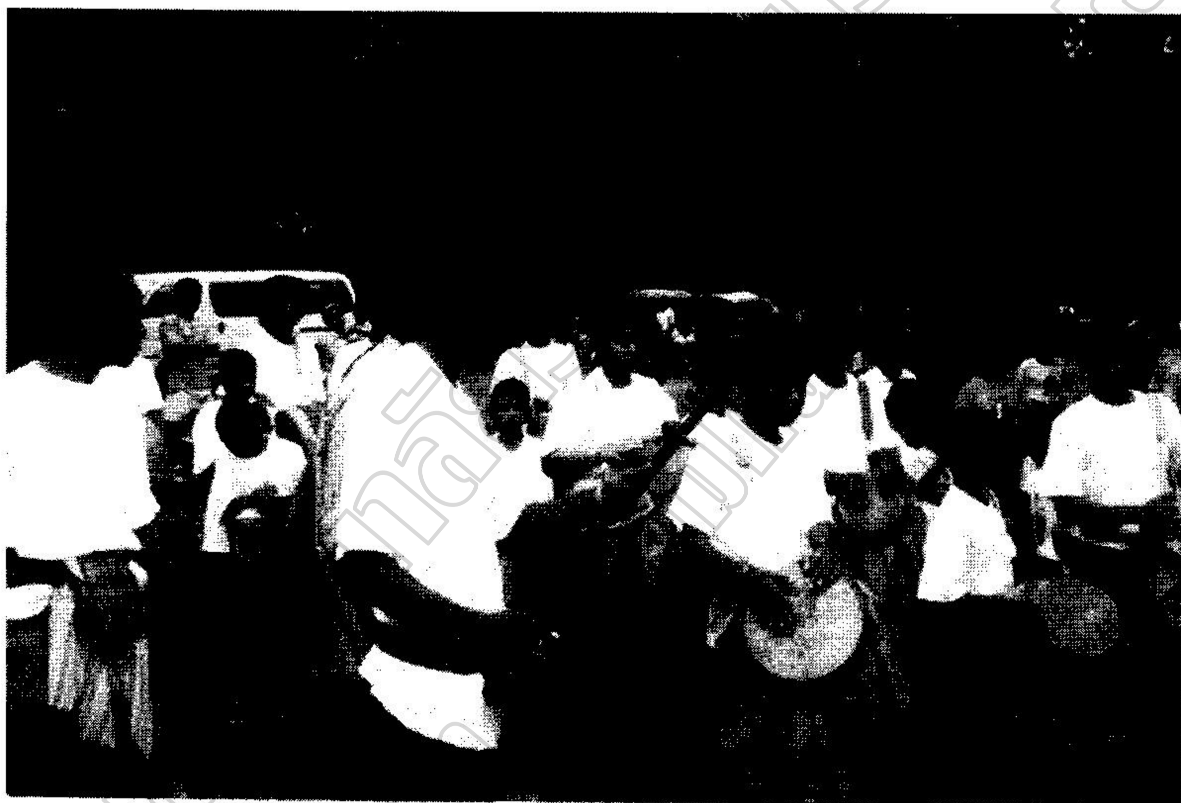
การเผยแพร่ผลงานสู่สาธารณะชน