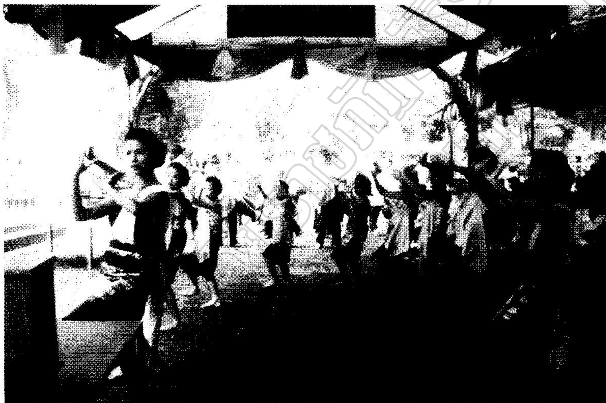
การแสดงของนักเรียนชมรมดนตรีพื้นบ้านสู่สาธารณชน