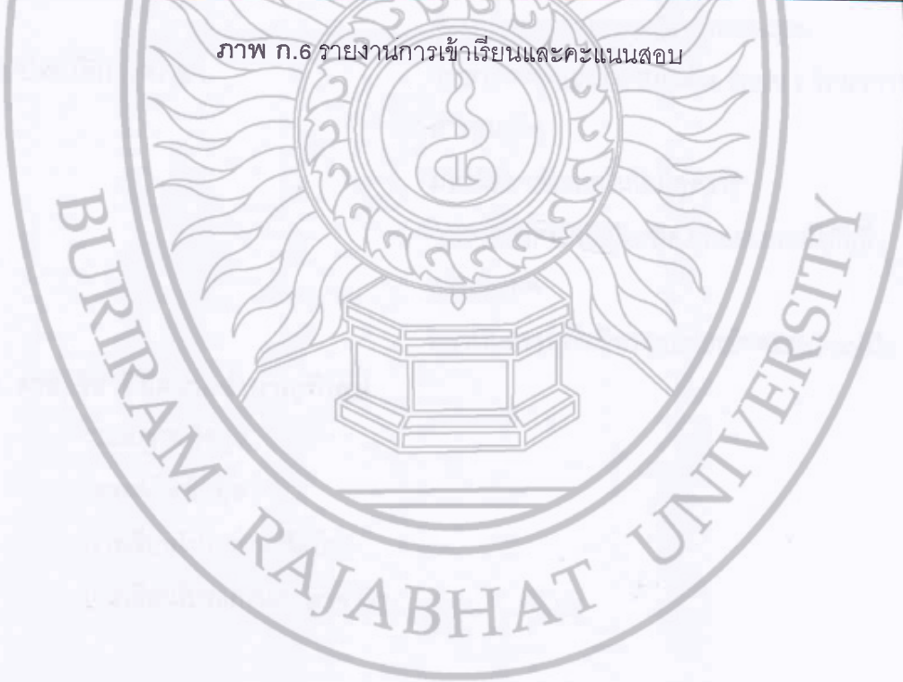
ภาพ ก.6 รายงานการเข้าเรียนและคะแนนสอบ