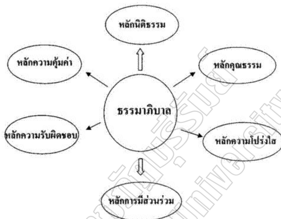
ภาพประกอบ 2 การบริหารตามหลักธรรมาภิบาล