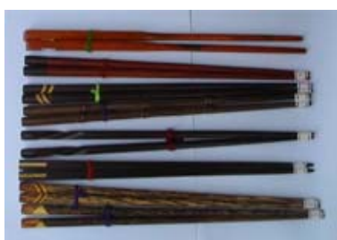
ตะเกียบจากไม้เนื้อแข็ง (พยุง, มะค่า)