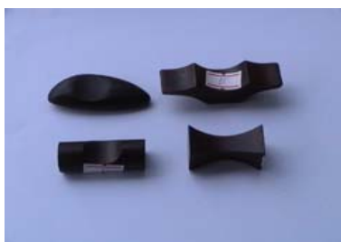
ที่วางตะเกียบ