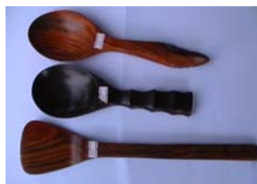
ทัพพีตักข้าว