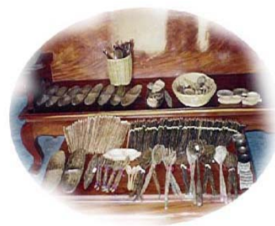
รูปแบบผลิตภัณฑ์จากไม้