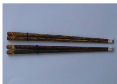
ตะเกียบจากไม้ตาล ไม้มะพร้าว