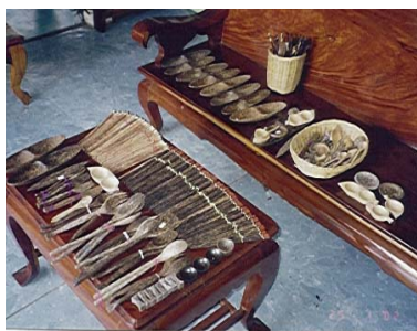
ชนิดผลิตภัณฑ์จากไม้