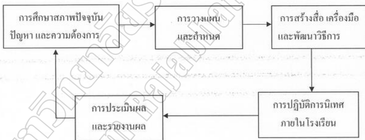
ภาพประกอบ 2 ขั้นตอนการนิเทศภายในโรงเรียน

กระบวนการนิเทศภายในโรงเรียนเป็นกิจกรรมที่สำคัญที่สุด โดยเป็นการสนับสนุนการเรียนการสอนภายในโรงเรียน ให้ดำเนินไปอย่างมีประสิทธิภาพ ซึ่งเป็นขั้นตอนปฏิบัติการทั้งด้านกระบวนการบริหารการนิเทศและการเรียนการสอนควบคู่กันไปอย่างเป็นระบบและต่อเนื่อง ขั้นตอนกระบวนการนิเทศภายในโรงเรียนประกอบด้วย การศึกษาสภาพปัจจุบัน ปัญหาการวางแผน การสร้างสื่อ เครื่องมือและพัฒนาวิธีการ การประเมินผลและรายงานผล ดังภาพประกอบ 2 ( ชำนาญ แสงจันทร์. 2555 : 11-29)