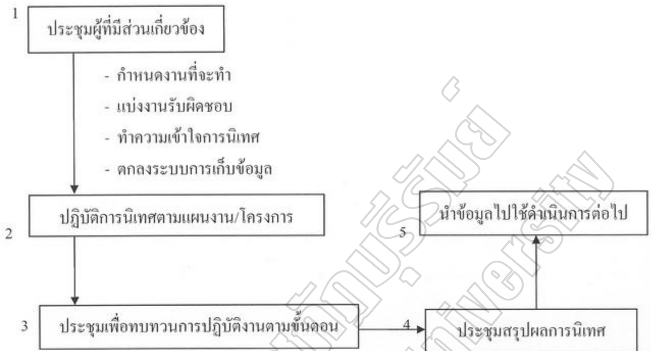
ภาพประกอบ 4 ขั้นตอนการปฏิบัติการนิเทศภายในให้ได้ผลดี