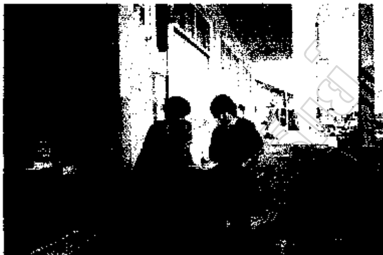
ภาพประกอบ 10 แสดงผู้วิจัยกำลังเก็บข้อมูลจากประชาชนในชุมชนตลาด บ.ช.ส.