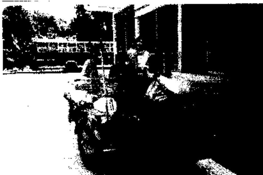
ภาพประกอบ 4 แสดงผู้นำชุมชนตลาด บ.ช.ส กับขยะที่รวบรวมไว้รอการจำหน่าย