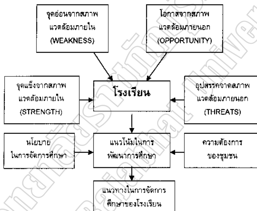
ภาพประกอบ 1 แสดงการวิเคราะห์สภาพโรงเรียนเพื่อกำหนดแนวทางการจัดการศึกษาของโรงเรียน โดยใช้เทคนิค SWOT

ของชุมชนท้องถิ่น โดยแนวโน้มการพัฒนาการศึกษาของ โรงเรียนต้องเป็นไปได้ในการพัฒนาตามเงื่อนไขข้อจำกัดและองค์ประกอบที่มีอิทธิพลต่อการจัดการศึกษา ซึ่งได้แก่ นโยบายในการจัดการศึกษาของหน่วยงานต้นสังกัด รูปแบบการบริหารงานของการบริหารงานของโรงเรียน และปัจจัยที่เกี่ยวข้องอื่นๆ การศึกษาความต้องการของชุมชนเป็นการสำรวจความต้องการขององค์กรชุมชนที่โรงเรียนตั้งอยู่ ความต้องการของผู้ปกครองนักเรียนและความต้องการของชาวบ้านในชุมชน สรุปมาเป็นแนวทางในการดำเนินงานเพื่อตอบสนองความต้องการของชุมชนการวิเคราะห์สภาพของโรงเรียน เพื่อเป็นแนวทางในการพัฒนาการศึกษาของโรงเรียนสามารถสรุปเป็นภาพประกอบ ได้ดังนี้