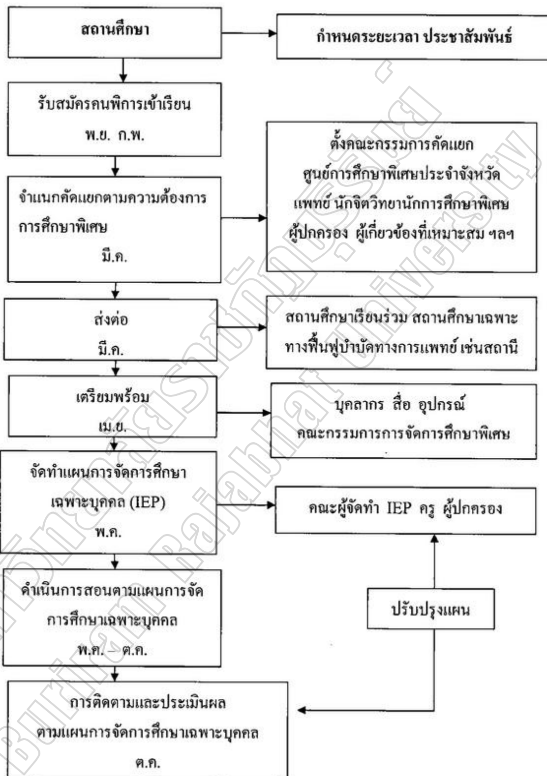
ภาพประกอบ 2 ปฏิทินงานการรับเด็กพิเศษเข้าเรียนในสถานศึกษา