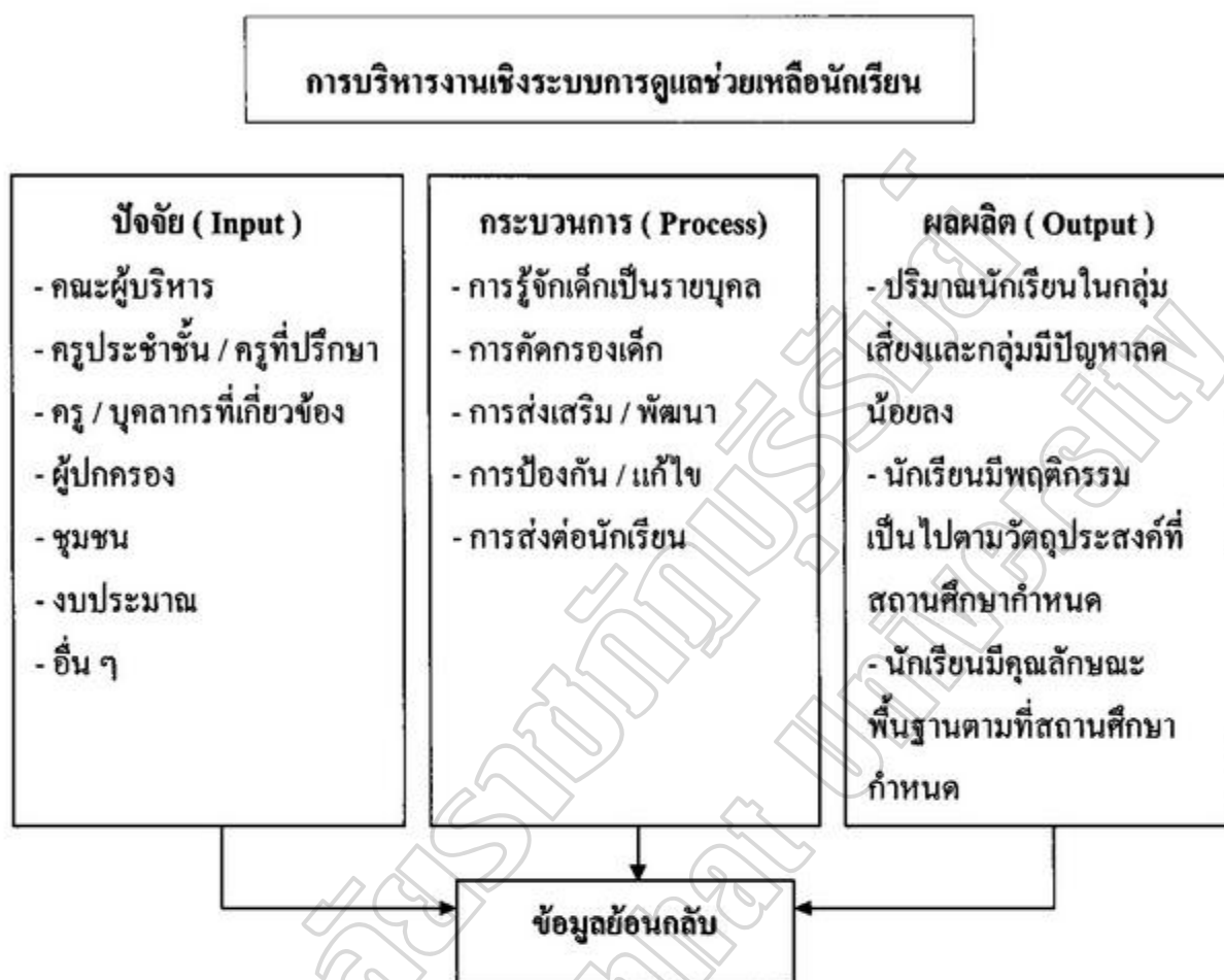
ภาพประกอบ 1 ระบบการดูแลช่วยเหลือนักเรียน ที่มา : อภิชาติ เสรณีวิจัยกิจการ ( 2547 : 59 – 64 )

ในการดำเนินงานตามระบบการดูแลช่วยเหลือนักเรียน ผู้บริหารโรงเรียนจำเป็นต้องตระหนักและรับผิดชอบ การบริหารจัดการวางระบบการดูแลช่วยเหลือนักเรียนร่วมกับครูทุกคนในโรงเรียนรวมทั้งผู้ที่เกี่ยวข้อง โดยมีแนวทางในการดำเนินงานดังนี้