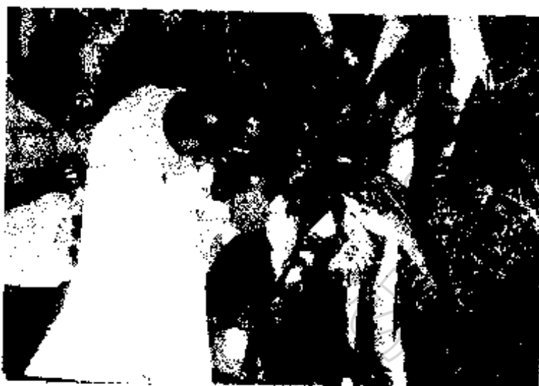
ภาพประกอบ 6 นายทองคำ ยิ้มรัมย์ ครูภูมิปัญญาท้องถิ่น โรงเรียนมหิตลอนุสรณ์กำลังสอน เรื่องการเสริมรากมะม่วงให้แข็งแรง