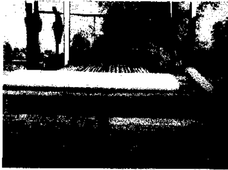
ภาพประกอบ 16 กี้ออผ้า ที่บ้านครูภูมิปัญญาท้องถิ่น บ้านกะชาย