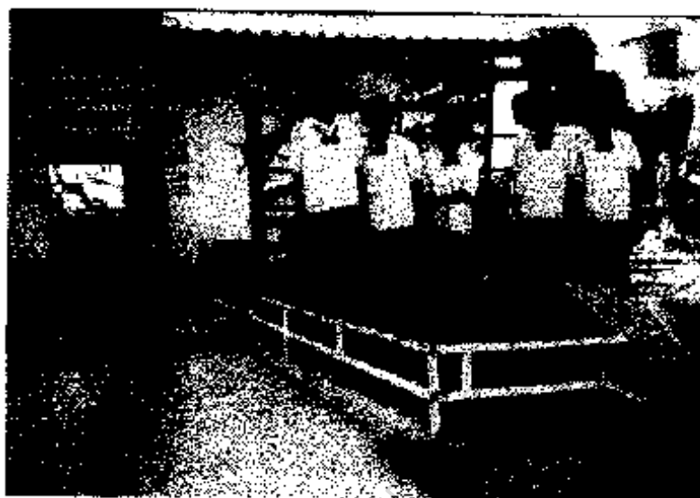
ภาพประกอบ 14 นักเรียนโรงเรียนวัดบ้านกะชาย กับกีทอผ้า