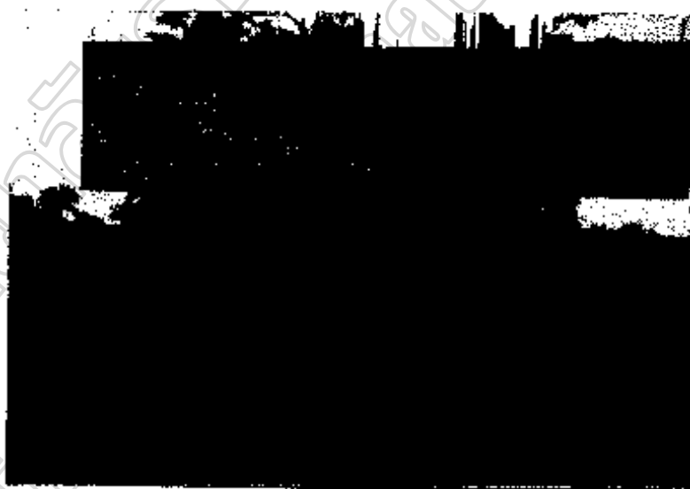
ภาพประกอบ 13 โรงเรียนวัดบ้านกะชาย