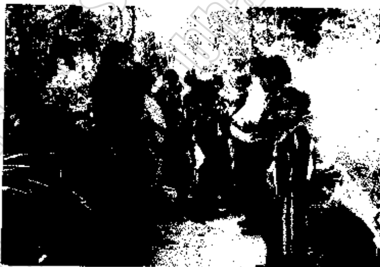
ภาพประกอบ 9 นักเรียนบ้านหนองดัดพัฒนา ในแหล่งเรียนรู้ (ป่าชุมชน)