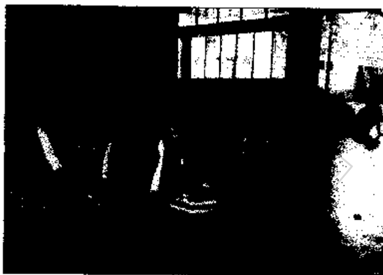
ภาพประกอบ 10 บรรยากาศการฟังบรรยายจากครูภูมิปัญญาท้องถิ่น ของนักเรียน โรงเรียนบ้านหนองแต้พัฒนา