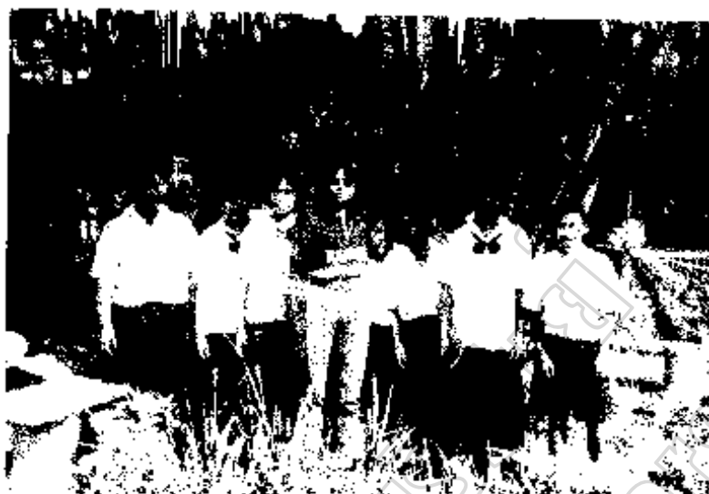
ภาพประกอบ 18 ผู้วิจัย กับนักเรียนโรงเรียนวัดบ้านปลัดชุมพุก