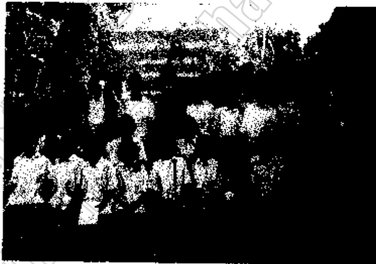
ภาพประกอบ 5 ผู้วิจัยกับนักเรียนชั้น ม. 2 โรงเรียนมหิตลอนุสรณ์ และครูภูมิปัญญาท้องถิ่น