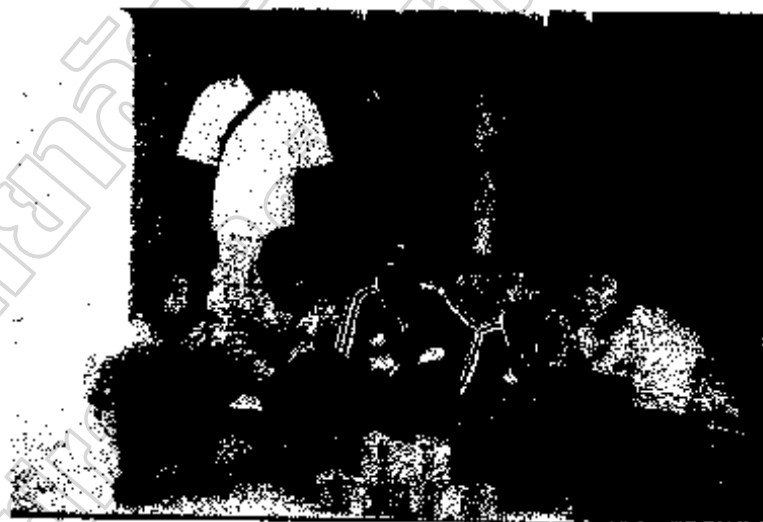
ภาพประกอบ 11 นักเรียนบ้านตงเย็น กับผลงานอิฐดิน - ซีเมนต์ พร้อมครูภูมิปัญญาท้องถิ่น ( นายสัมฤทธิ์ ชลอชล )