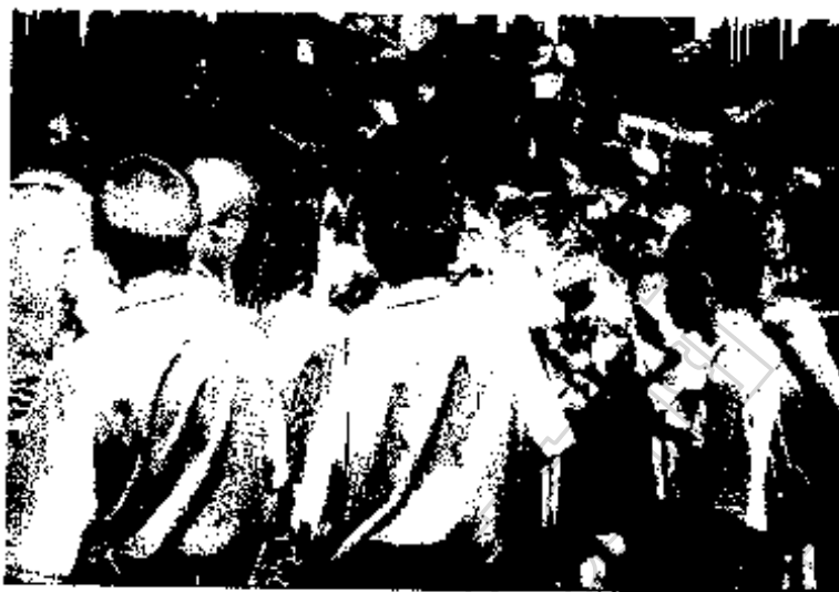
ภาพประกอบ 8 นักเรียนบ้านหนองดัดพัฒนา กำลังเรียนรู้เรื่องพืชสมุนไพร ในป่าชุมชน หลังโรงเรียน