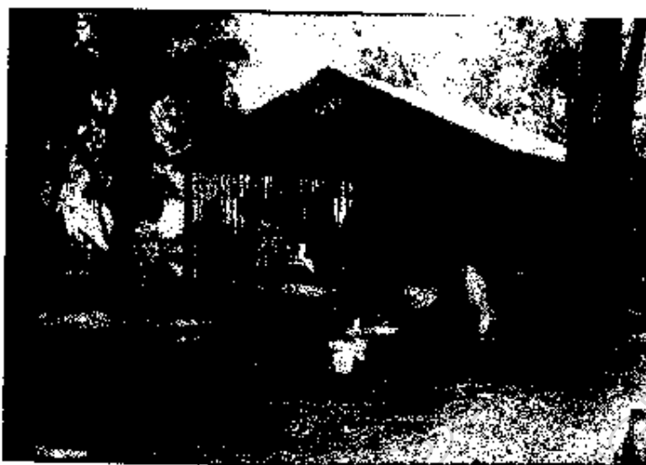
ภาพประกอบ 20 นักเรียนโรงเรียนวัดบ้านปลัดมูกกับการทำข้าวกล้อง