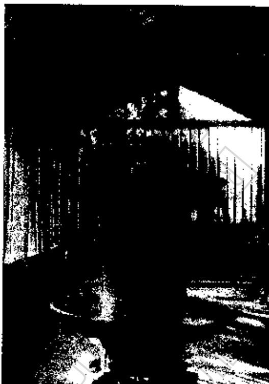
ภาพประกอบ 22 เครื่องสีข้าวกล้อง