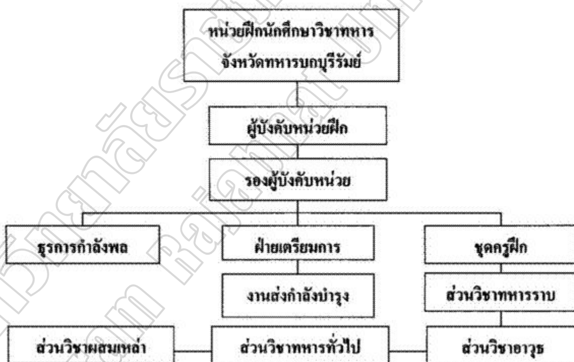
ภาพประกอบ 2 โครงสร้างหน่วยฝึกนักศึกษาวิชาทหารจังหวัดทหารบกบุรีรัมย์ (จังหวัดทหารบกบุรีรัมย์. 2545 : 40)

หน่วยฝึกนักศึกษาวิชาทหารจังหวัดทหารบกบุรีรัมย์ มีโครงสร้างตามอัตรการจัดยุทธโรปกรณ์กองทัพบก โดยดูได้จากแผนภาพที่นำด้านล่างนี้